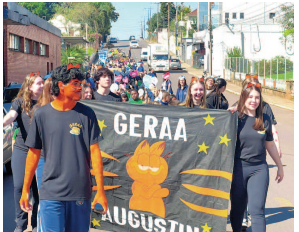
Escola é uma das mais antigas instituições de ensino do estado

A fala da coordenadora sintetiza o espíri-