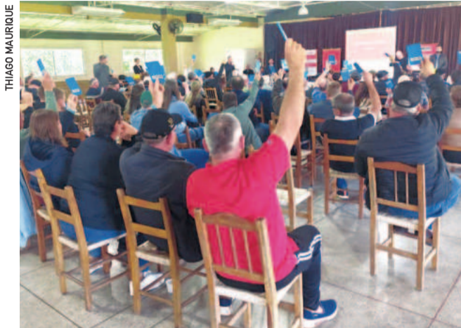
Os associados participantes aprovaram por unanimidade a prestação de contas apresentada

O primeiro semestre também foi marcado pela quitação das rescisões trabalhistas de cerca de 2 mil ex-funcionários desligados, somando mais de R$ 32 milhões. “Era uma obri-