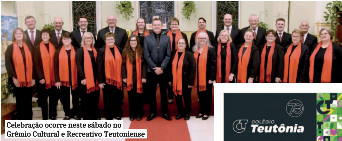
Celebração ocorre neste sábado no Grêmio Cultural e Recreativo Teutoniense