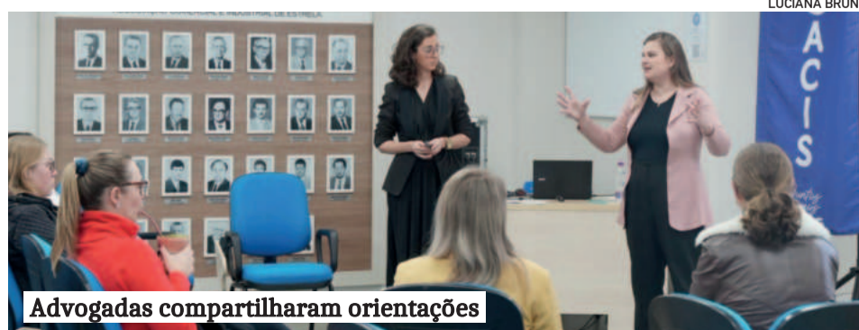
Advogadas compartilharam orientações