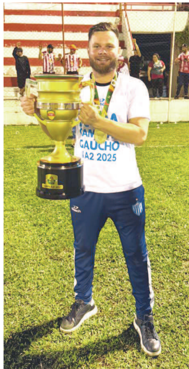
A meta é recolocar o Novo Hamburgo como uma das forças do estado

A realidade financeira, porém, impõe limites. Muitos jovens se destacam, mas recebem propostas de clubes maiores como Grêmio, Internacional e Juventude ou de equipes de fora do estado. Nessas situações, o Novo Hamburgo busca alternativas que beneficiem o clube sem frear a carreira do atleta. “Nem sempre conseguimos segurar, mas