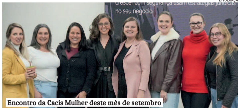
Encontro da Cacis Mulher deste mês de setembro

bigode ficou no passado. Hoje, empreendedoras que querem crescer com segurança usam estratégias jurídicas no seu negócio”, finalizou.