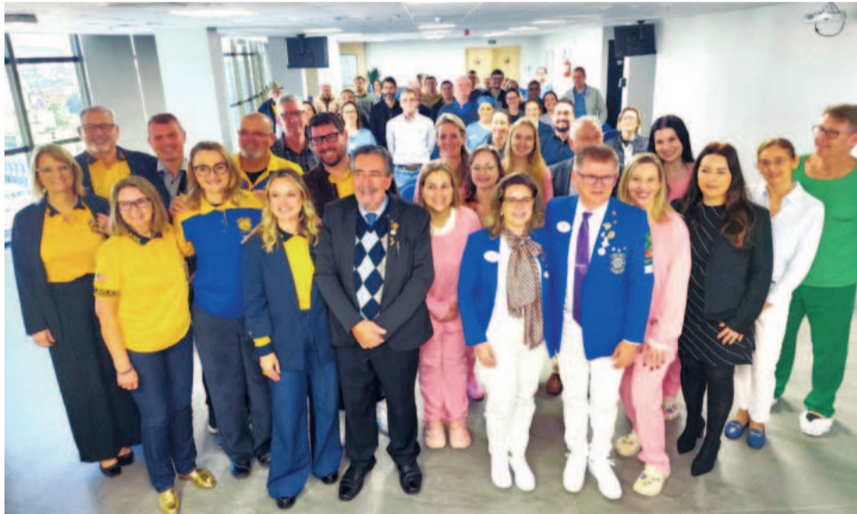
Representantes do Lions, dirigentes e profissionais do hospital participaram da cerimônia de anúncio da nova ala pediátrica