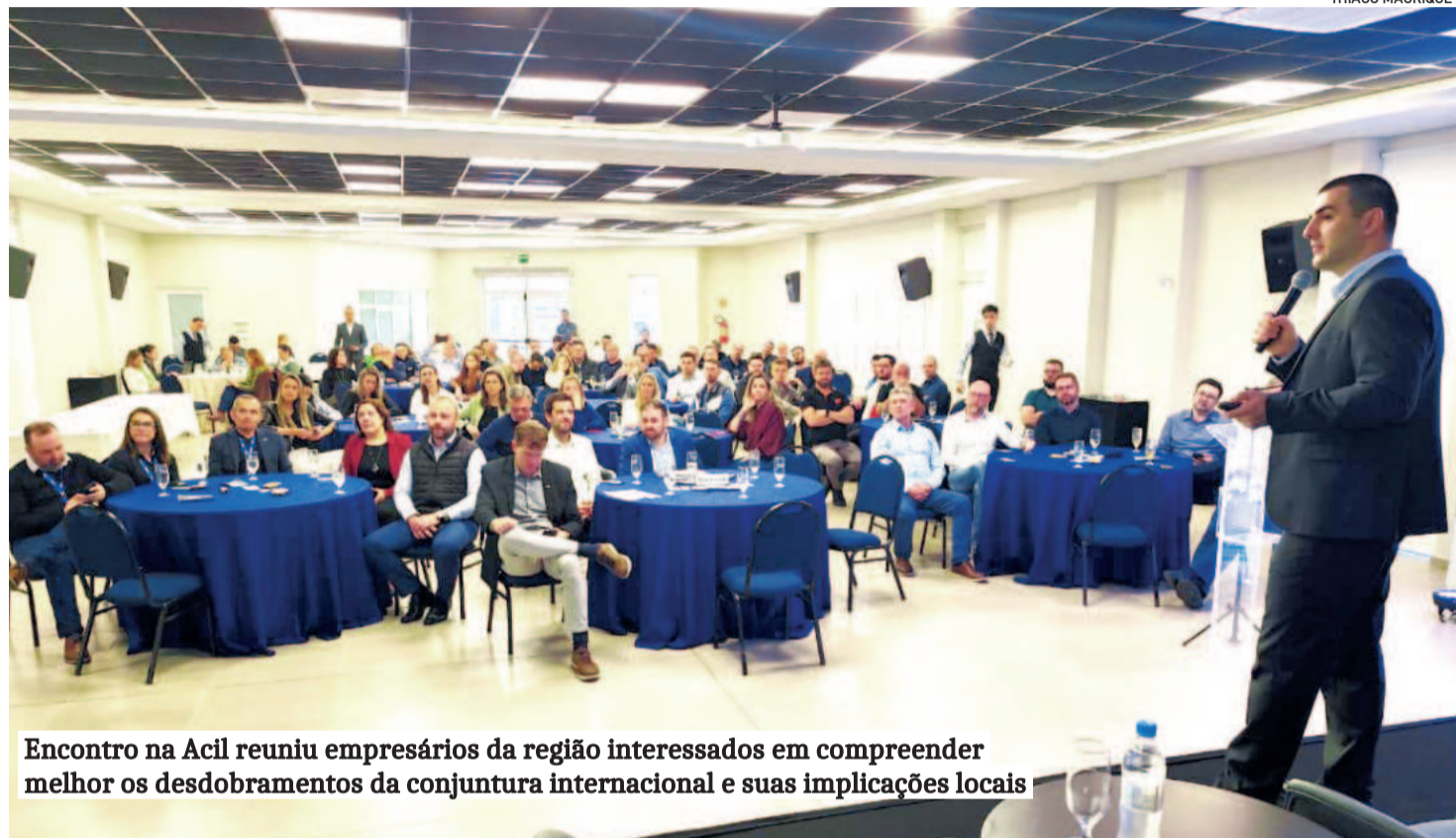
Encontro na Acil reuniu empresários da região interessados em compreender melhor os desdobramentos da conjuntura internacional e suas implicações locais