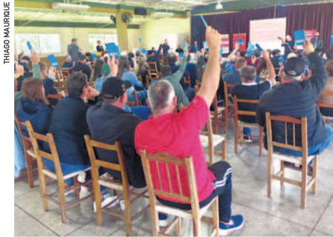
Os associados participantes aprovaram por unanimidade a prestação de contas apresentada

O primeiro semestre também foi marcado pela quitação das rescisões trabalhistas de cerca de 2 mil ex-funcionários desligados, somando mais de R$ 32 milhões. “Era uma obri-