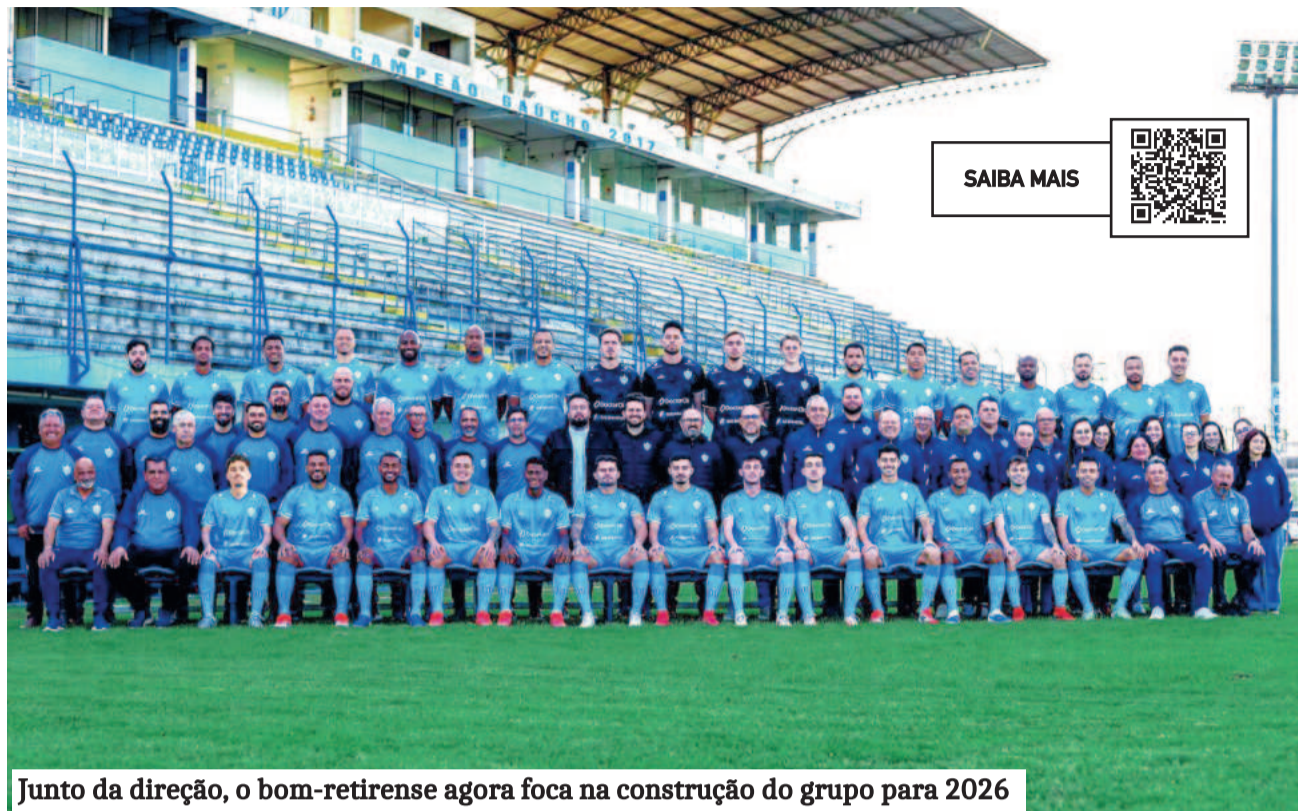
Junto da direção, o bom-retireense agora foca na construção do grupo para 2026