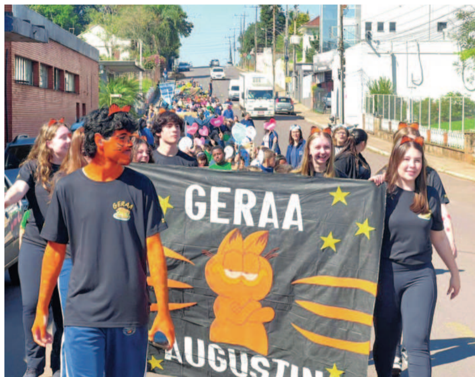
Escola é uma das mais antigas instituições de ensino do estado

A fala da coordenadora sintetiza o espíri-