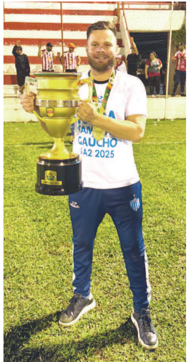
A meta é recolocar o Novo Hamburgo como uma das forças do estado

A realidade financeira, porém, impõe limites. Muitos jovens se destacam, mas recebem propostas de clubes maiores como Grêmio, Internacional e Juventude ou de equipes de fora do estado. Nessas situações, o Novo Hamburgo busca alternativas que beneficiem o clube sem frear a carreira do atleta. “Nem sempre conseguimos segurar, mas