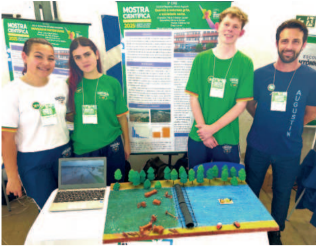
Alunos do Augustin abordaram prevenção a enchentes com barreiras ecológicas