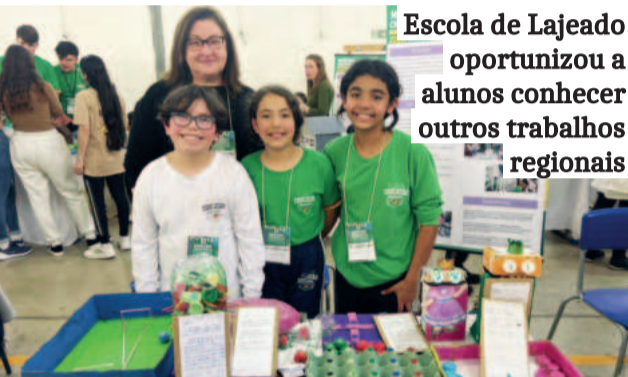
Escola de Lajeado oportunizou a alunos conhecer outros trabalhos regionais

rante a Mostra Científica Regional da 3ª CRE, realizada no ginásio da Escola Estadual Vidal de Negreiros, em Estrela. O evento reuniu dezenas de propostas de escolas estaduais, alinhadas ao tema “COP 30 - Criando caminhos para a sustentabilidade”.