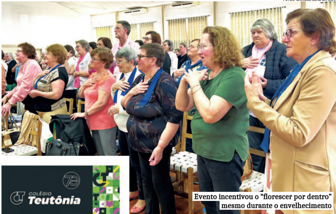
Evento incentivou o “florescer por dentro” mesmo durante o envelhecimento

Cerca de 480 senhoras de 15 paróquias do Sínodo regional se encontraram para propagar a palavra de Deus nesta semana