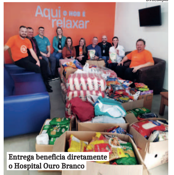
Entrega beneficiana diretamente ao Hospital Ouro Branco

A campanha teve a colaboração direta de estabelecimentos locais. "Fizemos ações nos sábados de manhã nos mercados. Já agradecemos também os mercados Zart, Esquinão e Frederico pela disponibilidade. Eles nos oportunizaram estar na frente dos mercados e, quando o associado ou cliente vinha, a gente explicava a operação.