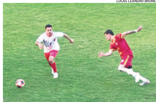
Canabarense jogar mais uma vez no Campo do Esperança, em Languiru