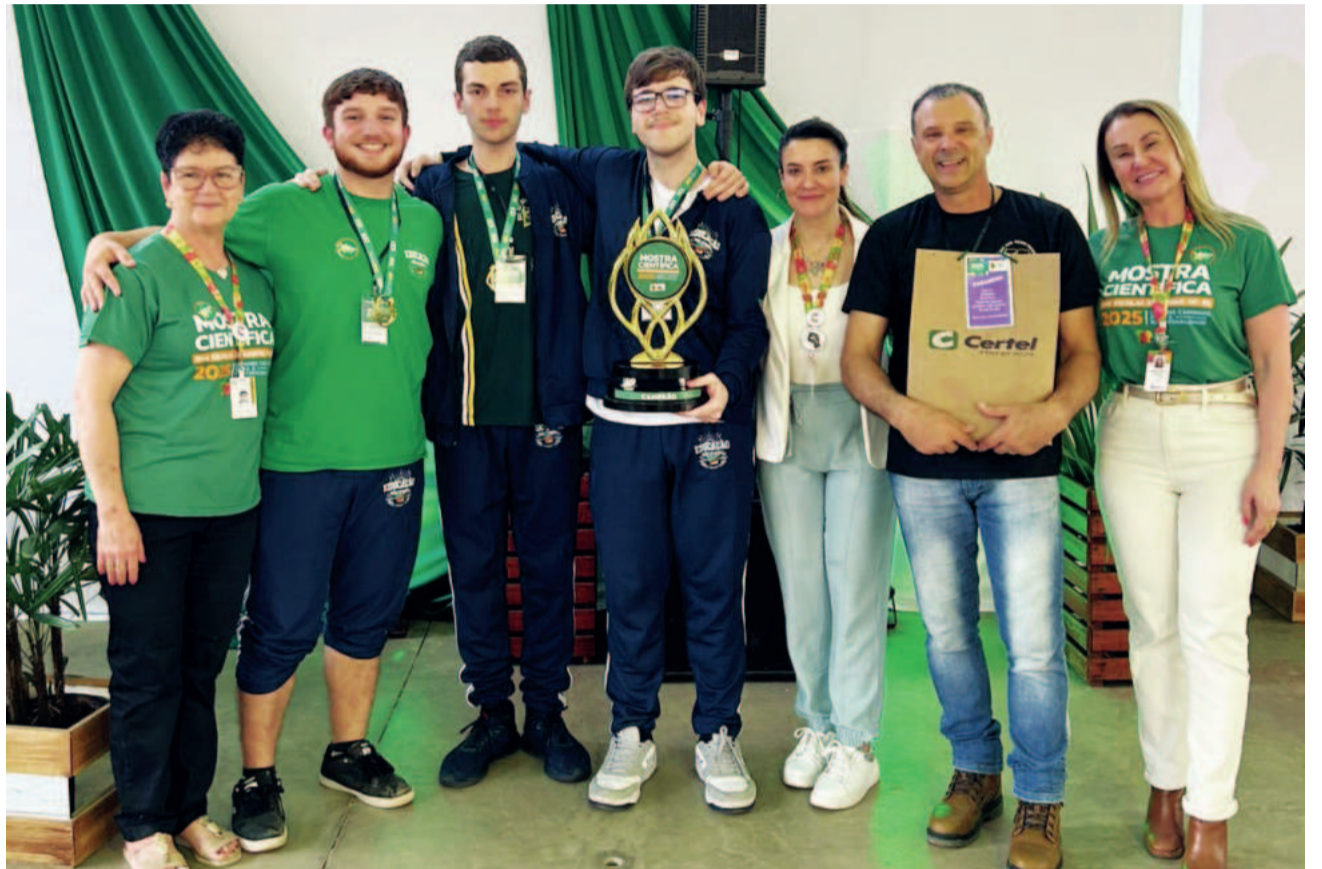
Alunos conquistaram vaga para expor trabalho na final, que ocorre em novembro, em Novo Hamburgo

A Administração Municipal de Westfália realizará Audiência Pública no dia 29 de setembro, às 16h, na sala da Câmara de Vereadores, para avaliação de metas fiscais referentes ao 2º quadrimestre do exercício de 2025, nos termos do § 4º do art. 9º da Lei Complementar nº 101/2000.