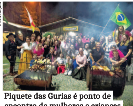
Piquete das Guriás é ponto de encontro de mulheres e crianças