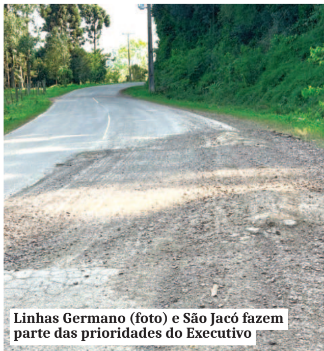
Linhas Germano (foto) e São Jacó fazem parte das prioridades do Executivo