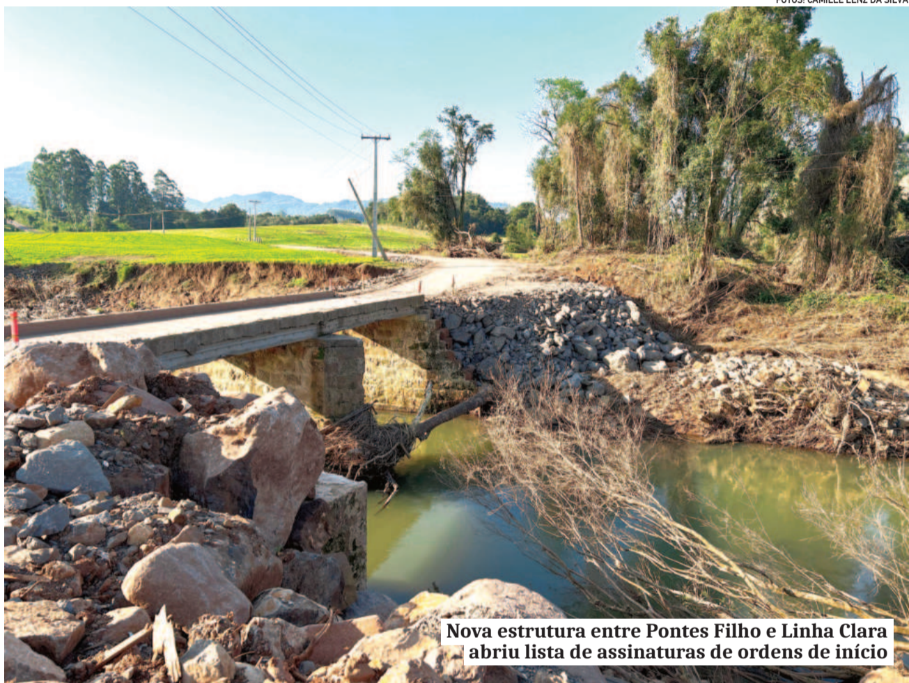
Nova estrutura entre Pontes Filho e Linha Clara abriu lista de assinaturas de ordens de início