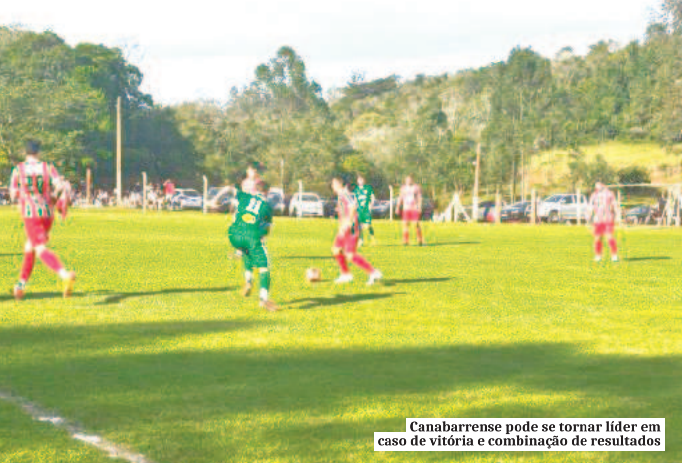
Canabarense pode se tornar líder em caso de vitória e combinação de resultados

meiros. O Rudi conquistou 4 pontos em quatro partidas e vive momento delicado. O Brasil é 4º colocado com 9 pontos e está classificado.