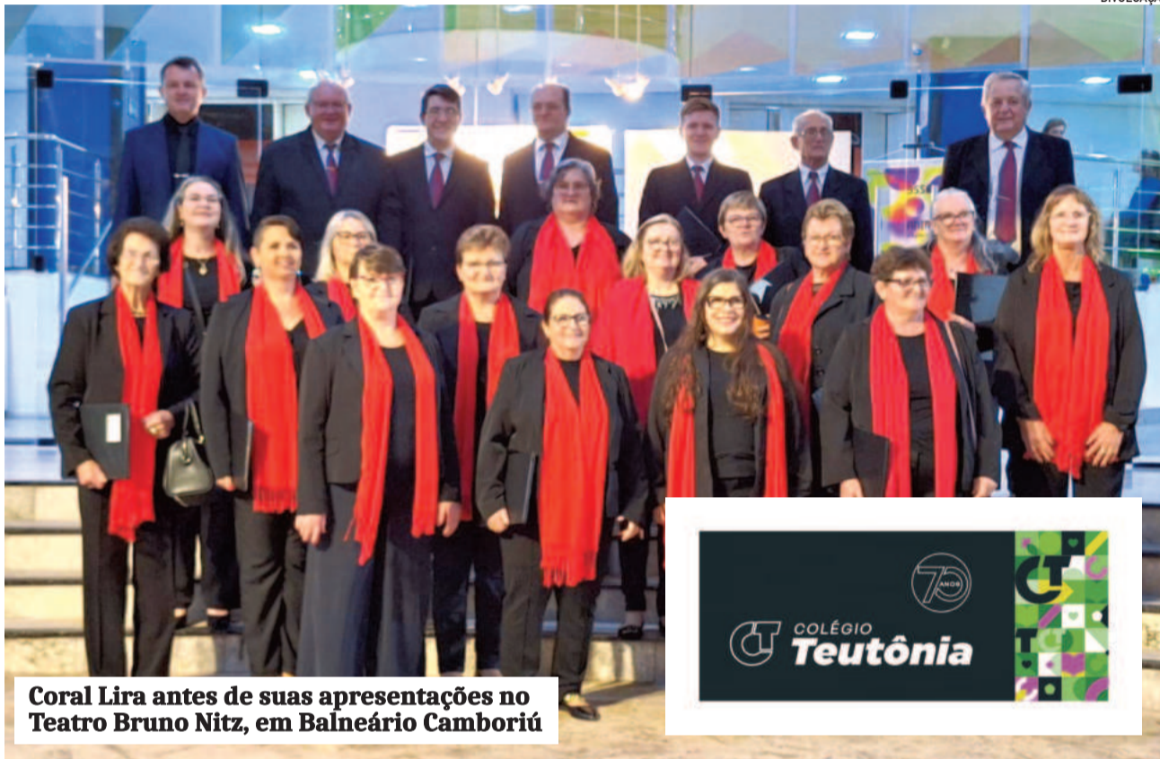
Coro Lira antes de suas apresentações no Teatro Bruno Nitz, em Balneário Camboriú