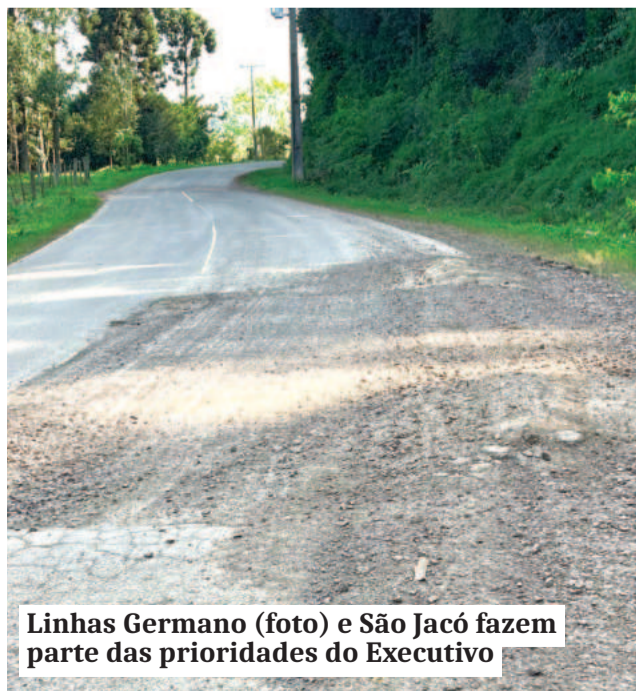
Linhas Germano (foto) e São Jacó fazem parte das prioridades do Executivo