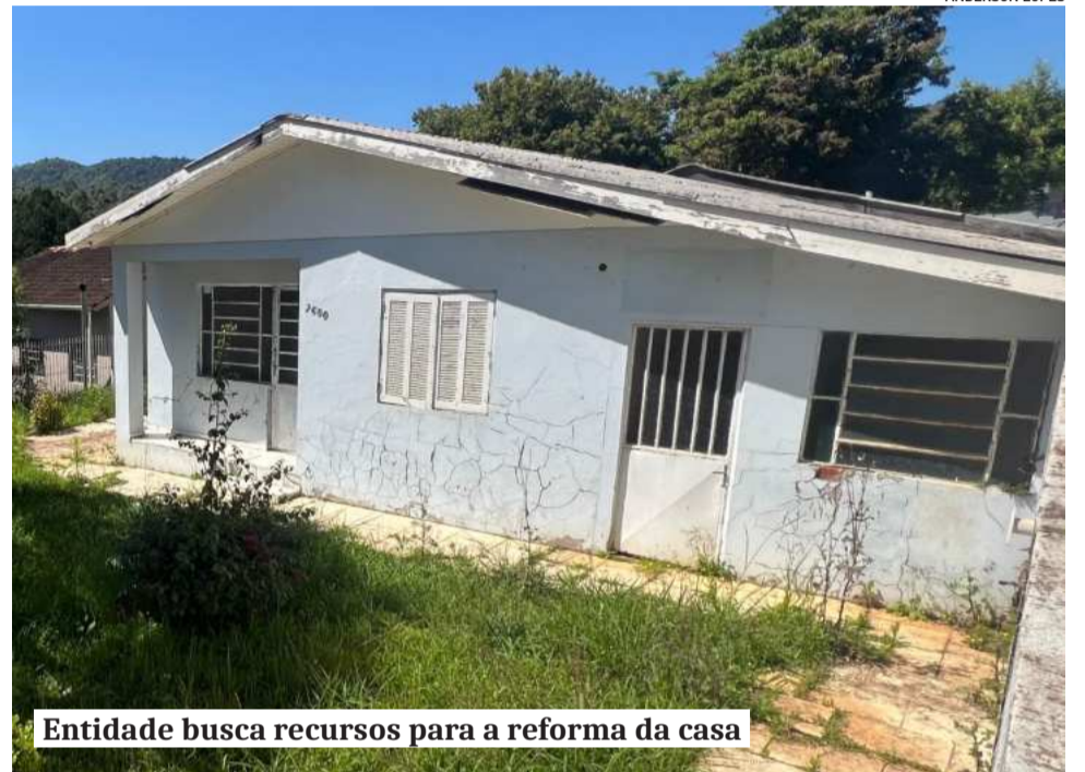
Entidade busca recursos para a reforma da casa

A Floco Azul não possui uma fonte de recursos fixa e depende de projetos solidários para se manter. Embora já tenha recebido alguns recursos, o montante é insuficiente para a reforma da sede. Por isso, a associação depende do apoio da comunidade para levar seus projetos adiante. O pix da entidade é o CNPJ 42.901.294/0001-72.