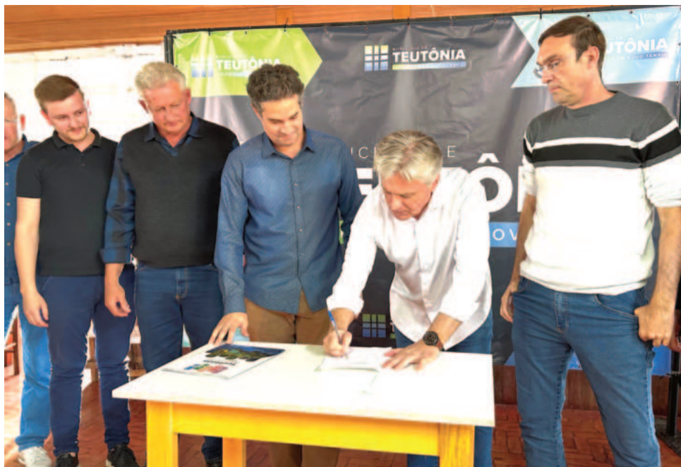
Obras serão possíveis graças a recursos municipal e federal

A gestão municipal e vereadores estiveram em peso na Sociedade para dar o anúncio e colher opiniões dos mora-