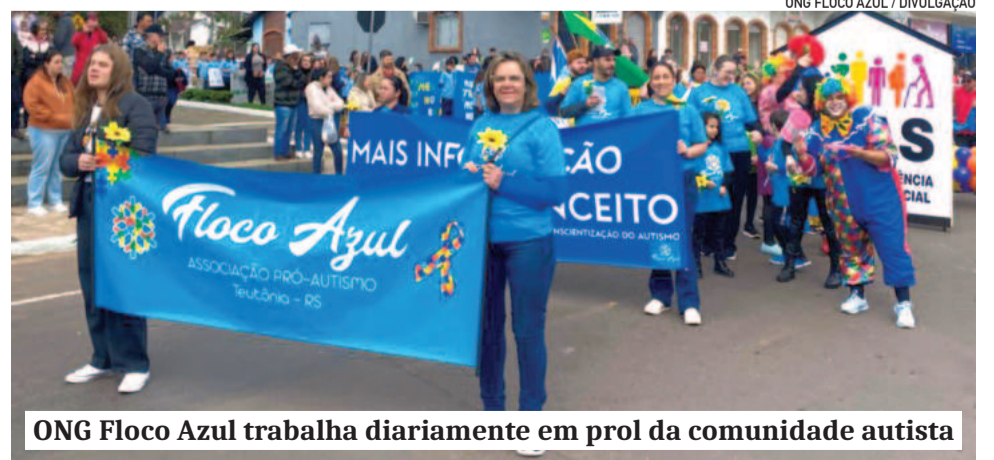
ONG Floco Azul trabalha diariamente em prol da comunidade autista

Ainda, a Floco Azul conseguiu um recurso através do Fundo Social da Scredi Ouro Branco para um projeto importante: financiar avaliações neuropsicológicas para crianças de famílias que ainda não tinham um diagnóstico formal. A avaliação ajuda a identificar com clareza se a criança tem autismo, Transtorno do Déficit de Atenção com Hiperatividade (TDAH) associado ou outro contexto.