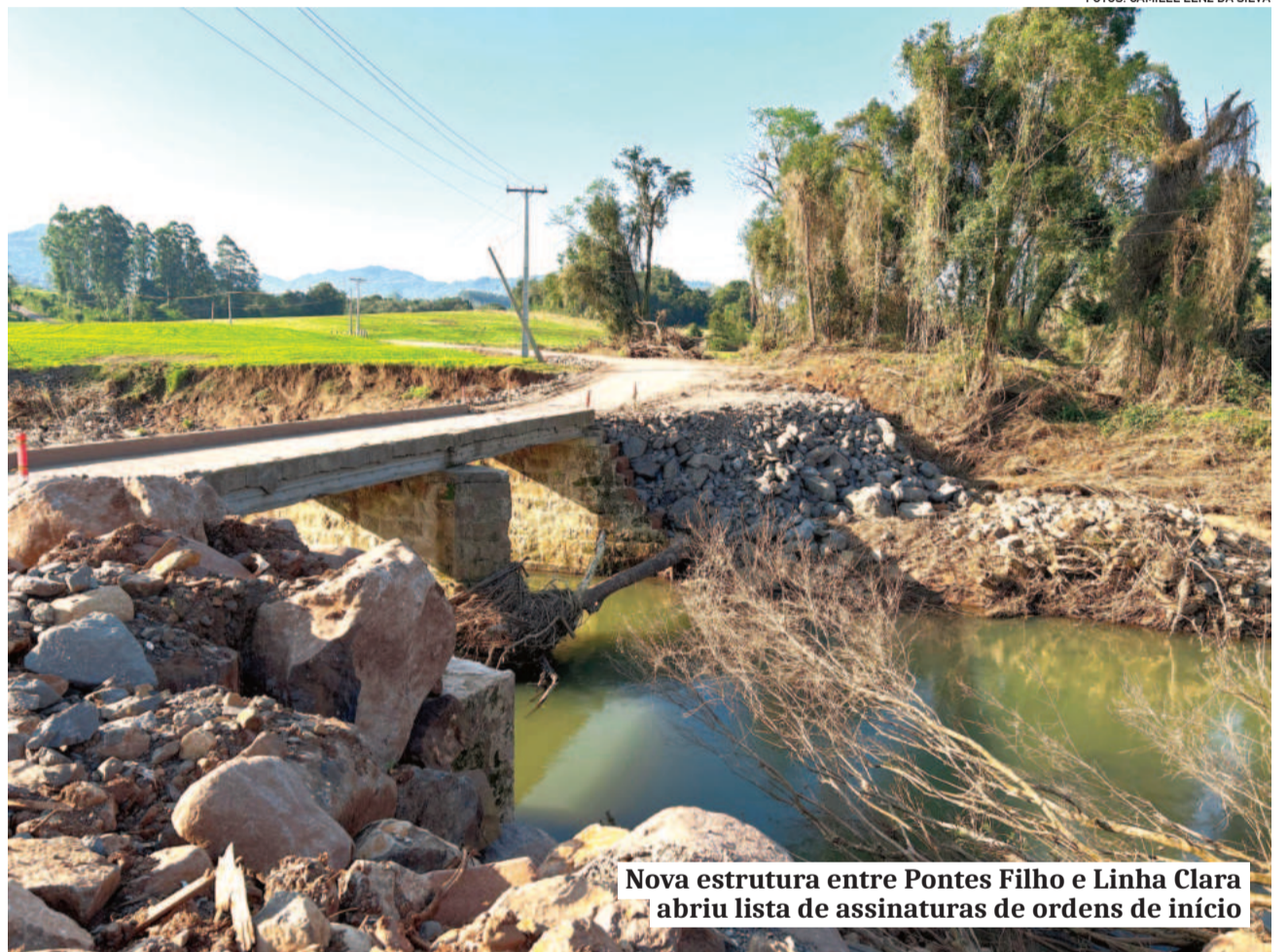
Nova estrutura entre Pontes Filho e Linha Clara abriu lista de assinaturas de ordens de início