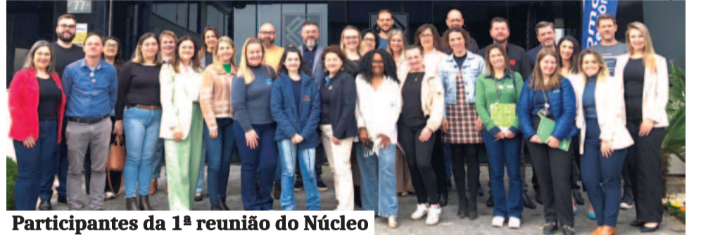
Participantes da 1ª reunião do Núcleo