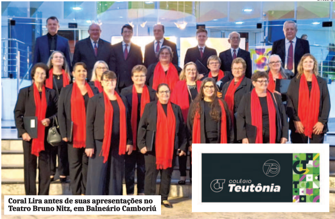
Coro Lira antes de suas apresentações no Teatro Bruno Nitz, em Balneário Camboriú