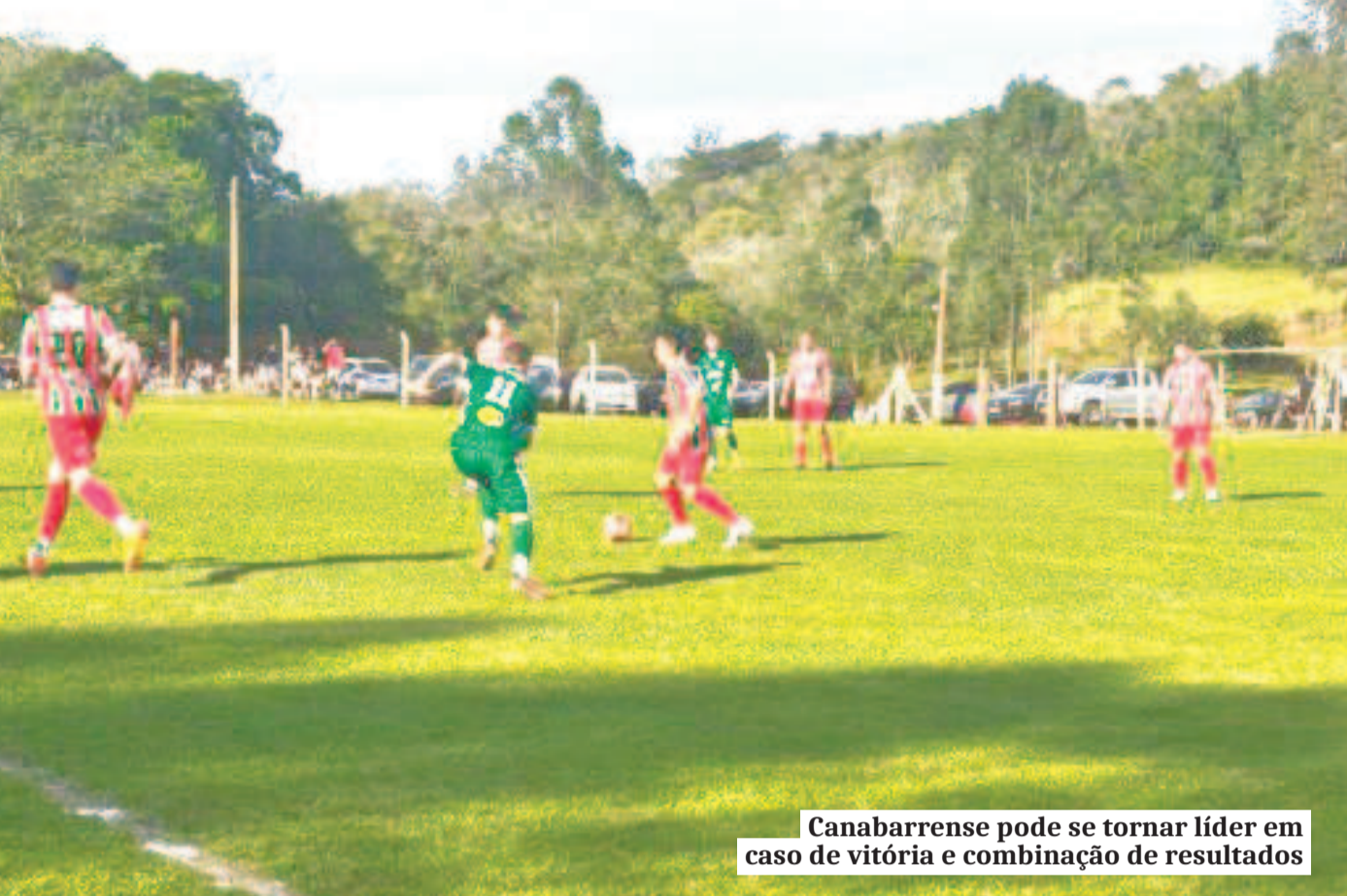
Canabarense pode se tornar líder em caso de vitória e combinação de resultados

meiros. O Rudi conquistou 4 pontos em quatro partidas e vive momento delicado. O Brasil é 4º colocado com 9 pontos e está classificado.