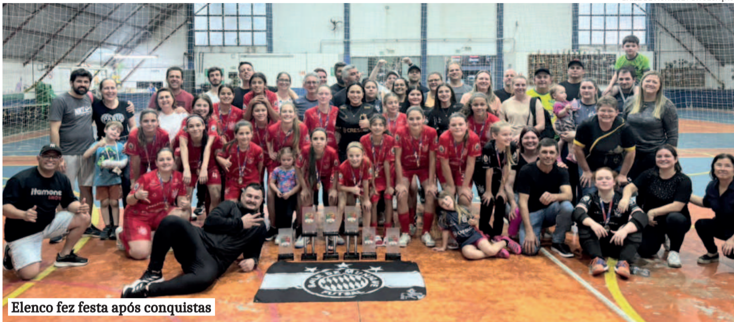
Elenco fez festa após conquistas

Categorias Sub-11, 13 e 15 foram campeãs