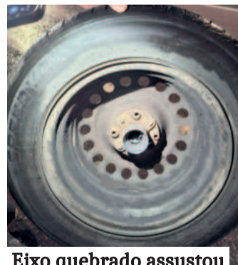
Eixo quebrado assustou na viagem de volta

Conforme Chico, um mecânico levou a van até um posto de gasolina com um guincho e o mesmo trocou o eixo. "Agora resta saber se vamos buscar ou quanto custará para trazer com o guincho desse mecânico. Foi um baita susto, escapamos de um baita acidente", afirma.