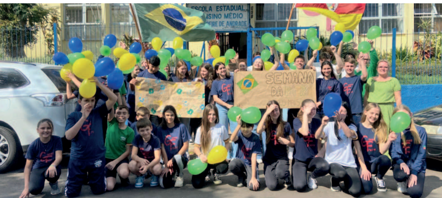
Escola Gomes Freire realizou o último desfile em Teutônia em 2017. Neste ano, as atividades são internas

Ignorar os sintomas pode levar a danos irreversíveis no nervo, comprometendo de forma permanente a sensibilidade e a força da mão. Quanto mais cedo for feito o diagnóstico, maiores são as chances de um tratamento eficaz e da prevenção de sequelas. Portanto, ao perceber os primeiros sinais, procure avaliação médica.