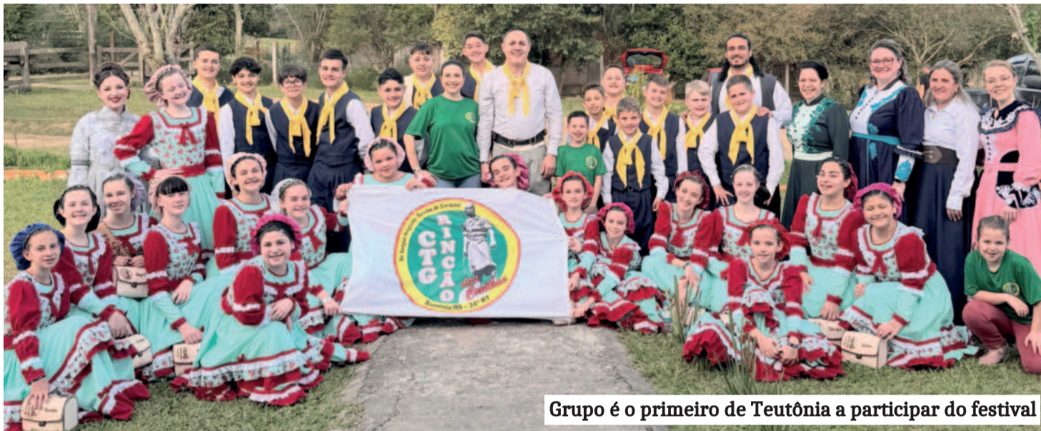
Grupo é o primeiro de Teutônia a participar do festival