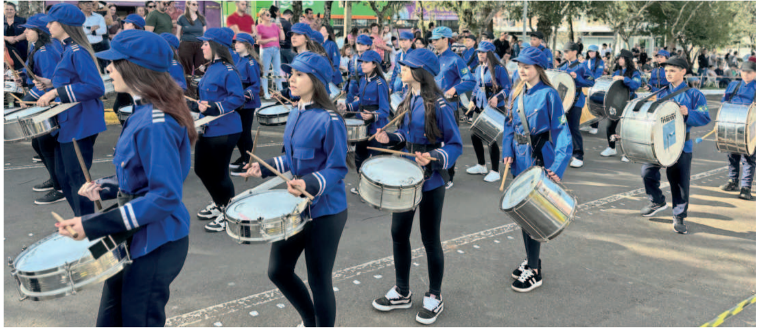
Fazenda Vilanova realizou desfile no domingo passado e abriu comemorações da Semana da Pátria