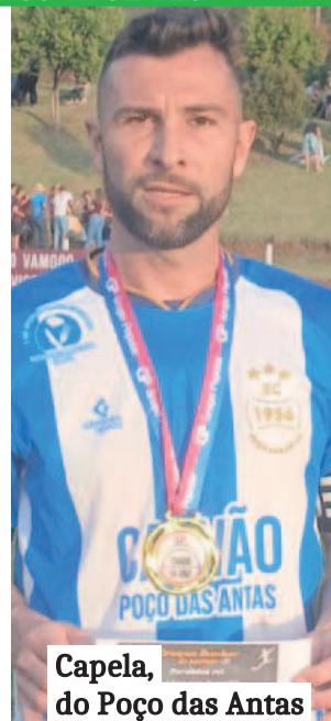
Capela, do Poço das Antas