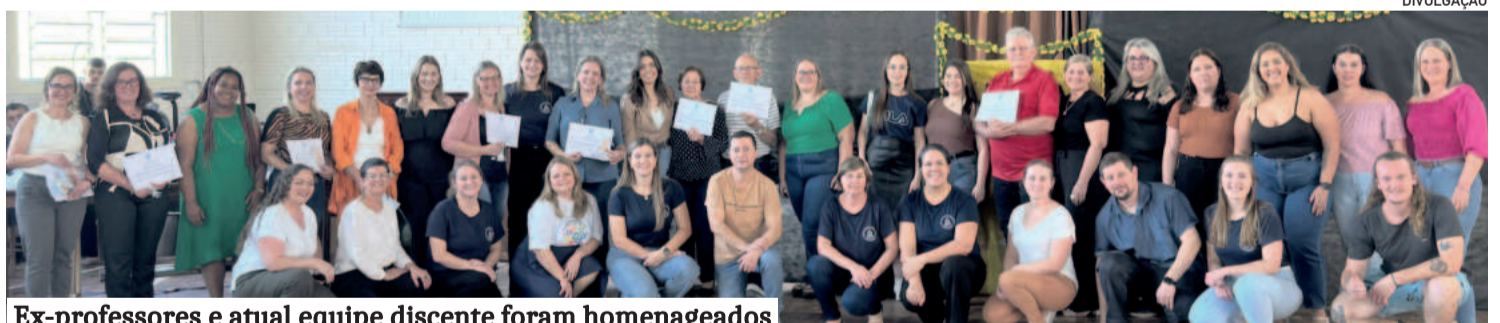
Ex-professores e atual equipe discente foram homenageados