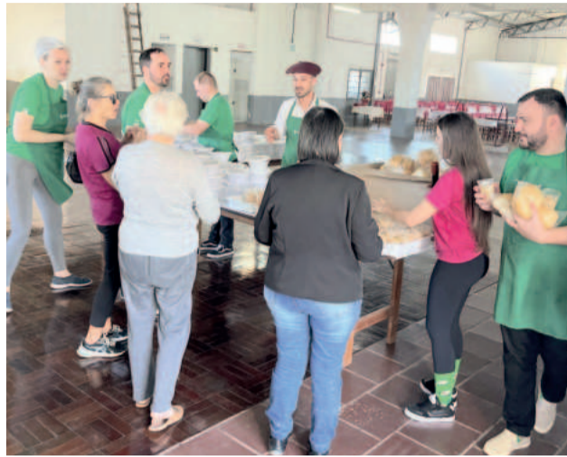
Sicredi Ouro Branco reuniu cerca de 500 voluntários em 31 agências do RS e MG

Sicredi Ouro Branco e Languiru destacaram solidariedade e espírito cooperativista