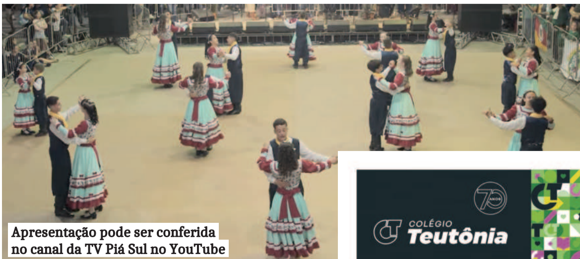
Apresentação pode ser conferida no canal da TV Piá Sul no YouTube