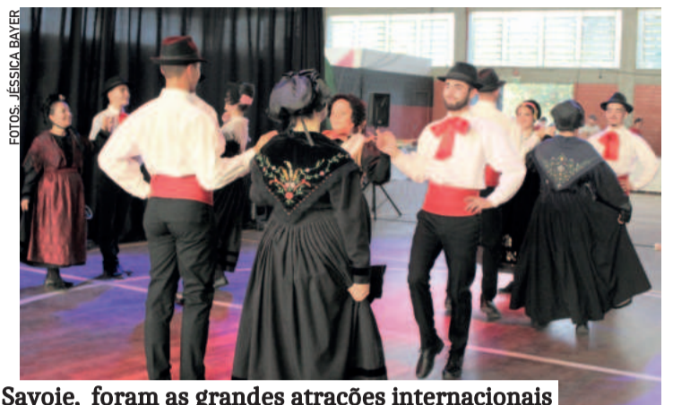
Grupos italiano Urbanitas (e) e francês, Ballet de Savoie, foram as grandes atrações internacionais

JÉSSICA BAYER Nos dias 29, 30 e 31 de agosto, Imigrante sediou o 1º Festival Internacional do Folclore, promovido pela administração municipal. O evento reuniu grupos do Brasil, Itália e França em uma celebração da diversidade cultural, que encantou o público e projetou o município no cenário internacional.