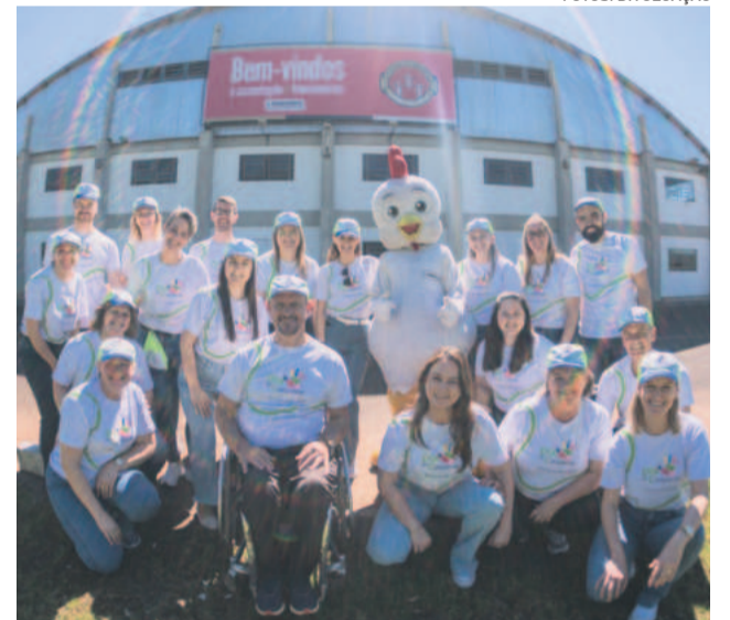
Languiru organizou evento beneficente na Associação dos Funcionários da cooperativa