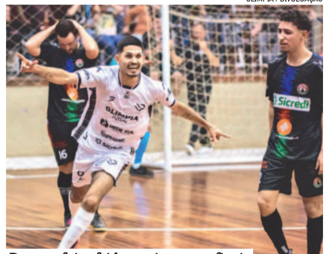
Derrota foi sofrida nos instantes finais