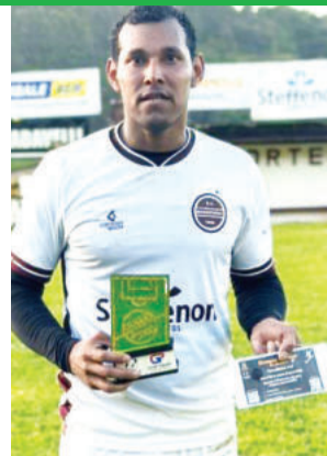
Urubu, do Boavistense