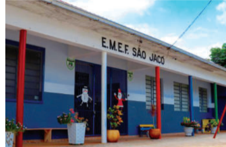
Período de matrículas inicia em novembro

Além das novas inscrições, o mesmo prazo vale para rematrículas de estudantes com menos de 75% de frequência já inseridos na rede estadual. Os demais estudantes têm rematrícula automática.