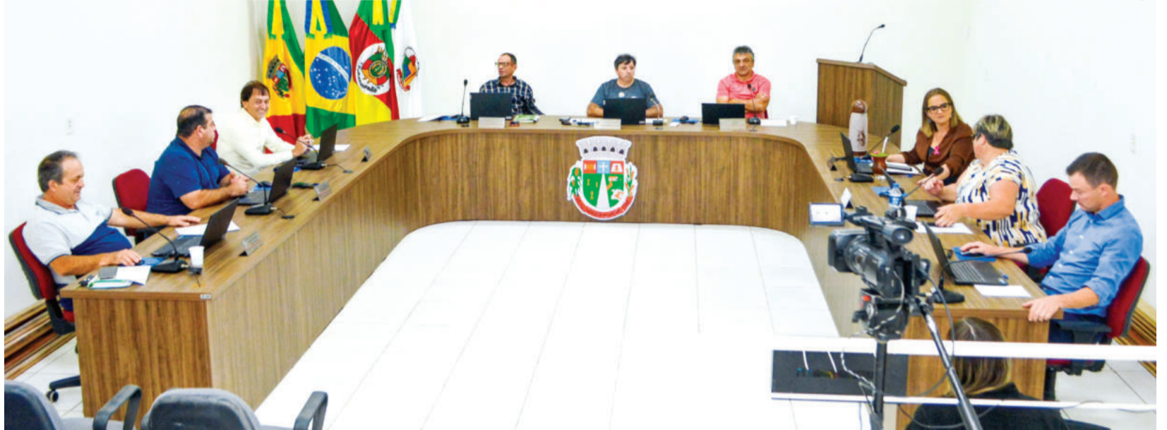
Sessão ordinária desta segunda-feira

Entre os remanejamentos estão recursos para manutenção de máquinas, estradas e ruas, recolhimento de lixo, aquisição de medicamentos, pagamento