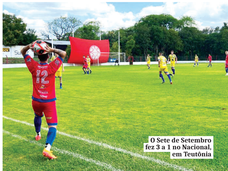
O Sete de Setembro fez 3 a 1 no Nacional, em Teutônia