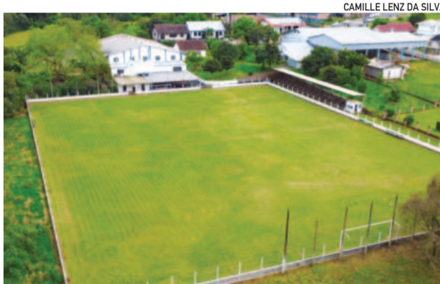
CAMILLE LENZ DA SILVA

Festividades serão realizadas na sede do clube