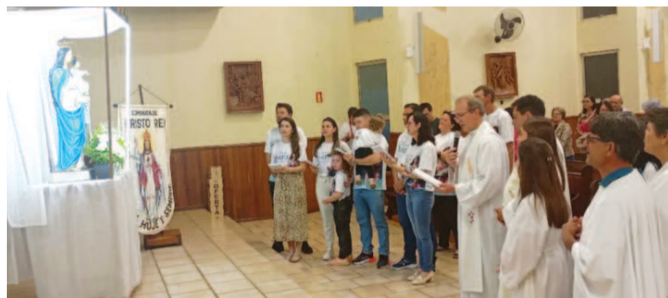
Durante nove noites que antecedem a festa, a comunidade se reúne para encontros de oração na igreja matriz

ma do povo encontrar seu próprio jeito de rezar, sendo um “mantra” de contemplação.