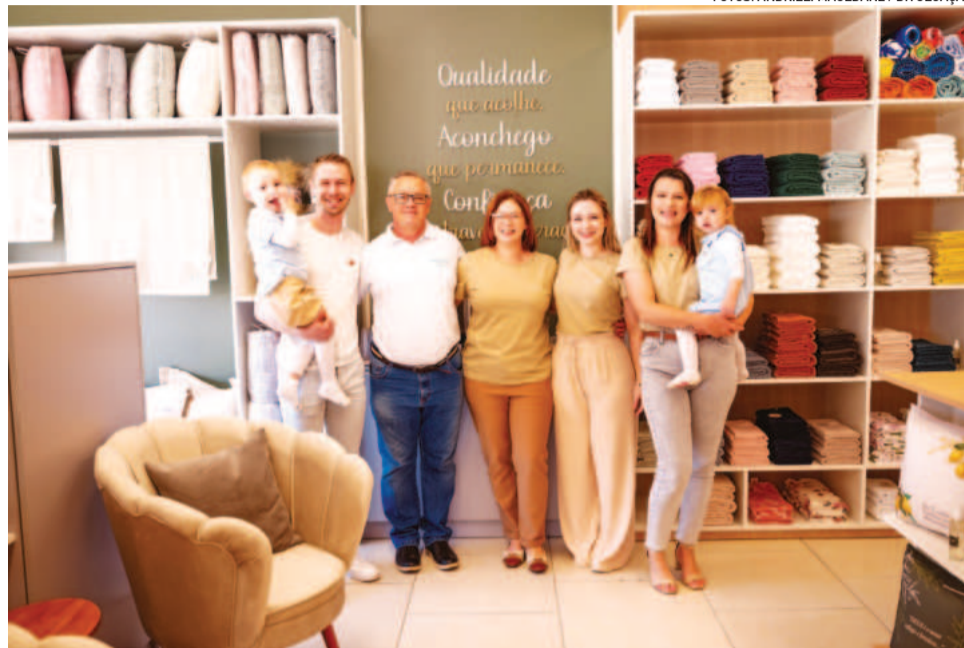
Aneli e família na inauguração do novo espaço

Com o diferencial da produção própria da maioria dos produtos disponibilizados nas lojas, a empresa está em constante melhoria, buscando entender o que os clientes precisam e desejam. A Kelmai produz uma ampla linha de produtos para casa, que inclui jogos de lençóis, edredons, travesseiros, fronhas, almofadas e linha de decoração, como cortinados e persianas. Além disso, há os pijamas, do bebê, infantil ao adulto, masculino e feminino. Na linha mesa e banho, além da produção própria, atua com marcas parceiras.