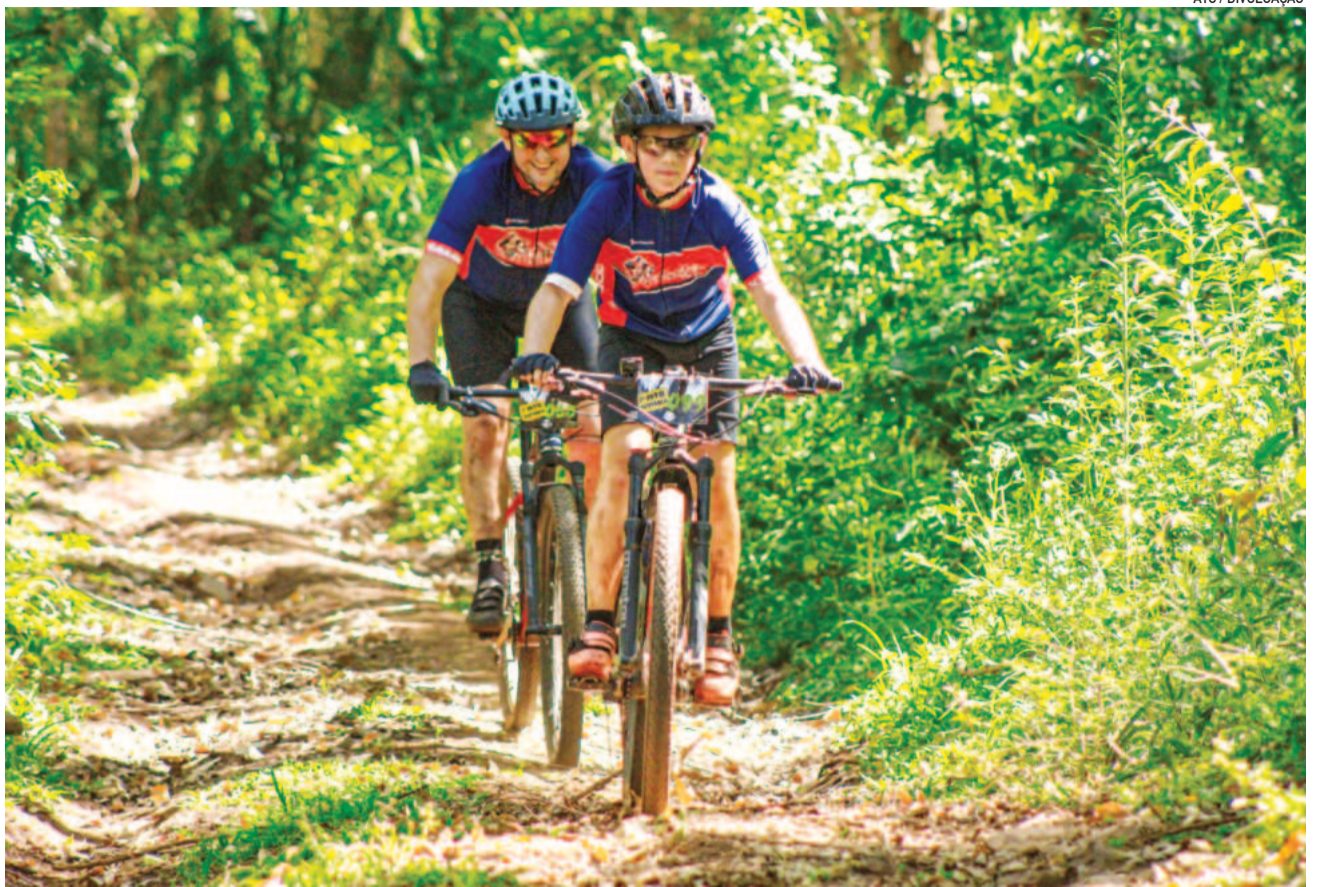
MTB oferece roteiros que valorizam as paisagens do interior de Teutônia

As inscrições devem ser feitas pelo site disponível no QR Code da matéria. O valor é de R$ 60 para o Cicloturismo e R$ 80 para o Cross Country Maratona (XCM). O pacote inclui kit atleta, café da manhã, uso de vestiários com chuveiros, lava-bike, seguro, apoio mecânico, ambulância de prontidão, medalha de