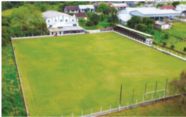
CAMILLE LENZ DA SILVA

Festividades serão realizadas na sede do clube