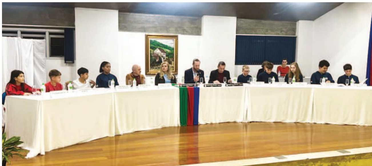
Jovens ocuparam as cadeiras junto à mesa diretora e ao prefeito de Poço das Antas

A Comunidade Católica Nossa Senhora Aparecida, de Westfália, convida para Festa em Honra à Nossa Senhora Aparecida. Será no dia 12 de outubro, na sede do Flamengo. A programação inicia com missa às 9h30, seguida de procissão com bênção dos veículos. Ao meio-dia será servido almoço. Cartões antecipados custam R$ 60 por pessoa e, na hora, R$ 70, podendo ser adquiridos no local da festa ou com os membros da comissão organizadora do evento. A animação estará por conta da Banda Sempre Alegre. Também haverá brinquedos infláveis gratuitos para as crianças.