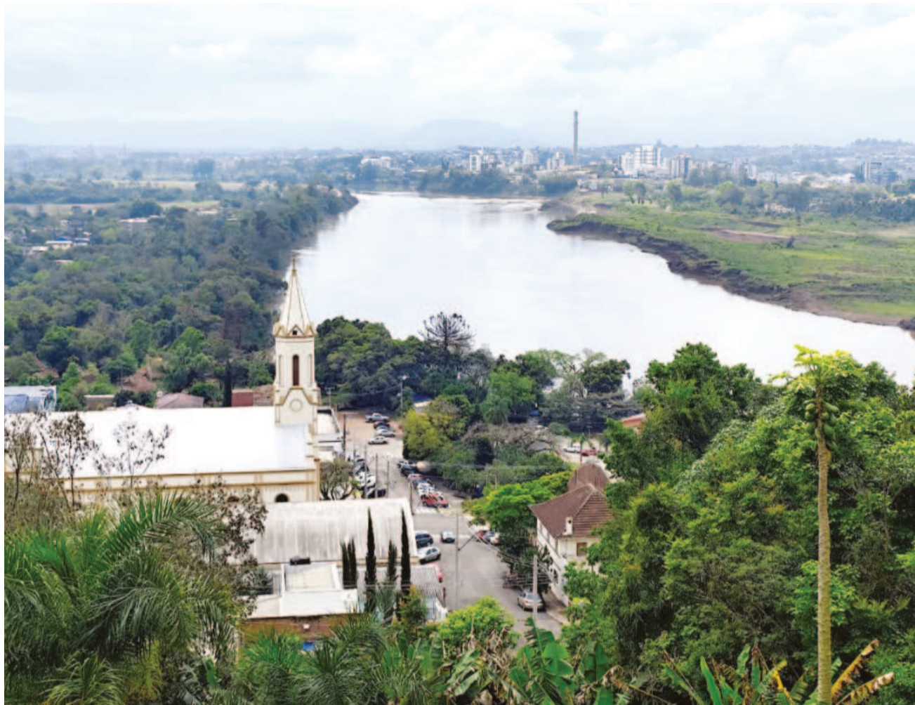
Rio Taquari separa Cruzeiro do Sul de Estrela. Hoje, travessia entre os dois municípios ocorre a partir de Lajeado, pela ponte da BR-386

Investimento de R$ 358 milhões é visto pelo setor privado como marco logístico e oportunidade de retomada após enchente de 2024