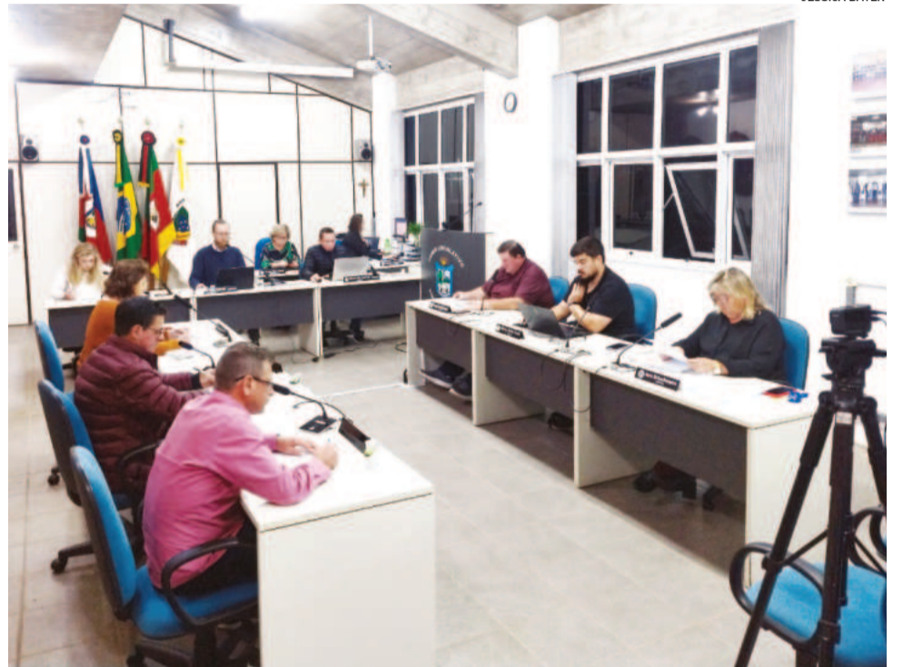
Vereadores receberam resposta sobre a LOA 2025