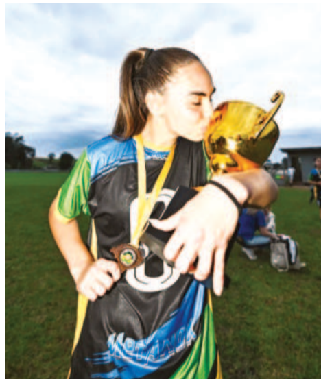
A estrelense festejou muito o título do Interior do Gauchão