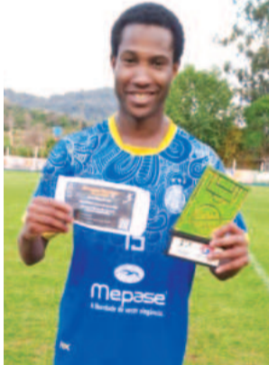
Chi, do Nacional