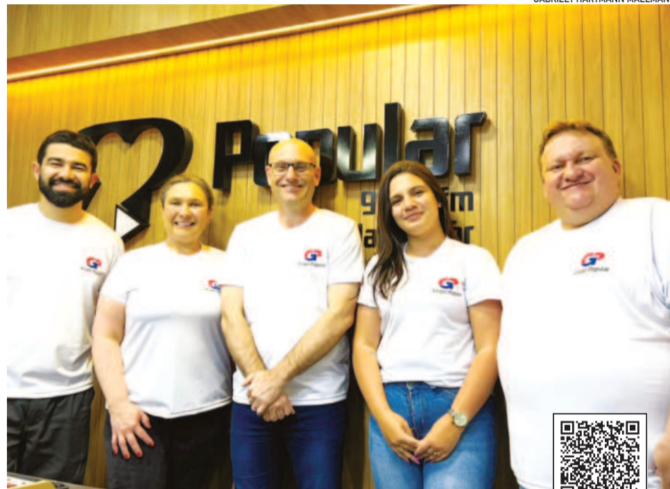
Comissão organizadora apresenta a 1ª Gincana Natal do Povo, novidade da programação natalina

A partir de 10 de novembro até 7 de dezembro, as equipes cumprirão tarefas de diferentes naturezas, como artísticas, culturais, esporti-