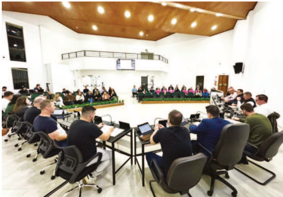
Sessão ocorre sempre às segundas-feiras

Em entrevista, o vereador manifestou gratidão pela nova oportunidade e pela confiança