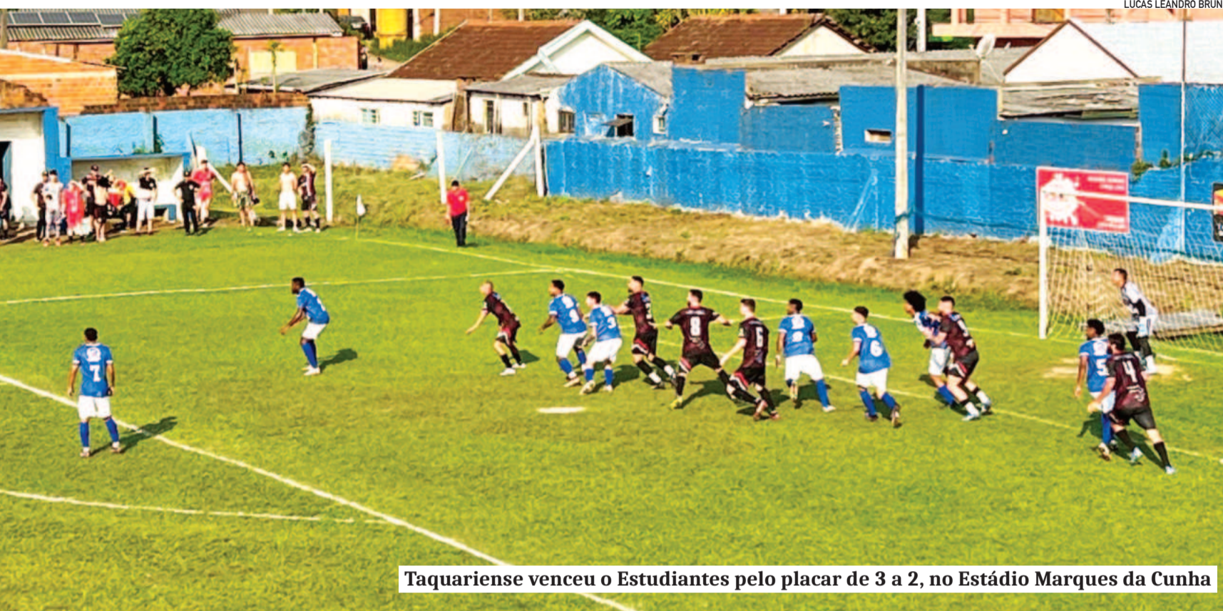
Taquariense venceu o Estudantes pelo placar de 3 a 2, no Estádio Marques da Cunha