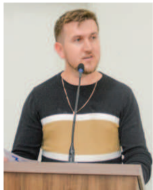
Presidente da Associação Cultural Vilanovense apresentou atrações