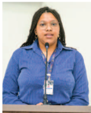
1ª princesa do município enalteceu a estrutura do evento

A festa terá atrações culturais e artísticas, exposição de orquídeas, artesanato local e praça de alimentação. No domingo também haverá exposição de carros antigos. Nos 2 dias, várias atrações musicais sobem ao palco. A programação completa pode ser conferida na página @fazenda_vilanova30anos.