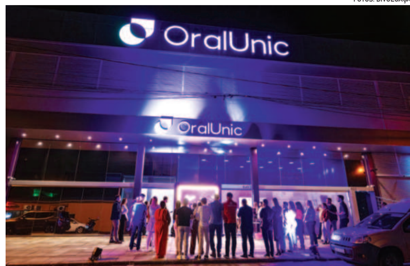
Espaço fica na Rua Guilherme Brust, no Bairro Languiru

"Fomos recebidos de uma forma muito especial. Desde o início sentimos o carinho e a curiosidade das pessoas, a torcida para que tudo desse certo. Teutônia tem esse jeito acolhedor, de cidade que abraça e faz a gente se sentir em casa. Cada gesto, cada palavra de incentivo que recebemos ao longo desse processo reforçou que escolhemos o lugar certo para viver esse novo capítulo", aponta a sócia-proprietária.