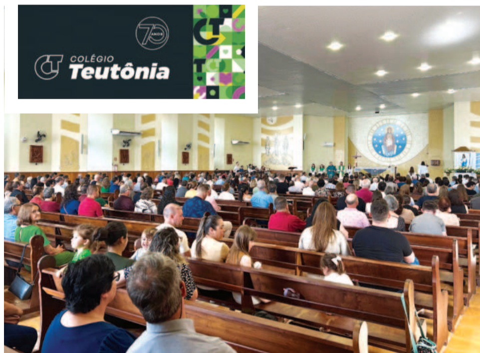
Devotos lotaram a igreja para a Missa Solene