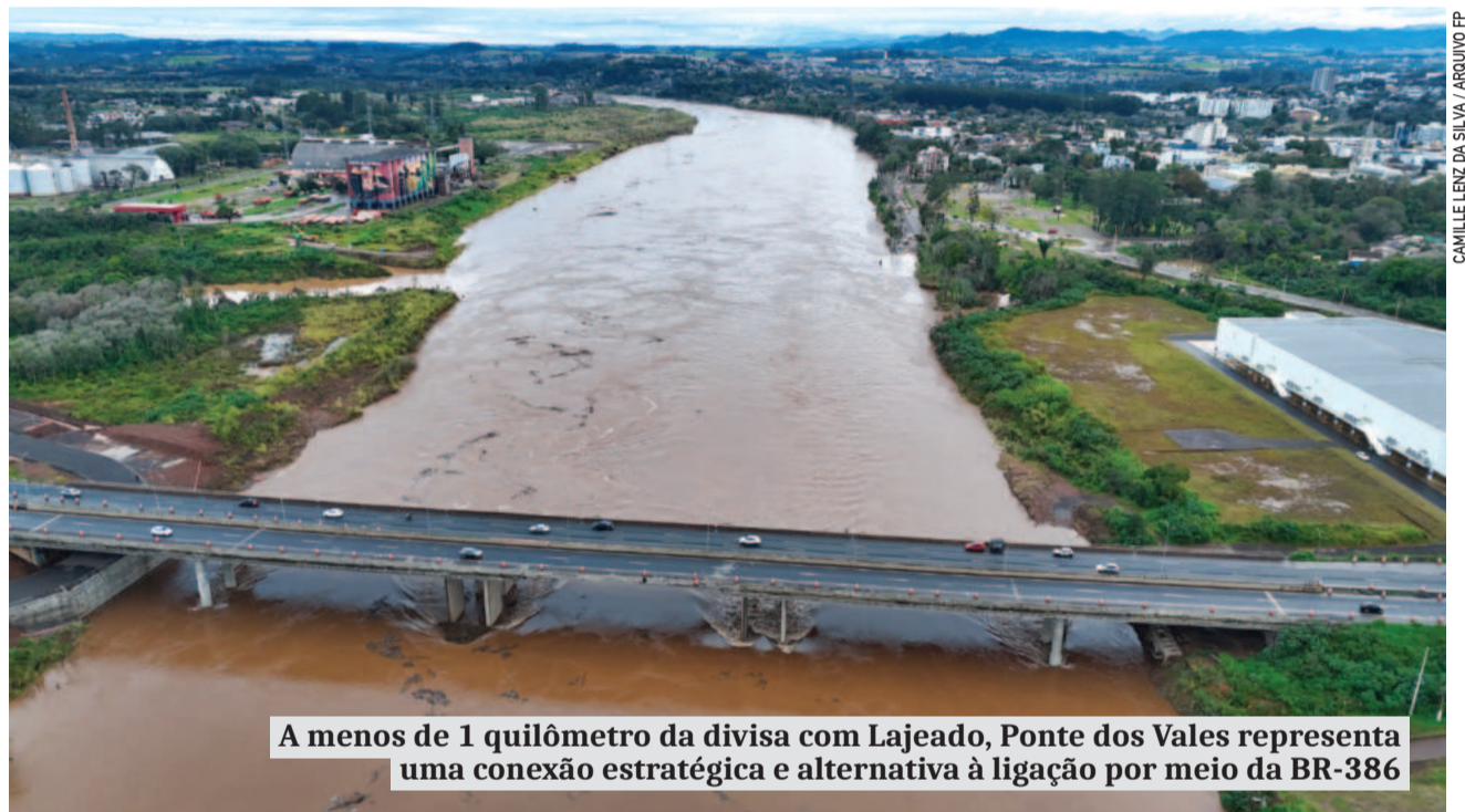
A menos de 1 quilômetro da divisa com Lajeado, Ponte dos Vales representa uma conexão estratégica e alternativa à ligação por meio da BR-386

Empresários lajeadenses destacam o potencial da nova estrutura para a construção de um novo ciclo de crescimento na região