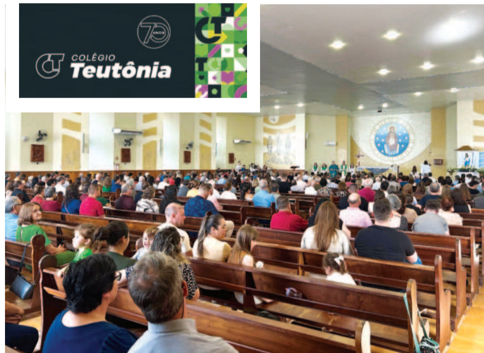
Devotos lotaram a igreja para a Missa Solene