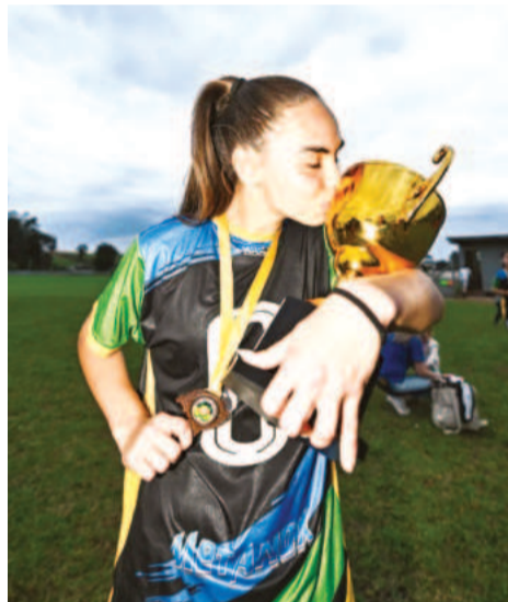
A estrelense festejou muito o título do Interior do Gauchão