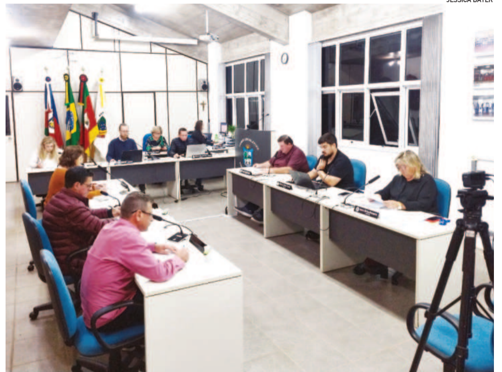
Vereadores receberam resposta sobre a LOA 2025