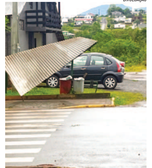
Estragos atingiram o telhado e parte da estrutura

Outro pilar do trabalho é a inclusão. Hoje, cinco crianças autistas participam integralmente das atividades. "Aqui não tem discriminação e