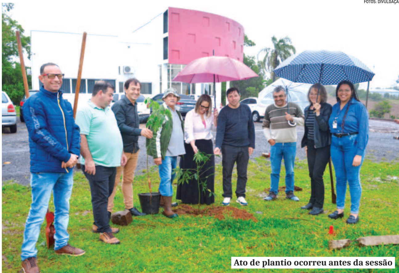
Ato de plantio ocorreu antes da sessão

Durante a sessão foram divulgadas várias ações que ocorrerão nos próximos dias. No sábado (11/10), a partir das 14h, acontecerá o Dia