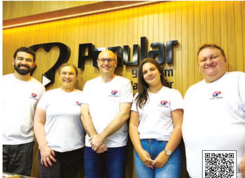
Comissão organizadora apresenta a 1ª Gincana Natal do Povo, novidade da programação natalina

A partir de 10 de novembro até 7 de dezembro, as equipes cumprirão tarefas de diferentes naturezas, como artísticas, culturais, esporti-