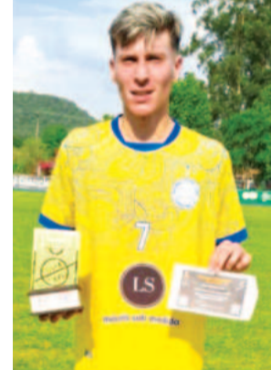
EDEMUNDO LIMA / ESPECIAL FP