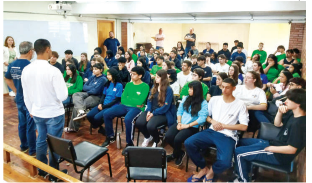
Alunos foram convidados a pensar como um portador de deficiência visual

Na primeira parte do encontro, ocorreu uma reunião com os professores e o setor pedagógico da escola, onde foram apresentadas formas de proporcionar mais acessibilidade aos alunos com deficiência visual. Foram demonstrados exemplos de materiais pedagógicos adapta-