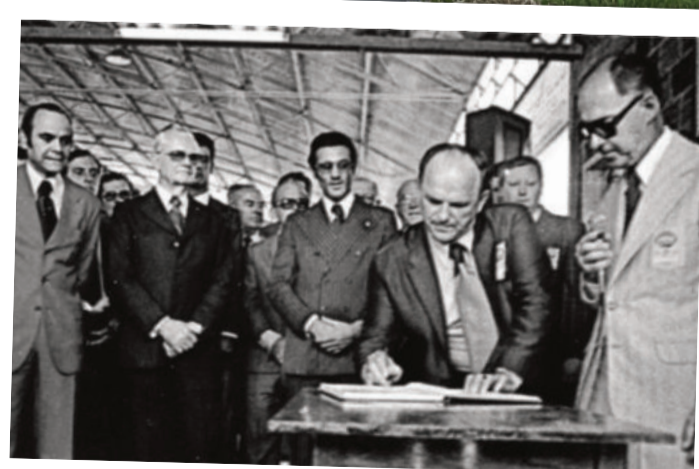
Visita do Presidente da República, Ernesto Geisel (2º da esquerda para a direita), em 13 de novembro de 1975