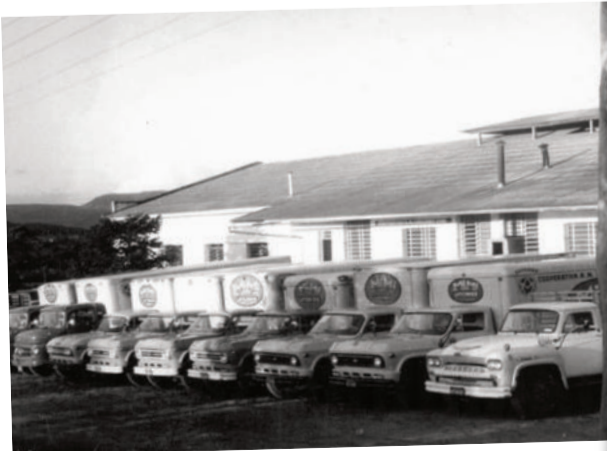
Antiga frota de veículos adesivados com a marca MiMi

A cooperativa vive uma fase de retomada, após enfrentar um dos períodos mais desafiadores de sua trajetória. Nas sete décadas de história, a Languiru foi uma das grandes responsáveis pelo desenvolvimento regional. Agora, projeta bases sólidas para continuar exercendo papel de protagonista na economia do Vale do Taquari, fortalecendo a produção local e o vínculo com seus mais de 2 mil associados.