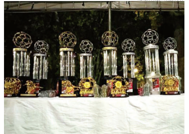
Taças estarão em jogo mais uma vez