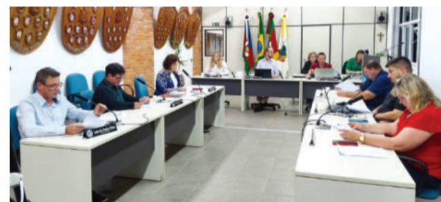
Vereadores anunciaram avanços com a Anatel para levar sinal de celular a todo o município