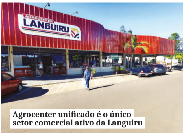
Agrocenter unificado é o único setor comercial ativo da Languiru

Conforme o gerente, ao comercializar produtos de qualidade, com preços justos e suporte técnico qualificado, contribuímos diretamente para o sucesso dos nossos associados. “Quando o produtor compra conosco, ele fortalece a própria cooperativa. É um ciclo de cooperação que gera resultados para todos”, conclui.