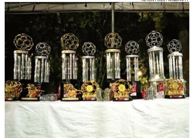
Taças estarão em jogo mais uma vez