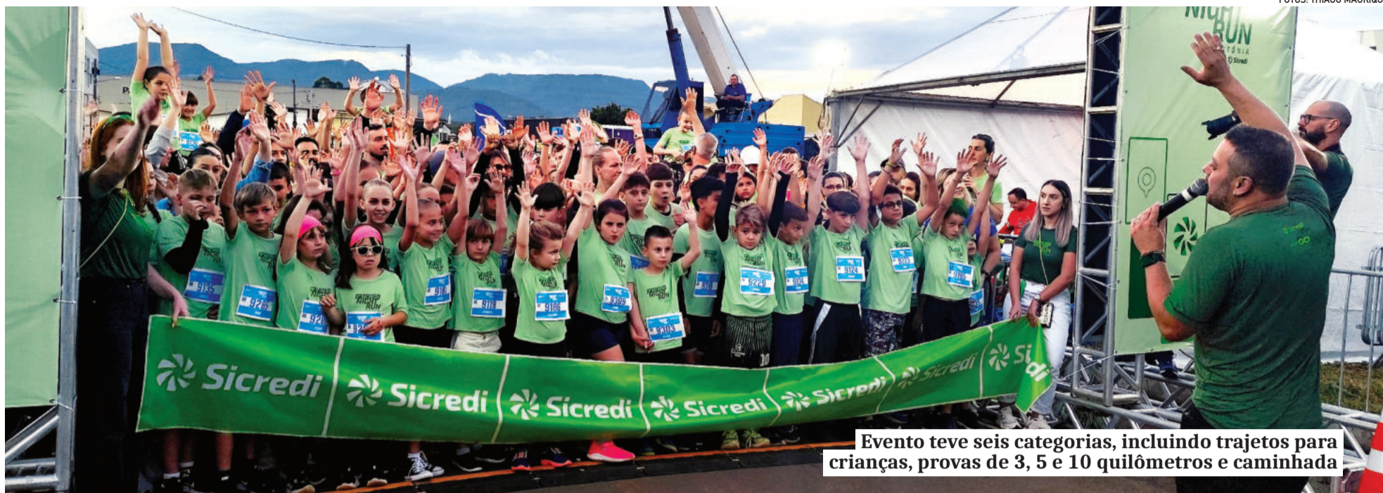
Evento teve seis categorias, incluindo trajetos para crianças, provas de 3, 5 e 10 quilômetros e caminhada