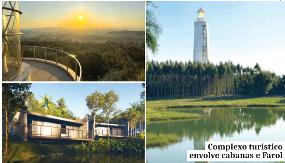
Complexo turístico envolve cabanas e Farol

O complexo hoteleiro terá quatro chalés em construção modular e média de 46 metros quadrados, praça, mirantes, espaço para feiras, trilhas, estacionamento, acesso principal e conveniência. Já o Farol terá restaurante, Praça do Fa-