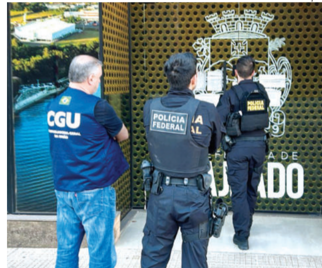
Prefeitura de Lajeado foi um dos alvos dos mandados de busca e apreensão