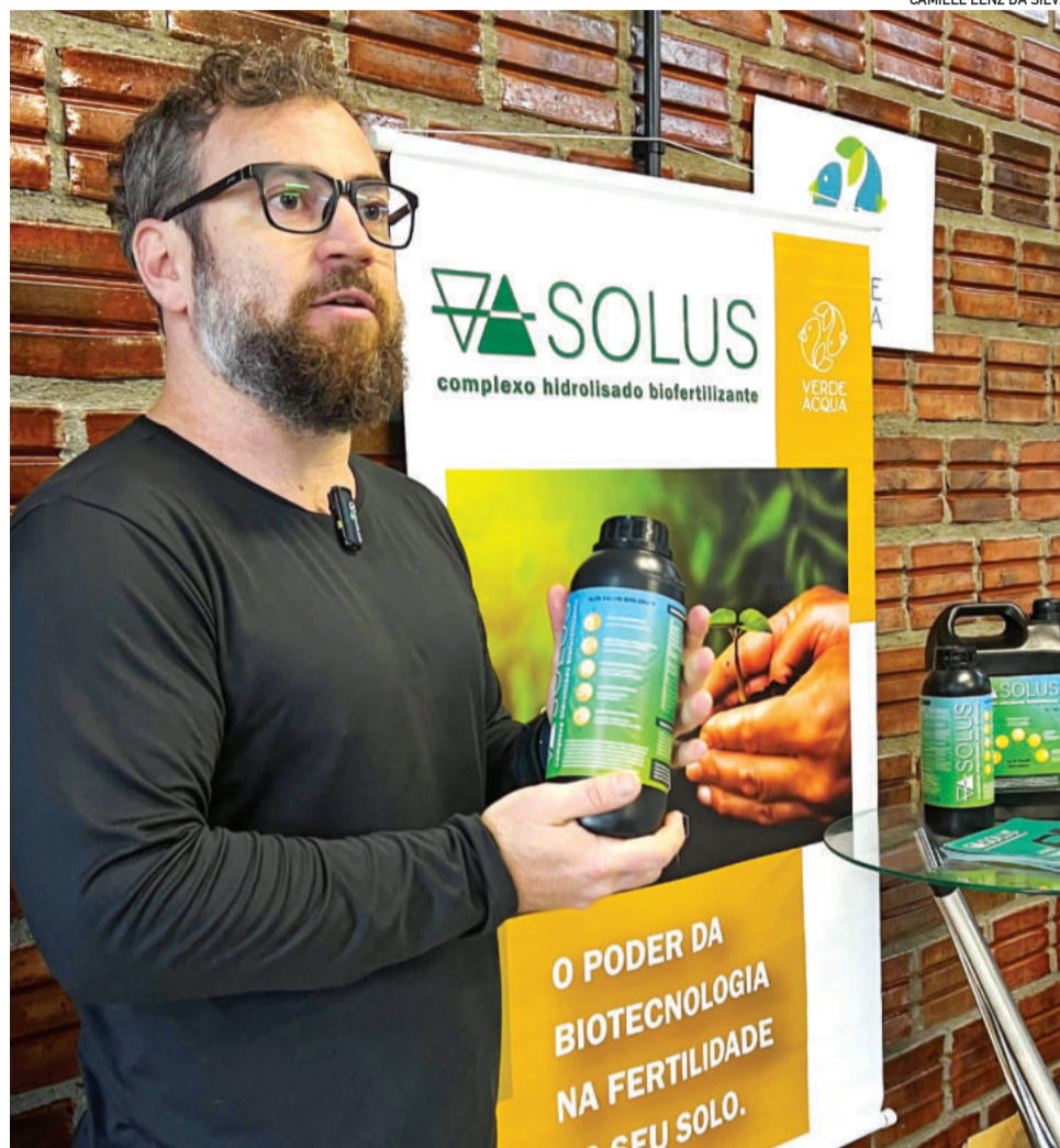
Verde Acqua produz biofertilizantes a partir das carcaças de peixes

O professor defende um pensamento integrado da logística do destino desses resíduos para superar os desafios.