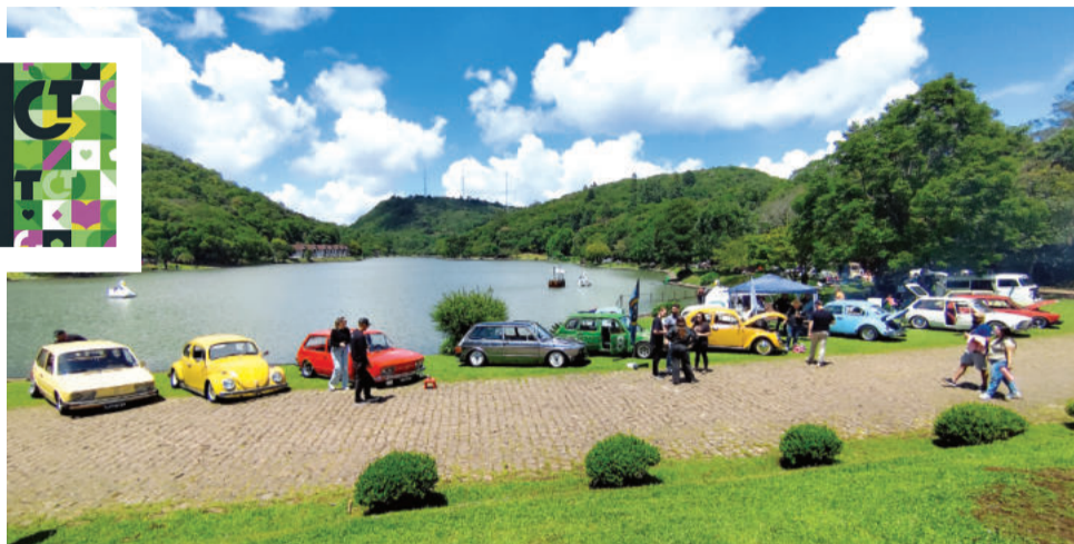
Fuscas e outros carros antigos foram exibidos às margens da lagoa