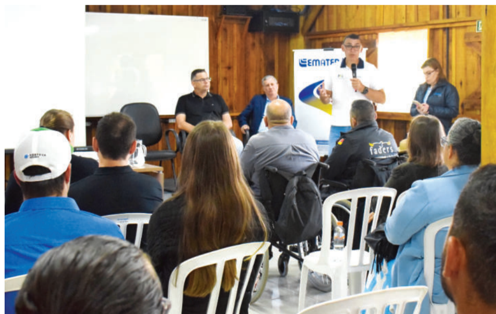
Evento teve forte presença de entidades e representantes de 64 municípios