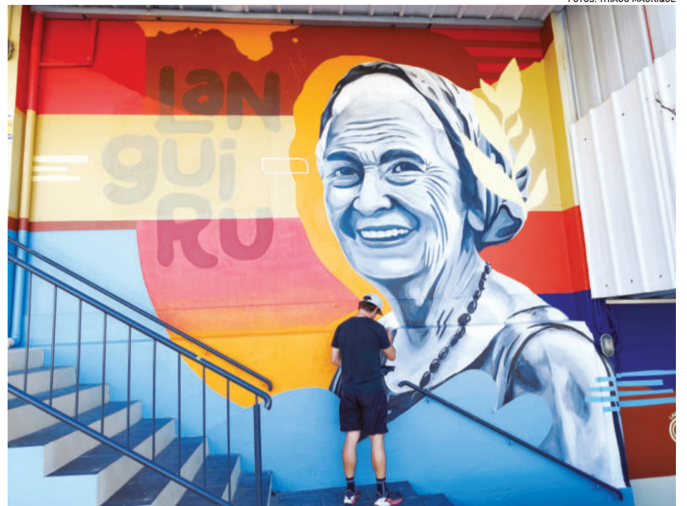
Painel representa a história dos precursores da cooperativa

Conforme o gerente, a linha de rações Languiru é considerada o principal propulsor de vendas da unidade. O bom desempenho também se estende aos insumos agrícolas, especialmente voltados às lavouras de milho, e ao setor de ferragens, com grande variedade de