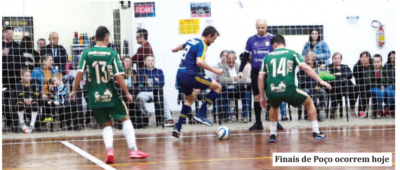
Finais de Poço ocorrem hoje

da Copa / Flamengo fez 6 a 2 no Fluminense e o Juventude A fez 10 a 5 no Flamengo B, pela Força Livre.