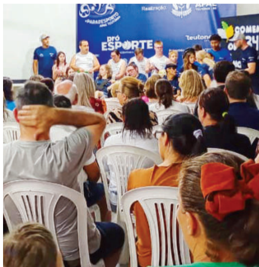
Pais, apoiadores e membros da Apae participaram da comemoração