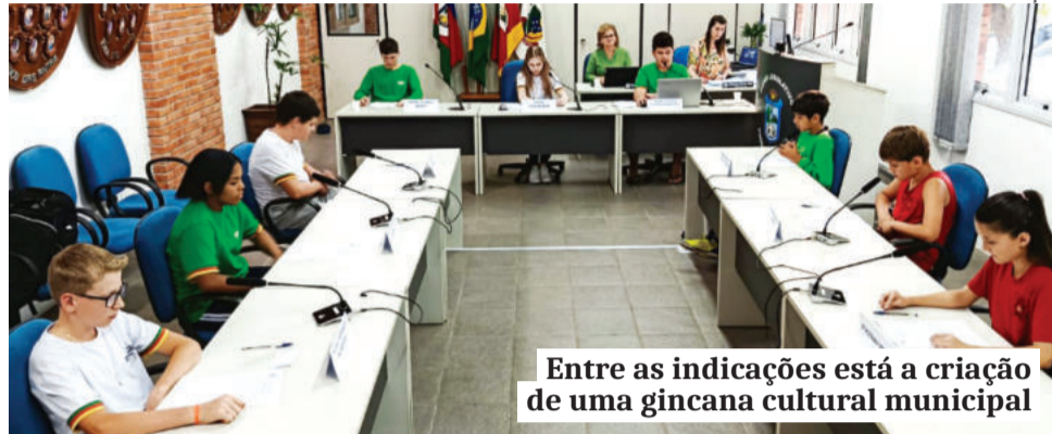
Entre as indicações está a criação de uma gincana cultural municipal

ção nº 011/2025, propondo que o município viabilize transporte e acesso de estudantes a feiras temáticas em outras cidades e estados, abrangendo áreas como profissões, ciência, tecnologia, inovação e intercâmbio.