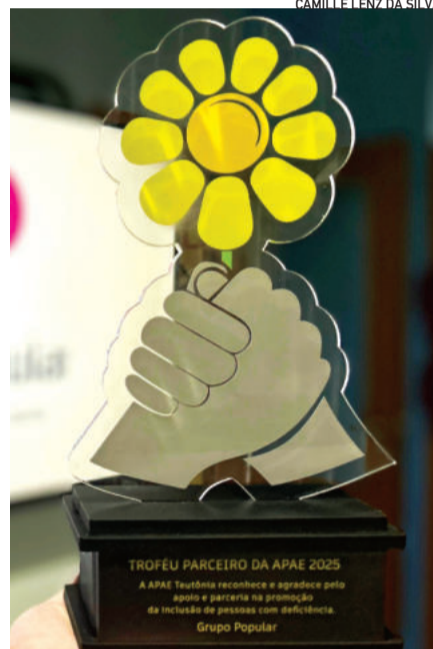
Grupo Popular foi uma das empresas homenageadas