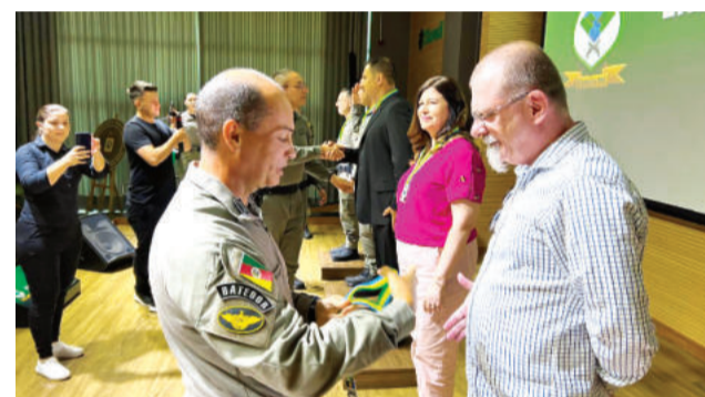
Gerhardt (d) foi o homenageado de Teutônia

é uma obrigação de todos, indicando o papel ativo da iniciativa privada no apoio às forças de segurança, como a Brigada Militar e a Polícia Civil”, cita.