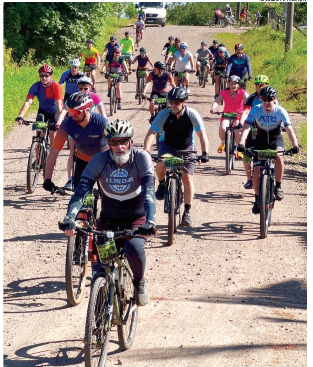
Evento faz parte das comemorações do aniversário de emancipação do município