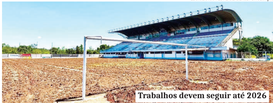
Trabalhos devem seguir até 2026