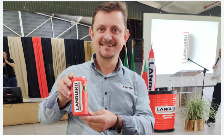
A edição é limitada e será vendida exclusivamente nos eventos da Associação dos Funcionários da cooperativa

A edição é limitada e será vendida exclusivamente nos eventos da Associação dos Funcionários da cooperativa. Foram produzidas 5 mil latas em parceria com cervejaria de Santa Catarina. Segundo Birck, a proposta é oferecer um item simbólico da celebração.