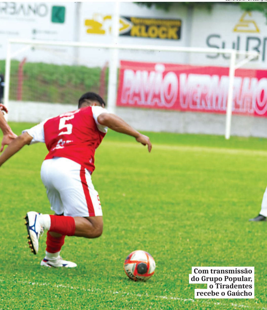
Com transmissão do Grupo Popular, o Tiradentes recebe o Gaúcho