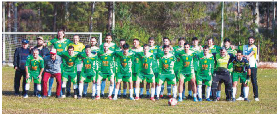
Nomes de Paverama participaram do Bola na Trave