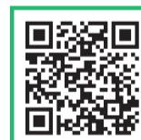
REPERCUSSÃO NO TERCEIRO TEMPO