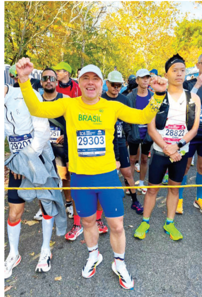
Teuto-niense representou o Brasil com a camisa

"Fui com a mentalidade de aproveitar a viagem e a prova, mas consegui entregar mais do que imaginava. A maratona não tem zebra: tu treina, executa e o resultado vem", aponta.