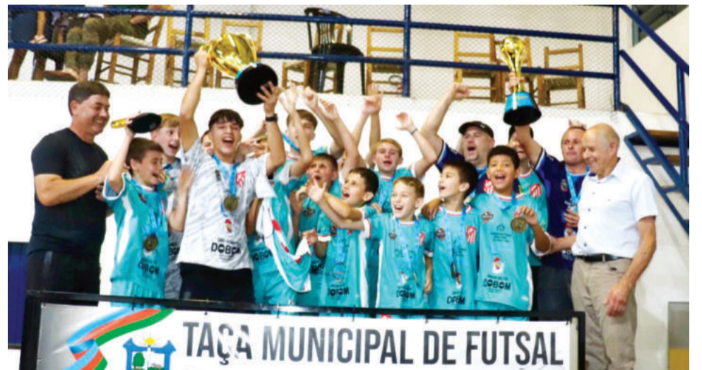
Athletic conquistou a Sub-15 Masc