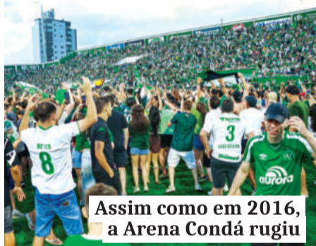
Assim como em 2016, a Arena Condá rugiu