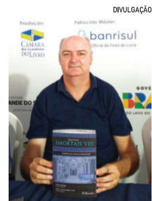
Poeta recebe leitores para conversas e autógrafos

Ele definiu o momento como profundamente emocionante. "Autografar para os leitores e trocar ideias com os colegas escritores. Estar pre-