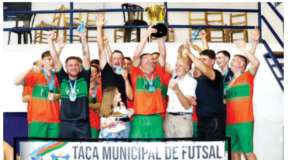
Holland venceu na Força Livre