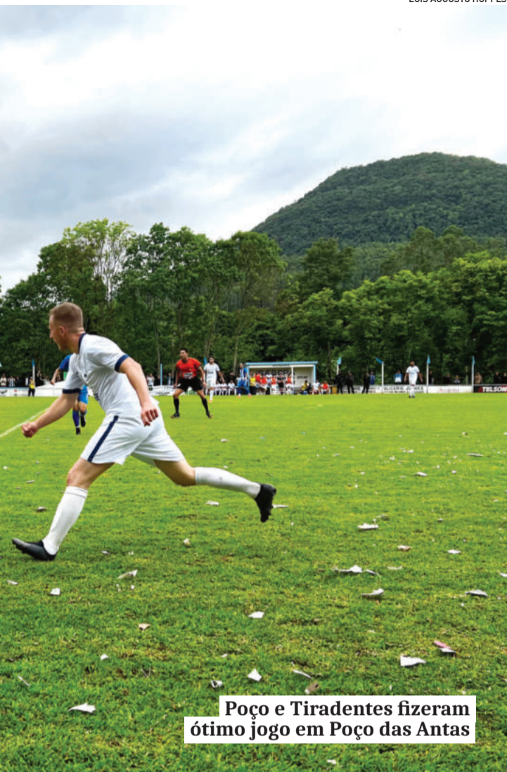
Poço e Tiradentes fizeram ótimo jogo em Poço das Antas

dos. Apenas um time levou vantagem, enquanto o outro jogo ficou no empate.