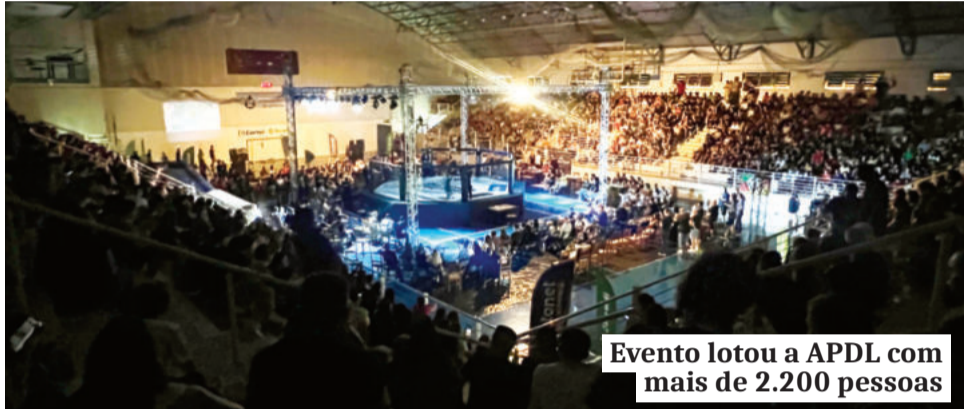
Evento lotou a APDL com mais de 2.200 pessoas