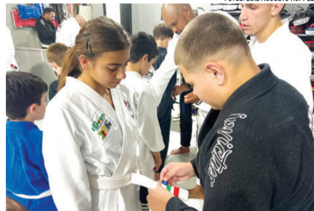
A troca de faixa é a recompensa pela dedicação

O clima entre as famílias foi de orgulho. Muitos acompanharam de perto cada passo das crianças e destacam o impacto positivo do esporte na rotina dos filhos, especialmente na autoestima, socialização e no foco.