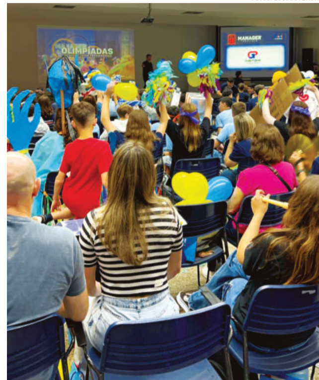
Torcidas apoiaram os jovens empreendedores

A jovem idealizou o Programa Educacional de Primeiros Socorros