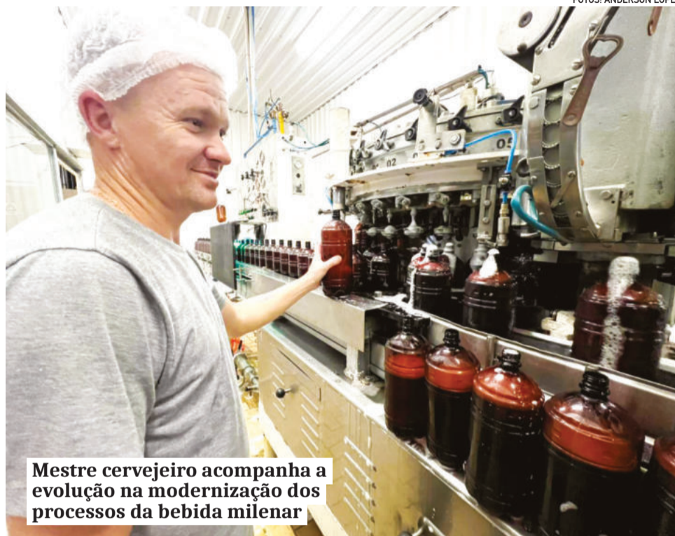
Mestre cervejeiro acompanha a evolução na modernização dos processos da bebida milenar

Dois movimentos estratégicos foram cruciais para a expansão da marca. O primeiro colocou a Prost na dianteira do setor no Brasil. “Fomos a primeira cervejaria a envazar a cer-