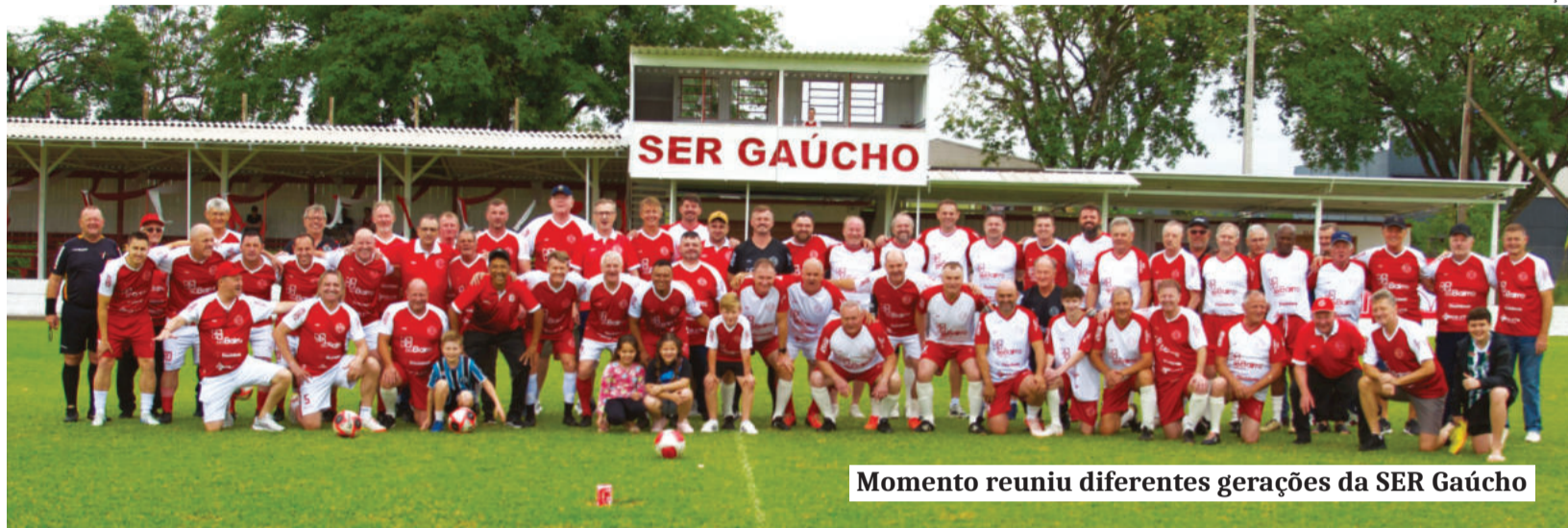
Momento reuniu diferentes gerações da SER Gaúcho