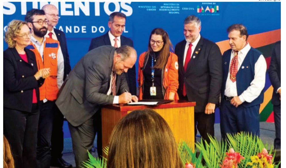
Prefeito participou de evento realizado em Brasília na quarta-feira

No primeiro momento, o objetivo para o local era a construção de um muro de gabião. Po-