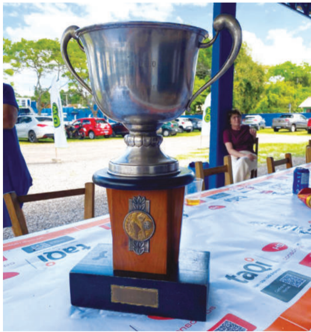
Taça que foi levantada em 1975

se segue com papel relevante na comunidade. Hoje, o destaque está nas disputas do Regional Aslivata e, principalmente, no trabalho social realizado pelas escolinhas, que atendem