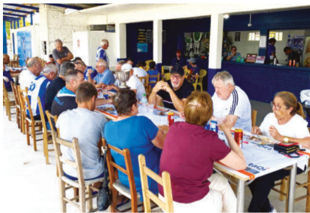
Nomes históricos participaram do almoço

Um dos clubes mais tradicionais de Taquari e referência ao lado do Pinheiros, o Taquariense