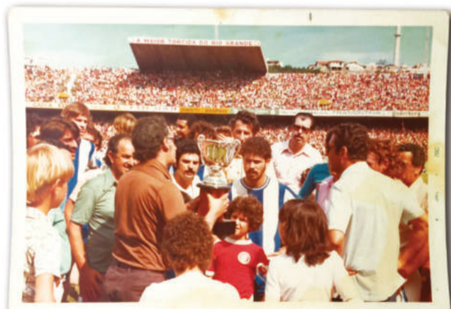
Elenco recebeu a taça após o jogo