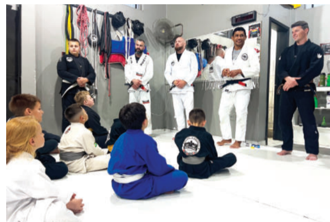
Vários critérios definem o grau do aluno

A noite destinada aos jovens lutadores foi coroada com um entoante grito de guerra, muitos aplausos, fotos e a celebração de pequenas "listras coloridas", que carregam e representam grandes avanços no desenvolvimento da arte marcial e das crianças.