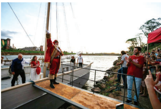
Em Lajeado, pela primeira vez o Papai Noel chegou pelas águas do Rio Taquari