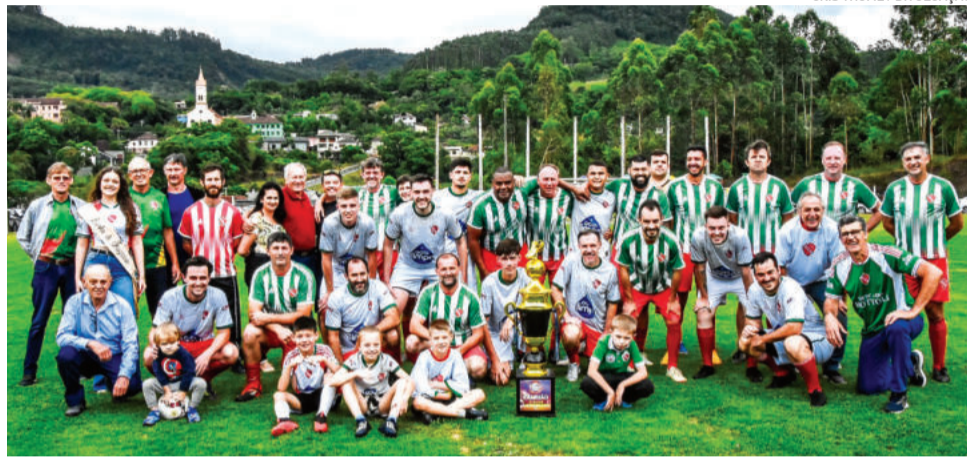
Edição uniu diferentes gerações do bairro

A programação começou logo pela manhã, com uma atividade