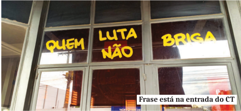
Frase está na entrada do CT

Durante a cerimônia de graduação dos jovens atletas de Jiu-Jitsu do CT Mão de Pedra, as palavras disciplina, respeito, frequência e atenção foram repetidas por diversas vezes. Essas quatro indicações formam as cores da graduação própria do CT. Portanto, os alunos são avaliados em todos estes sentidos a cada treinamento, e os que cumprirem os requisitos recebem uma cor a mais e avançam no grau / faixa. O intuito da faixa colorida é aplicar um comportamento que deve ser seguido pelos alunos, tanto dentro como fora do CT.