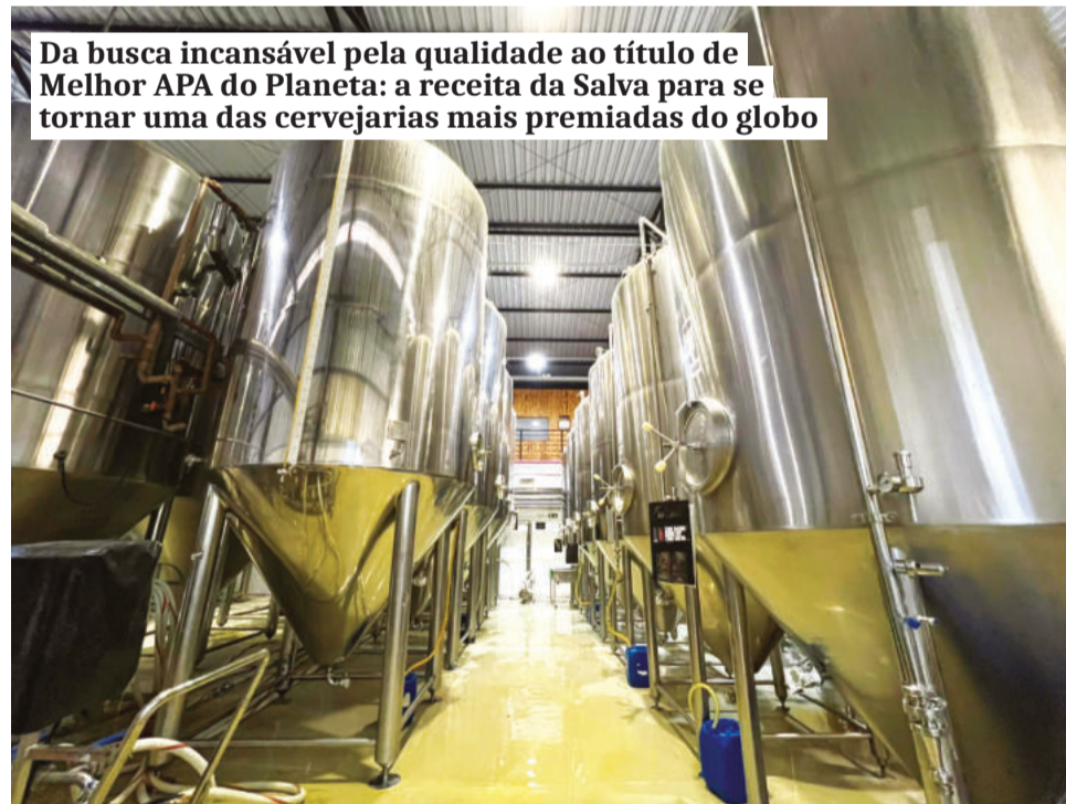
Da busca incansável pela qualidade ao título de Melhor APA do Planeta: a receita da Salva para se tornar uma das cervejarias mais premiadas do globo

tinha mais nada para tomar e eu não bebia cerveja até então”, conta.