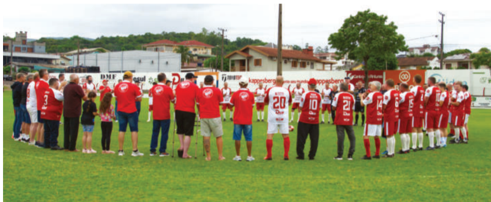
Festejos foram no sábado passado

A programação começou pela manhã, com jogos festivos que reuniram atletas históricos do tricampeão regional da Aslivata. O encontro em campo reforçou o caráter afetivo do clube, marcado por vínculos de longa data entre jogadores e comunidade. Ao meio-dia, o almoço de confraternização serviu como ponto de encontro entre gerações e abriu espaço para homenagens a pessoas, entidades e famílias que contribuí-