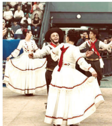
Evento é um dos mais tradicionais do Rio Grande do Sul

Teutônia até Marau para ensaiar no CTG Felipe Portinho - um trecho que, se somado ida e volta, passa facilmente dos 200 quilômetros.