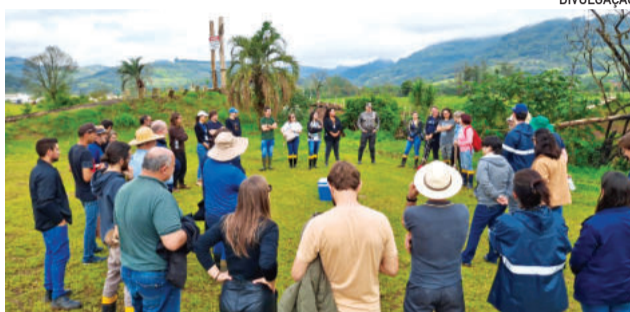
Plano Recupera Rural RS realizou mais uma etapa do diagnóstico das estradas rurais

A região carrega as marcas dos eventos climáticos extremos de 2023 e 2024, que causaram perdas significativas na cobertura vegetal, no solo e na infraes-