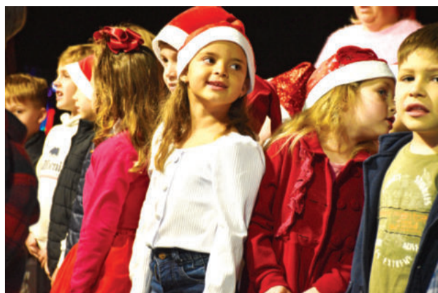
Crianças já visitaram o Papai Noel em Imigrante