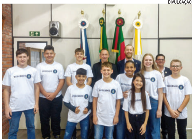
Integrantes da Câmara Mirim acompanharam agenda de visitas na Assembleia Legislativa e no Palácio Piratini