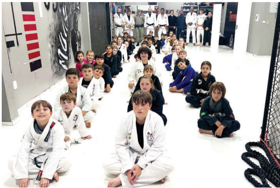
Cerca de 50 alunos estiveram presentes

Nem o calor impediu que o CT ficasse movimentado desde o início. Familiares e responsáveis lotaram o espaço para acompanhar de perto a evolução das crianças, que subiram ao tatame para receber as sonhadas recompensas após progredirem. Desta vez, a garotada não precisou passar pelas provas, pois já foram avaliados nos treinos.