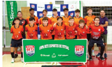
Laranja Mecânica - Sub-15

Para encerrar a noite, os Meninos da Vila tomaram a iniciativa do jogo, impuseram ritmo e não deram brechas à Fornecedorária / Clínica Carina Pasch. O placar de 4 a 1 refletiu a superioridade da equipe, que fechou a noite com o terceiro título em disputa.