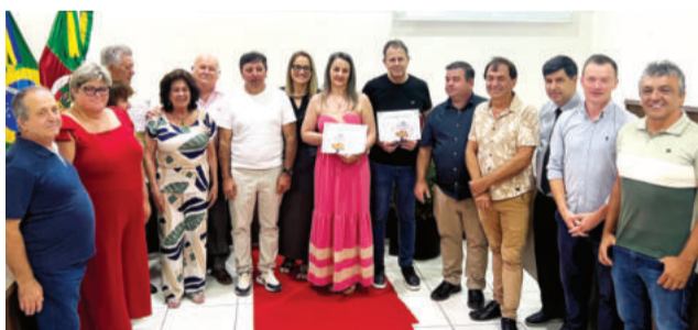
Vereadores com os quatro primeiros homenageados do Troféu Paineiras