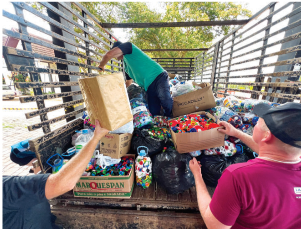
422 quilos de resíduos arrecadados foram revertidos para a Liga de Combate ao Câncer