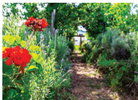
A conexão com a natureza é uma terapia que acaba esquecida