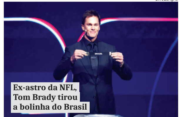
Ex-astro da NFL, Tom Brady tirou a bolinha do Brasil