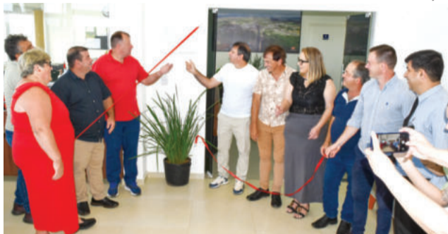
Descerramento da placa na inauguração da ampliação do prédio da Câmara