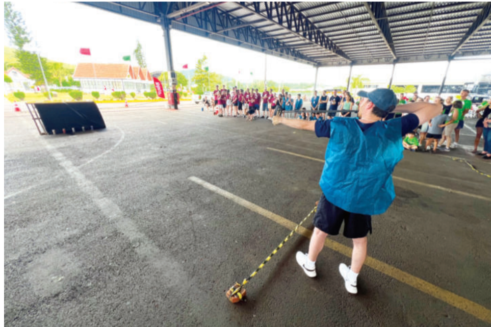
Atividades divertidas foram levadas a sério, com foco na solidariedade

Para ele, a avaliação é positiva, porque os objetivos de entregar centenas de quilos de alimentos para crianças e famílias em situação vulnerá-