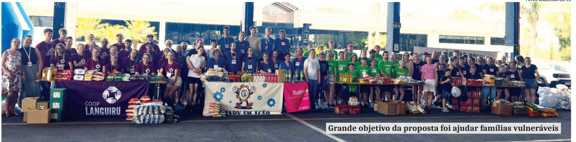
Grande objetivo da proposta foi ajudar famílias vulneráveis