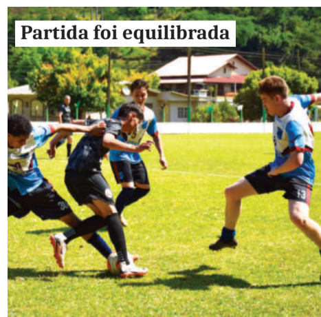
Partida foi equilibrada