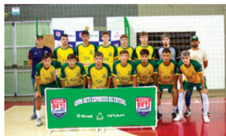
Ouro Verde - Sub-21