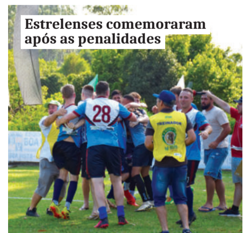
Estrelenses comemoraram após as penalidades