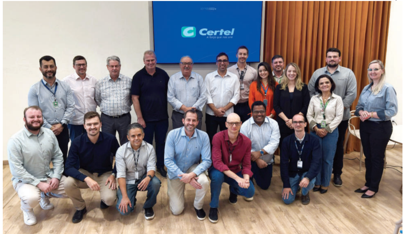
Certel sediou reunião com representantes da Aneel e das cooperativas participantes do projeto para discutir os resultados e os principais pontos de atenção

Para compreender o comportamento dos consumidores de baixa tensão e avaliar os desafios da migração, a Certel integra desde janeiro o projeto-piloto regulado pela Aneel, conhecido como Sandbox Regu-