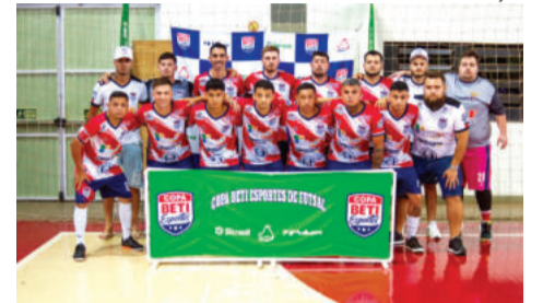
Meninos da Vila - Força Livre