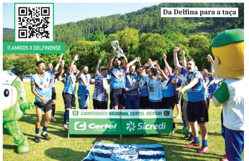
11 AMIGOS X DELFINENSE