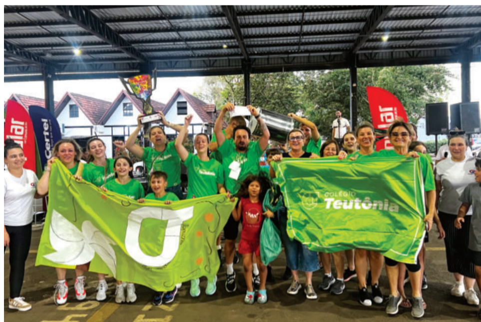
A equipe do Colégio Teutônia foi a campeã da 1ª Gincana Natal do Povo

vel foi alcançado. “Temos essa realidade bem presente, que, às vezes, fica esquecida. Ver o sorriso de agradecimento nas lideranças das nove entidades é o que nos fortalece, retribui todos os esforços da comissão organizadora e de um time de colegas que se engajou no projeto. Ano que vem tem mais”, prometeu.