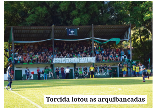
Torcida lotou as arquibancadas