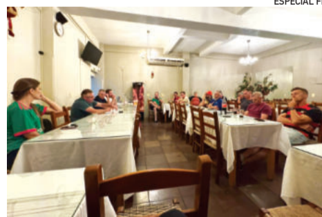
Momento ocorreu na noite dessa segunda-feira (8/12)

na reunião. O Flamengo, que havia pausado suas atividades esportivas recentemente, oficializou seu retorno e garantiu presença no campeonato.