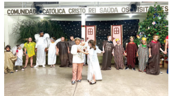
Primeira encenação representou o nascimento de Jesus, lembrado como símbolo de amor

apresentada pelos alunos das turmas da Assistência. A noite foi encerrada com um grande coral envolvendo todos os presentes.