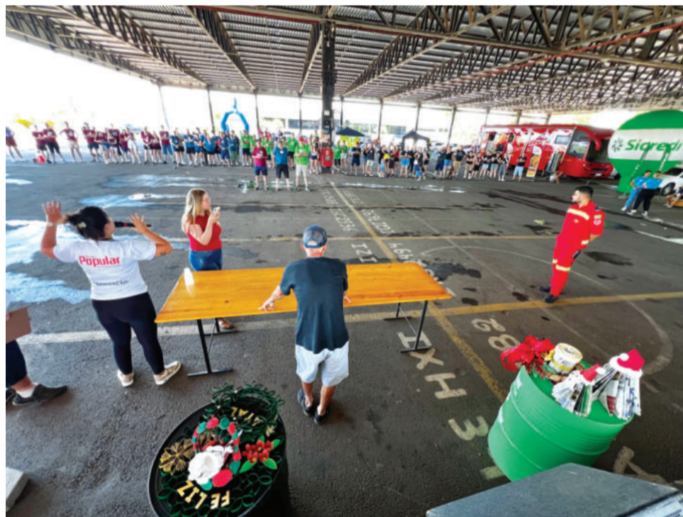
Provas e atividades empolgaram as equipes no domingo

ract, destacou a troca entre gerações. “Temos integrantes dos 15 aos 70 anos. Todo mundo aprende. Nossa experiência em voluntariado ajudou muito a coordenar mais de 70 pessoas e a cumprir as tarefas. A campanha das tampinhas, que já arrecadou quase uma tonelada no ano, foi a mais intensa”, defende.