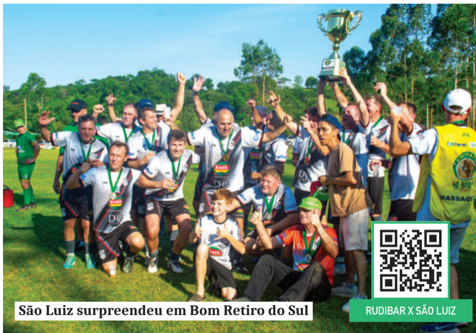
São Luiz surpreendeu em Bom Retiro do Sul