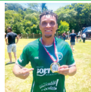
Roger, do Rudibar