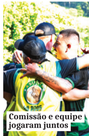
Comissão e equipe jogaram juntos