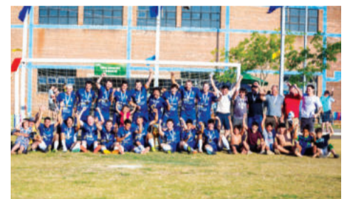
Águia Azul - Campo