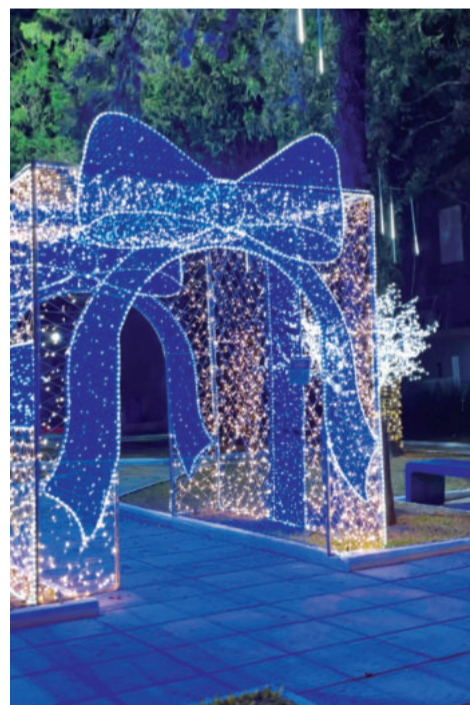
Luzes de Natal iluminam os corações da população e visitantes, que têm espaço iluminado para curtir à noite

ças da comunidade, convidadas a brincar e receber pacotes de Natal no dia 20.