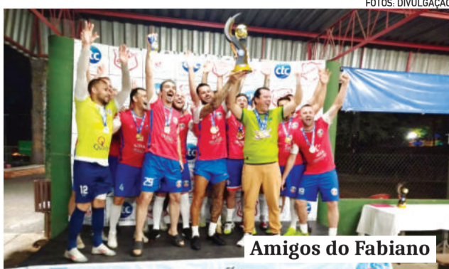
Amigos do Fabiano

Com a confirmação dos campeões, a organização agradeceu às equipes pelo comprometimento e qualidade técnica apresentada ao longo das rodadas. A expectativa agora se volta para 2026, ano da 15ª edição da Copa Integração, que promete seguir com as partidas.