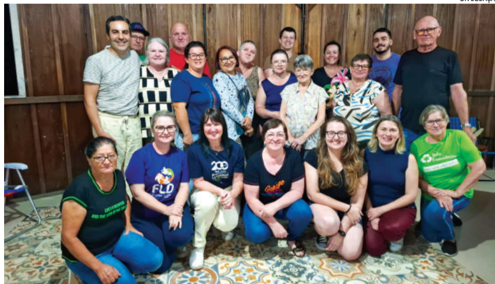
Primeira diretoria à frente da Horta Comunitária

A intenção é transformar a Horta Comunitária também em um espaço