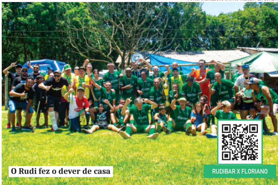
O Rudi fez o dever de casa