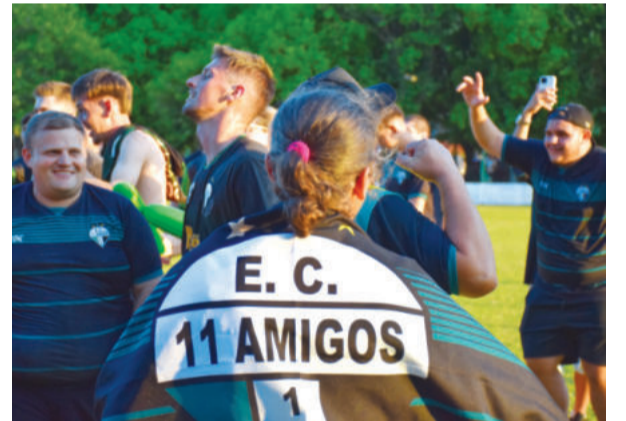
Sentimento passa por gerações