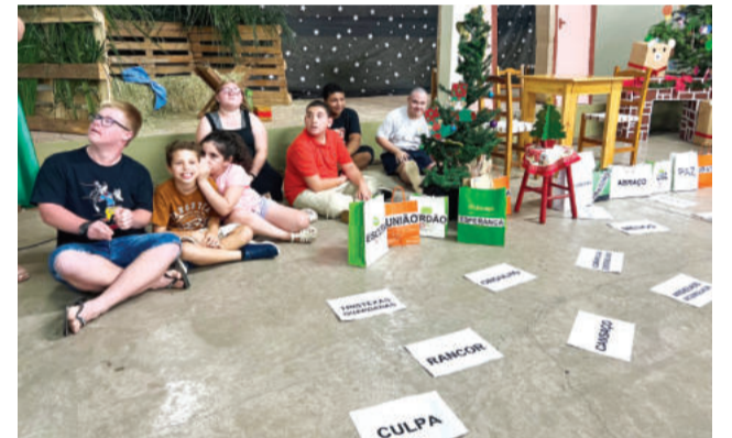
A troca de sentimentos foi promovida em uma dinâmica onde o negativo era descartado, permitindo novas emoções

A encenação final representou um laboratório de sonhos em clima de Natal. “A Fábrica dos Sonhos da Apae” foi