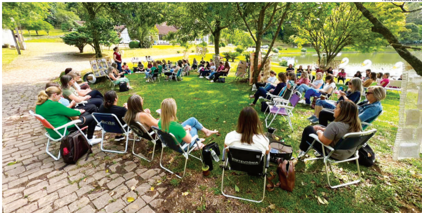
Grupo de professoras estiveram durante toda a manhã no último dia do curso de formação em Educação Infantil Ambiental