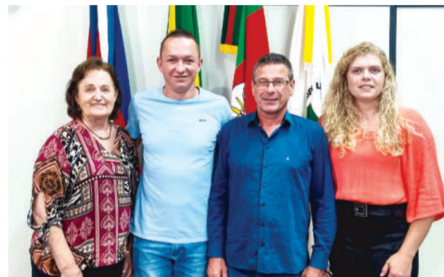
Mesa Diretora eleita para conduzir os trabalhos legislativos em 2026

çou a importância da instalação de câmeras no ginásio e agradeceu pelo ano de trabalho conjunto.