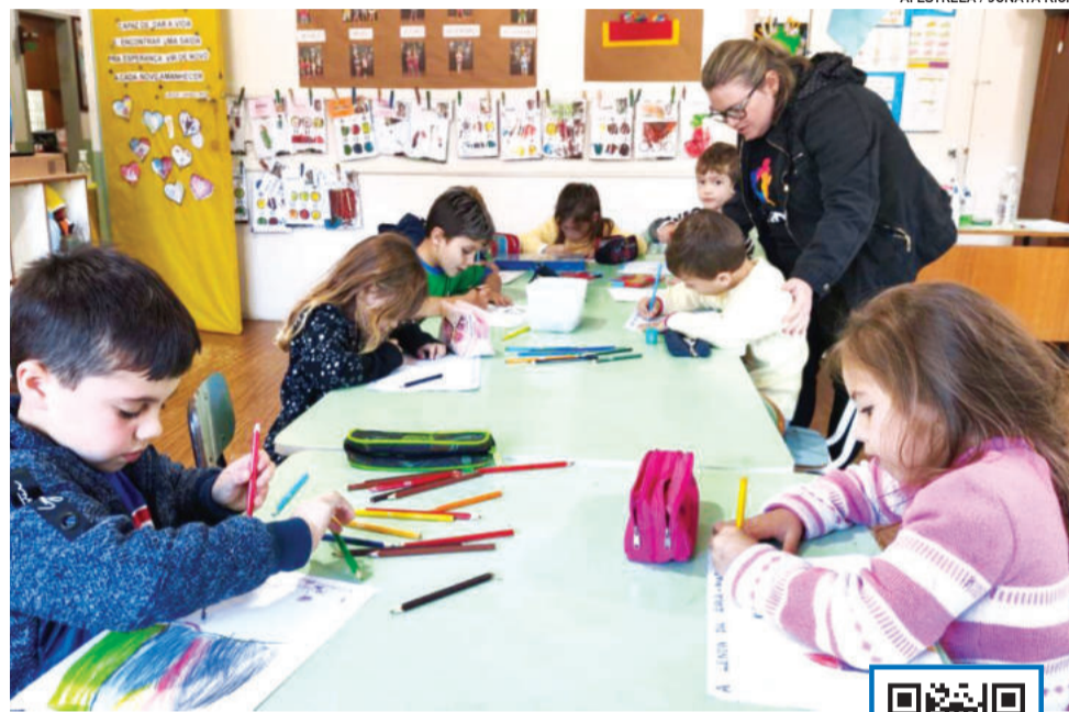
AI ESTRELA / JONATA KICH

Famílias poderão deixar seus filhos na Casa da Criança Estrelense ou na Colônia de Férias de 5 a 30 de janeiro