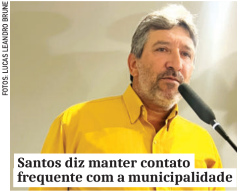
Santos diz manter contato frequente com a municipalidade

deixar o concreto em cima. Não posso vir prometer, mas foi o que me passaram”, comentou. Ainda assim, ponderou sobre a instabilidade do tempo e o período necessário para a cura do concreto.