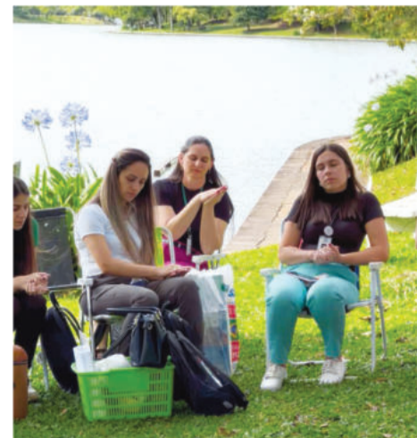
Professoras foram convidadas a momento de introspecção