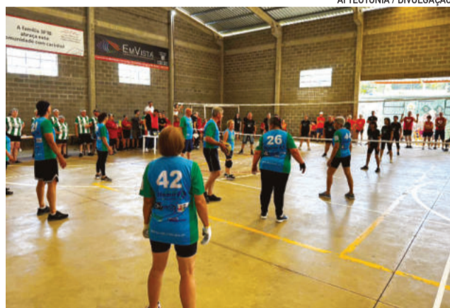
Competição ocorreu no Bairro Canabarro

Ao longo do dia, as disputas ocorreram em duas quadras adaptadas para a prática do câmbio. No total, 16 equipes representaram Arroio do Meio, Estrela, Teutônia, Westfália, Paverama e Santa Cruz do Sul.