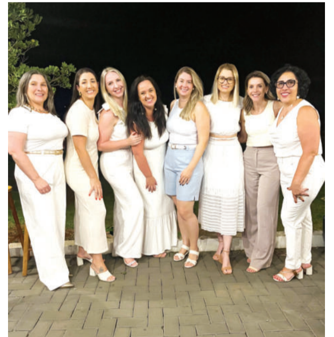
Equipe de coordenação do Núcleo de Mulheres

Cada associada recebeu como presente um porta-retrato com sua foto e a mensagem: