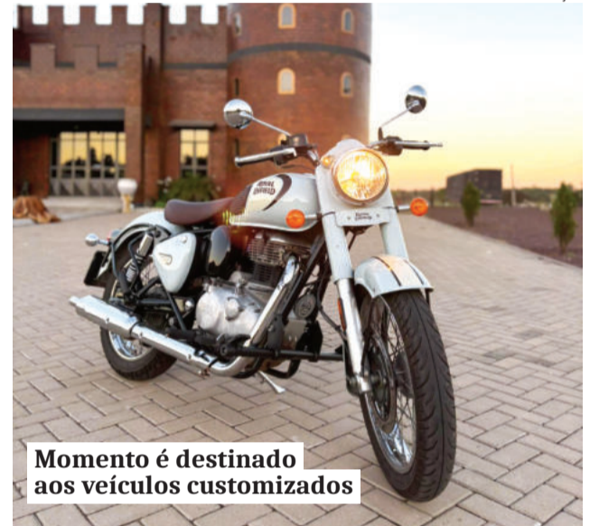
Momento é destinado aos veículos customizados

Evento marca inauguração da Cervejaria Bellver, na divisa entre Forquetinha e Lajeado