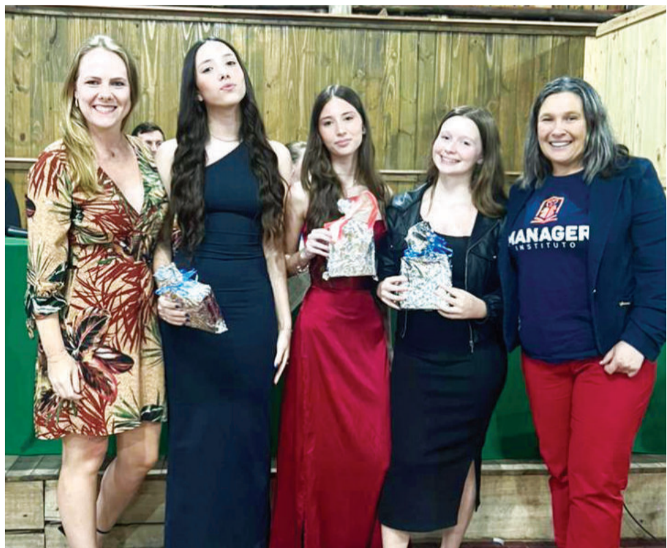
Estudantes receberam reconhecimento pelo destaque regional

O Programa Jovem Empreendedor tem como objetivo desenvolver potencialidades empreendedoras para que os estudantes sejam proativos e empreendedores na vida pessoal e profissional. Ao longo do ano, eles aprendem sobre comunicação, marketing, estratégias digitais, inovação, finanças, plano de negócios, inteligência artificial aplicada aos negócios, entre outros temas, além de realizarem visitas técnicas e participarem de eventos.