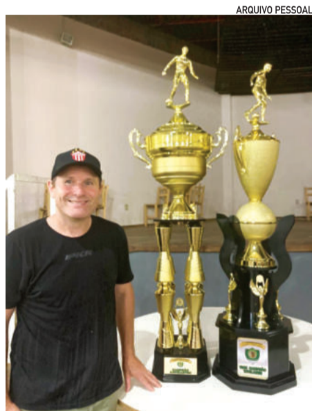
Remor é um nome conhecido no amador

É mais um interessante confronto dessa decisão, que promete ser uma das mais agitadas da história.