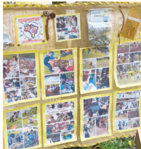
Práticas em sala de aula formaram mosaicos de aprendizagem