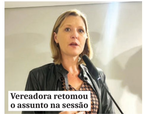
Vereadora retomou o assunto na sessão

das as providências legais e que a Fepam apure essas irregularidades”, completou.