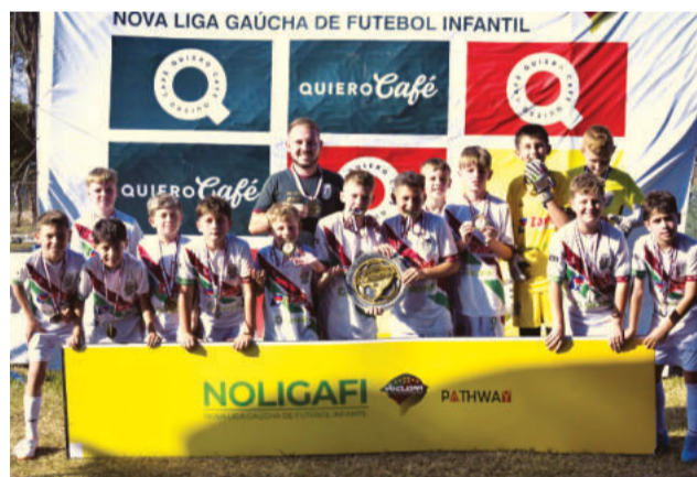
Sub-10 venceu o Estadual Nologafi Evolução