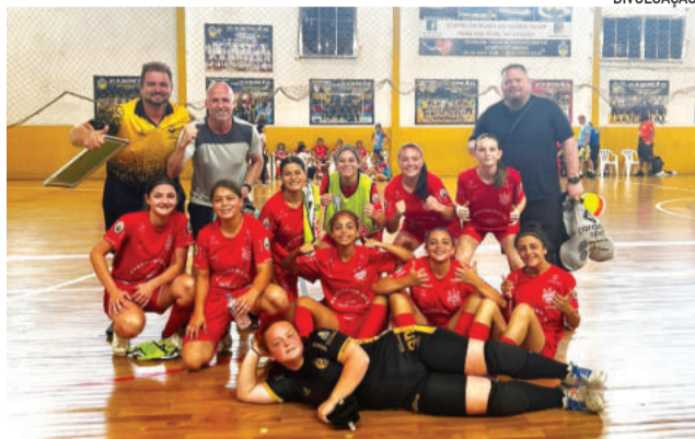
Teutonienses fizeram bonito em Foz do Iguaçu

O Baile de Munique encerrou sua participação na Copa Mundo do Futsal Feminino de Base 2025 no sábado (20/12), em Foz do Iguaçu (PR), e traz muito mais do que resultados em sua bagagem. A presença da equipe na competição foi marcada por superação, resiliência e pela força de atletas e famílias que se recusaram a desistir diante do suposto golpe financeiro aplicado pelo antigo treinador da equipe.