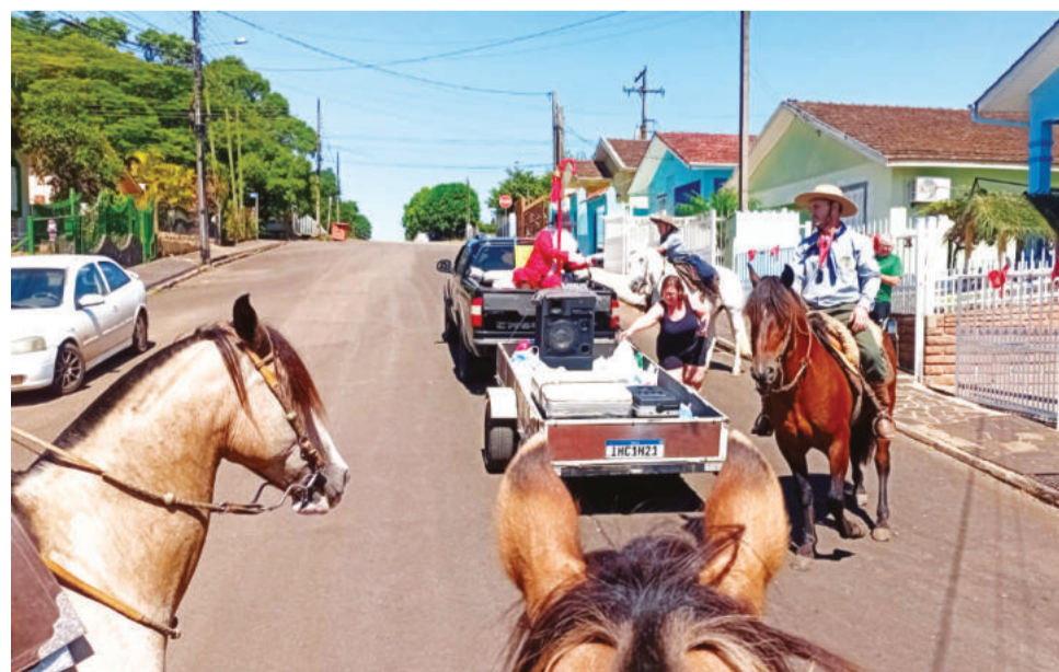
Mantimentos começaram a ser entregues nesta semana

Enquanto os cavaleiros percorriam as ruas arrecadando donativos diretamente com os moradores, grupos da invernada artística e apoiadores estiveram em pontos estratégicos da cidade, especialmente nos supermercados Frederico, Passarela, Super Esquinão Alesgut, Super Esquinão Canabarro, Super Zart, entre outros, convidando clientes a colaborar com a iniciativa. Os itens solicitados incluíram alimentos não