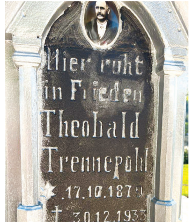
Resgate da história da família

O 1º Encontro da Família Trennepohl é aberto aos descendentes e também a pessoas interessadas em genealogia e história local, reforçando a importância da preservação da memória como elemento fundamental da identidade comunitária.