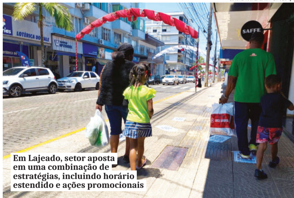
Em Lajeado, setor aposta em uma combinação de estratégias, incluindo horário estendido e ações promocionais

em torno de 10% nas vendas natalinas. A CDL observa que os últimos dias antes do Natal concentram o maior volume de movimento e faturamento, cenário que deve se