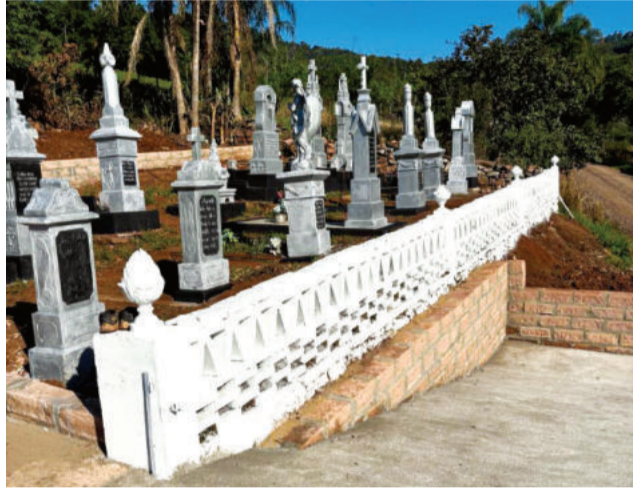
Revitalização do Cemitério de Linha Catarina

A programação inicia no sábado (27/12) com atividades ligadas