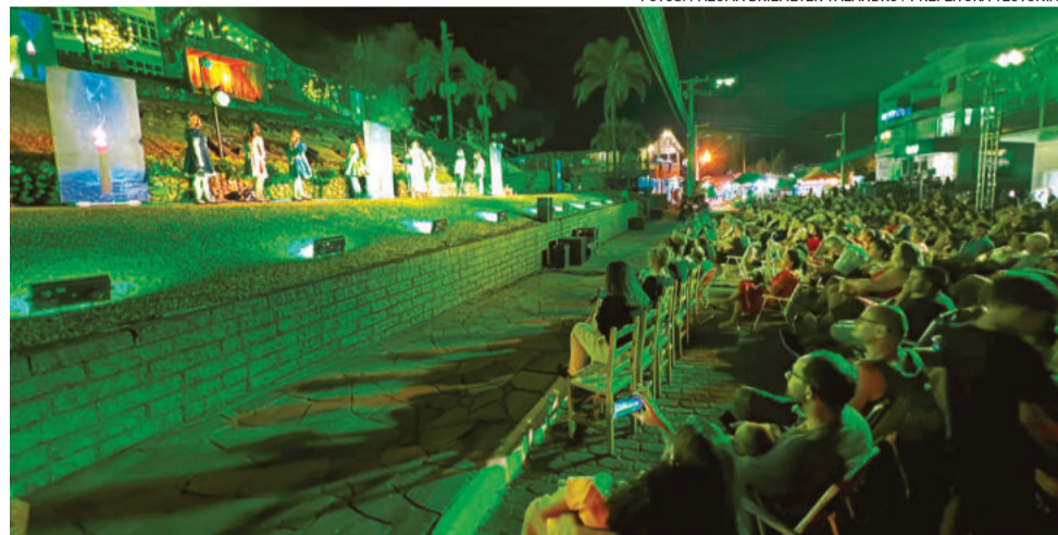
Evento tradicional foi realizado em frente a Prefeitura