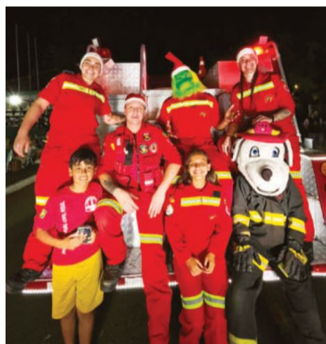
Papai Noel, mascotes e empresas parceiras acompanham o trajeto