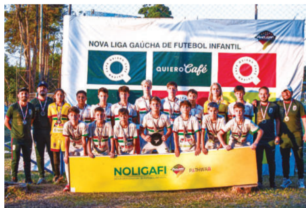
Sub-13 foi vice no Estadual

dezembro, todas as categorias entram agora em período de preparação, que visa os torneios de verão do mês de janeiro, entre eles, a tradicional Copa Teutô-