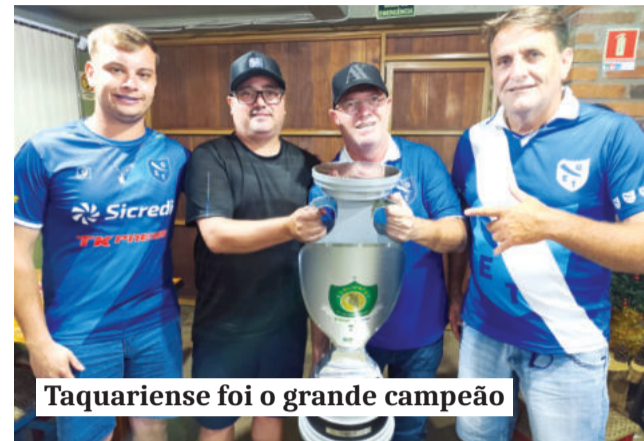
Taquariense foi o grande campeão