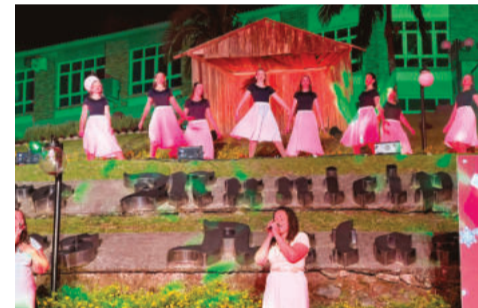
Grupo de Danças Movimentu's foi um dos integrantes do evento

das responsáveis pela ação, destacou a expectativa positiva do grupo. “A gente decidiu fazer aqui, porque o terceiro ano geralmente faz a barraca, mas este ano eles já têm dinheiro suficiente para a formatura. Então, para a escola não perder a oportunidade, o segundo ano ficou com esse espaço. É a nossa primeira vez fazendo isso e as expectativas estão bem altas”, afirmou.