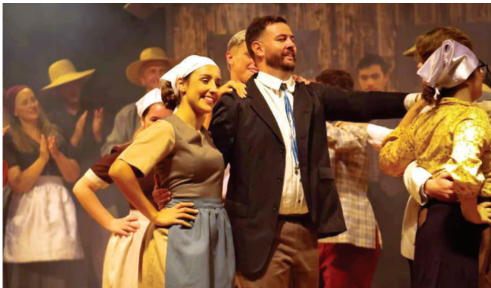
Montagem do diretor Pablo Capalonga, em 2024, mostrou os 150 anos da imigração italiana