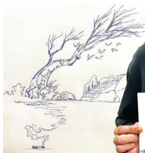
Desenhos são retratos fiéis da história de dificuldades e perseverança