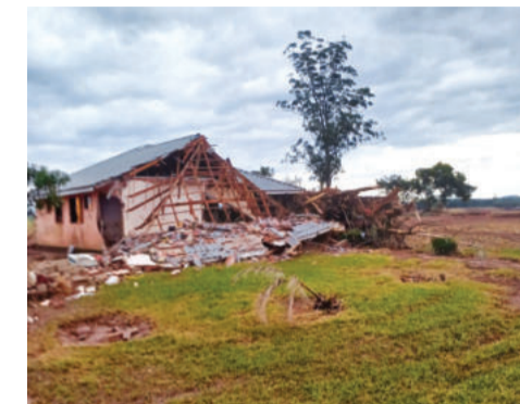
Resgates ocorreram na comunidade de Arroio do Ouro, fortemente atingida pela enchente

A Árvore da Solidariedade é uma iniciativa da Secretaria Municipal de Cultura, em parceria com o Fundo Social de Solidariedade, que busca reconhecer e dar visibilidade aos voluntários anônimos que foram essenciais para a