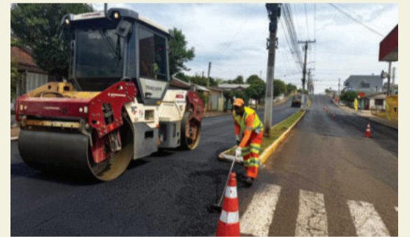
Entre as obras de infraestrutura, houve a recuperação do asfalto na Avenida 1 Leste, entre Canabarro e Languiru