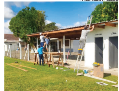
Após a baixa das águas, voluntários ajudaram na limpeza e obras na localidade