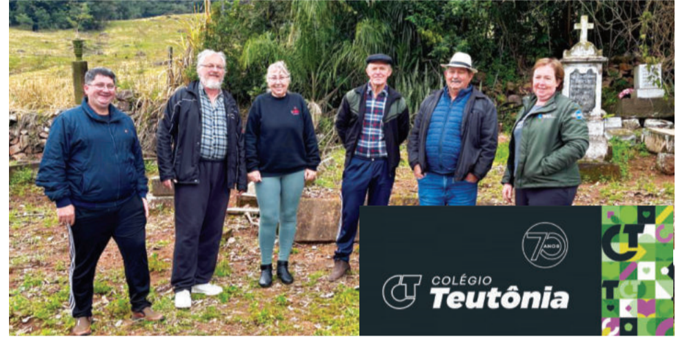
Parte da equipe de voluntários que trabalhou na revitalização do cemitério

Após o momento no cemitério, os participantes visitarão a antiga casa onde viveram antepassados da família, local que ainda preserva ferramentas e objetos do período, permitindo uma imersão na rotina e no modo de vida das primeiras gerações. A programação segue com almoço coletivo, confraternização e