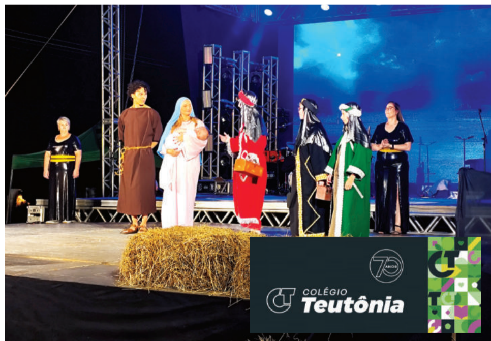
Encenação do nascimento de Cristo teve participação de 40 voluntários