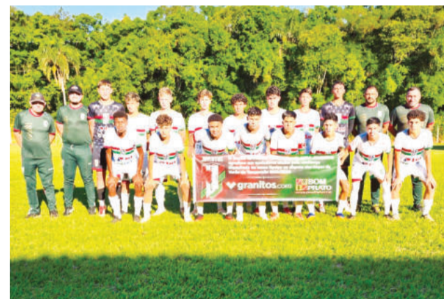
Sub-15 teve a 3ª posição em Itá