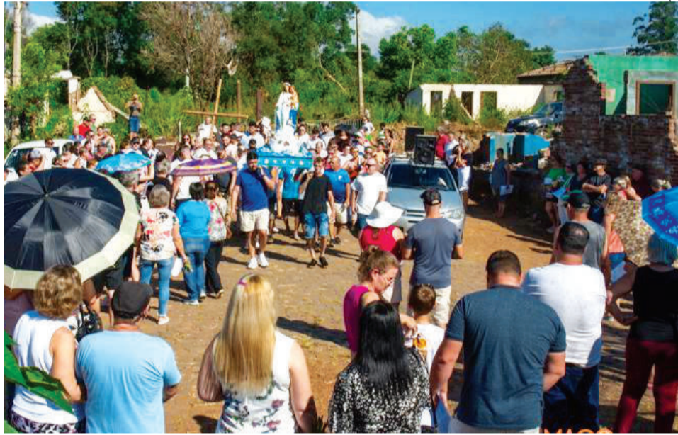
Procissão de Nossa Senhora dos Navegantes, em Arroio do Meio, correrá entre os escombros do bairro