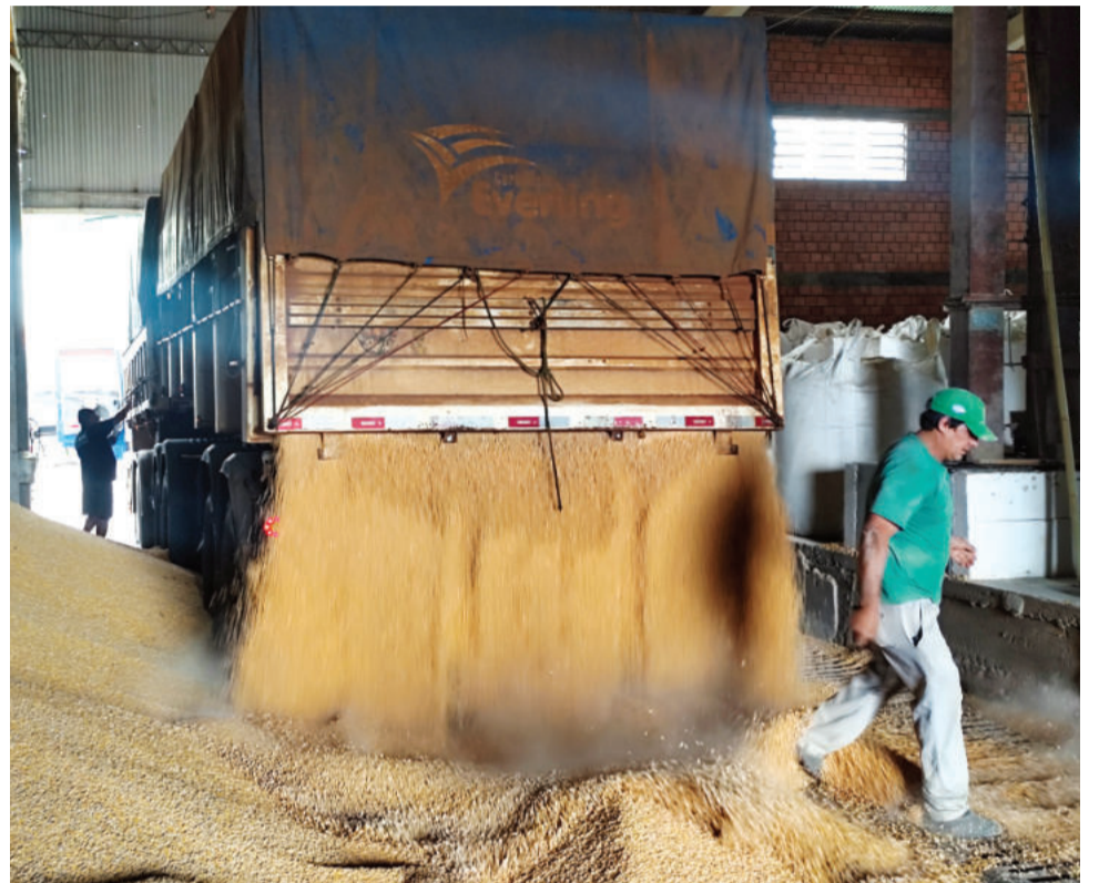
Colheita acelerada, produtividade acima da média histórica e grãos com alta umidade pressionam estrutura regional

Já a Cooperativa Languiru esclarece que, embora haja espaço para armazenar milho seco, o alto fluxo de grãos úmidos comprometeu a capacidade de secagem