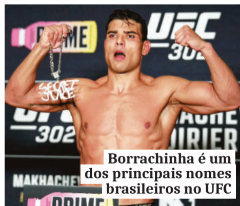
Borrachinha é um dos principais nomes brasileiros no UFC

participação em uma luta da modalidade, embora o foco principal esteja voltado à preparação de Borrachinha para o confronto do UFC 327 contra o russo Azamat Murzakanov.