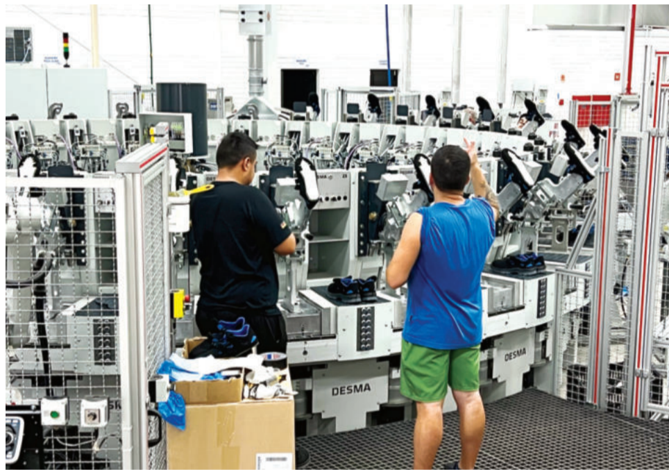
Maquinário permite injeção de solado com alta tecnologia