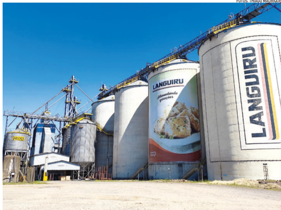
Languiru retomou o recebimento nessa sexta-feira (30/1), mas somente para associados