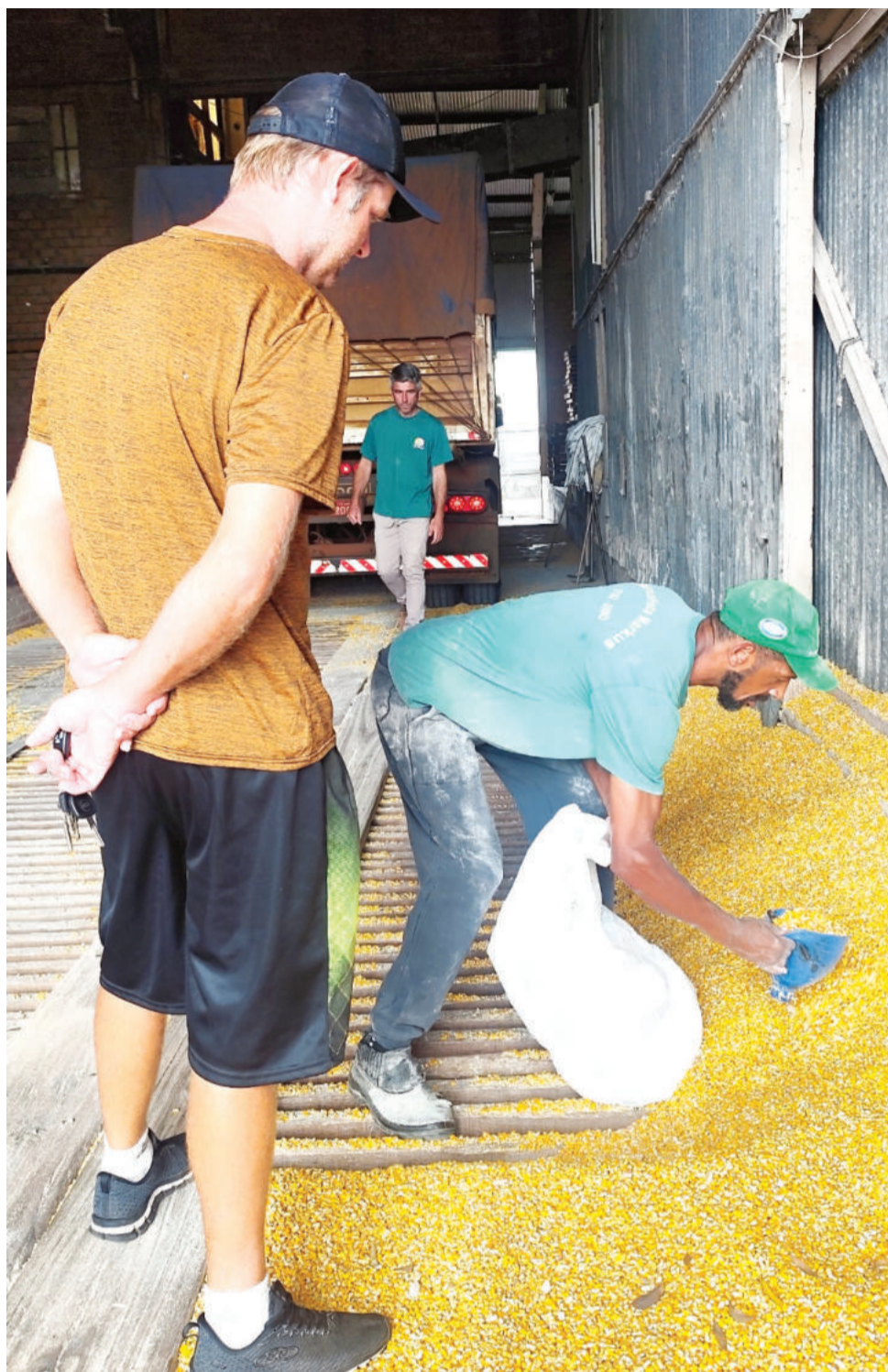
Alto índice de umidade do milho exige mais tempo de secagem e eleva pressão sobre os cerealistas