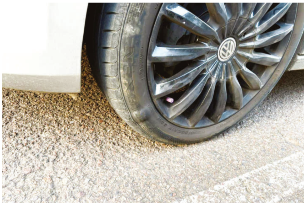
Moradores e usuários frequentes da rodovia relatam custos elevados em manutenção de veículos devido à precariedade da estrada

Em alguns trechos, como em Linha Capivara, o desnivelamento da pista, combinado com a curva acentuada, torna o trajeto ainda mais perigoso. Segundo o secretário, que acompanha os trabalhos de recapeamento realizados pelo Daer, a obra será uma medida paliativa. “Vai ceder de novo, porque é a base o problema. Tem que arrancar a terra em baixo, que está precária”, alerta.