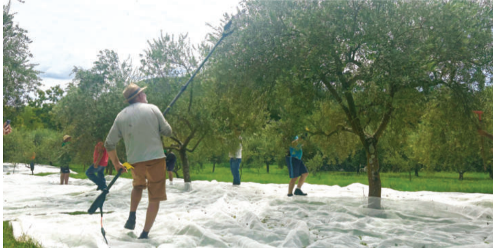
Colaboradores são treinados para não prejudicar as árvores e garantir a qualidade da fruta

A situação não é diferente para o Sítio das Caturritas, em Boa Vista Fundos, Teutônia. Este é considerado o ano de melhor safra desde o início do cultivo de oliveiras, há 13 anos. A colheita foi concluída na semana passada e rendeu 4 toneladas de olivas, volume recorde