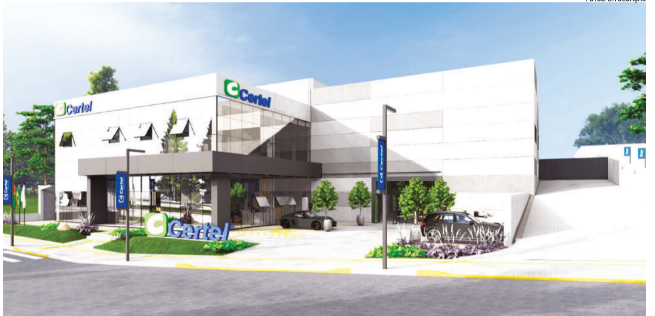
Nova unidade está localizada no Bairro Montanha

Anunciada em 2023, a iniciativa previa investimentos superiores a R$ 250 milhões, com capacidade instalada estimada em 35,18 megawatts (MW)