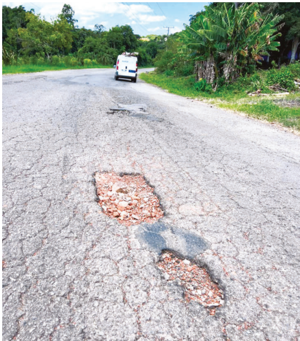
Buracos profundos na pista de rodagem são desafios diários para quem trafega na rodovia