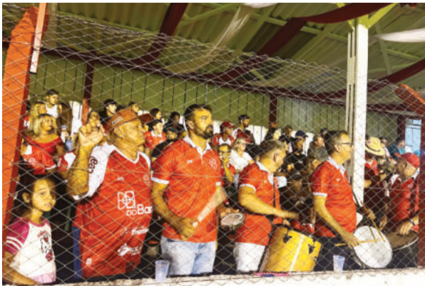
Arquibancadas ganharam vida no sábado