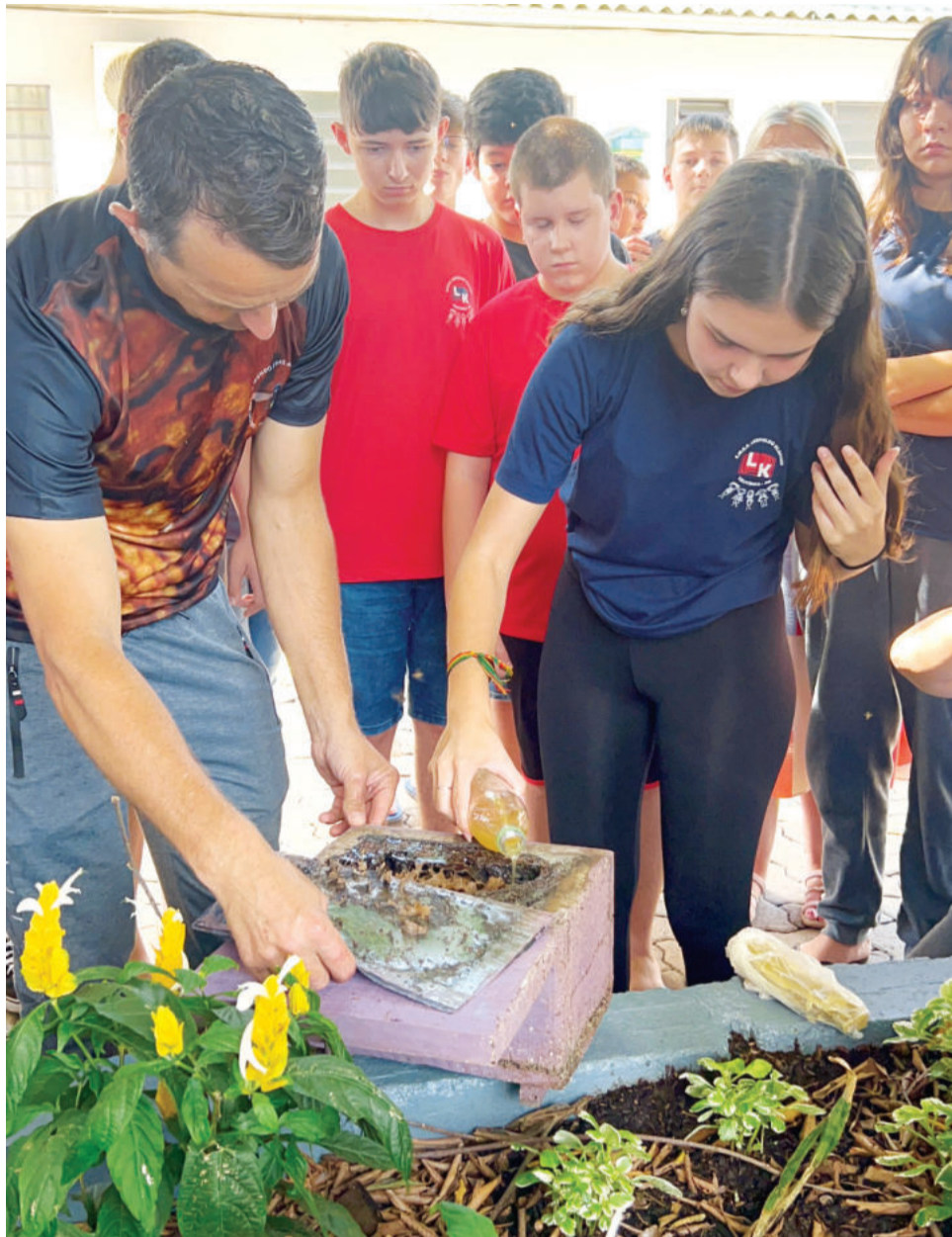
Caixas foram abertas para monitorar as espécies e alunos puderam ajudar a alimentá-las

“Meu pai sempre ensinou a importância das abelhas sem ferrão, tanto para mim quanto para a minha irmã. É gratificante ver esse projeto sendo instalado aqui na nossa escola. Que ele possa mostrar isso para mais pessoas, abrir seus olhos para o mundo e dizer que as ASF são essenciais nas nossas vidas. Elas ajudam muito e muitos