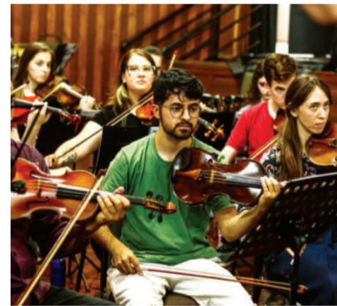
Orquestra tocará por mais de 1 hora de forma ininterrupta

São João Bosco e na Escola Municipal de Ensino Fundamental (Emef) Dom Pedro I, em Lajeado. Em Estrela, ocorrerá na Emef Professora Ruth Markus Huber. A ação também passa por Arroio do Meio, Encantado, Santa Cruz do Sul e Venâncio Aires.