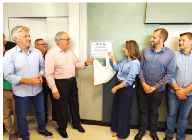
Descerramento da placa marcou a entrega do edifício

A viabilização da área ocorreu por meio de uma permuta envolvendo imóvel da cooperativa na Avenida Amazonas. A negociação teve a participação da iniciativa privada, do Ministério Público e do poder público municí-