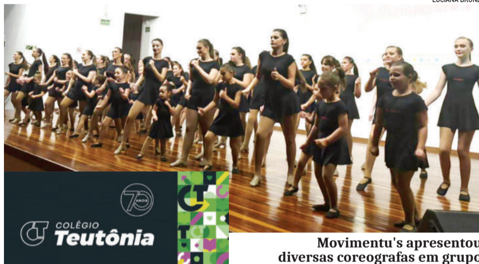
Movimentu's apresentou diversas coreografias em grupo