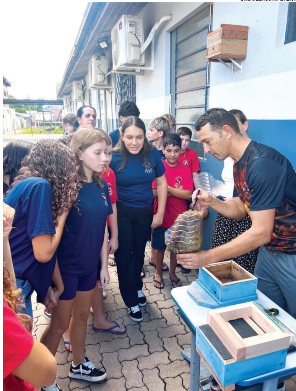
Aos poucos, os alunos aprendem a não temer as abelhas sem ferrão