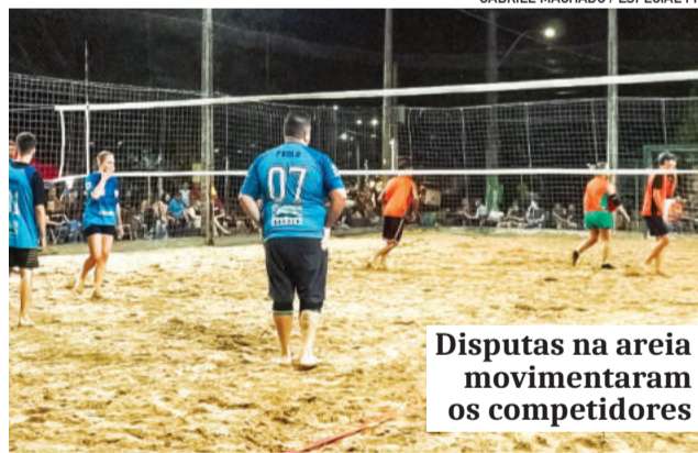
Disputas na areia movimentaram os competidores

“O nosso Torneio de Verão é um evento que inicia com uma noite bonita e traz divertimento para a população. O momento acontece há anos e faz com que consigamos integrar todas as famílias. Pode ver