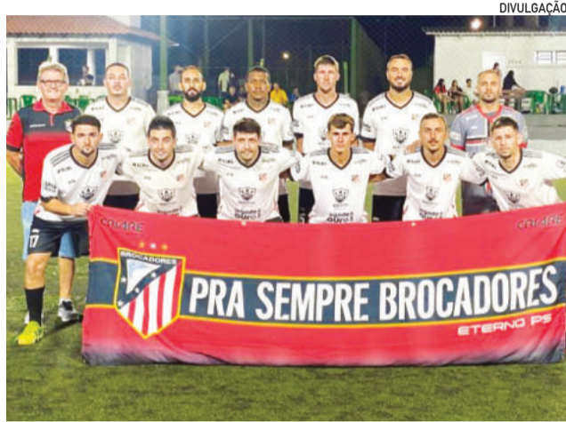
Brocadores, de Teutônia, garantiu vaga na próxima fase

A terça-feira teve partidas das duas séries. Pela Prata , o Celtic Teutônia carimbou vaga ao derrotar o Super 10 por 3 a 2. Na outra disputa, válida pela Série Ouro , o ST Ambeve triunfou sobre o Sombras pelo placar de 3 a 1.