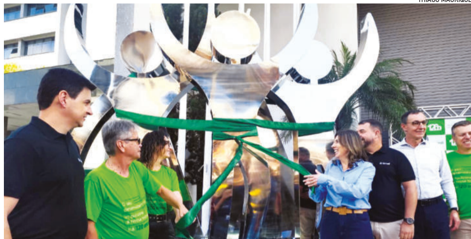
Estátua fica na sede da cooperativa, no Bairro São Cristóvão

“A Sicredi foi construída por muitas mãos e continua sendo assim,