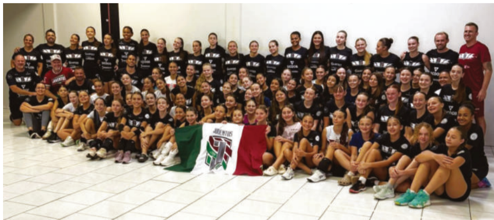
Projeção para este ano é alcançar cerca de 900 atletas

Foram apresentadas as categorias Pré-Mirim, Mirim B, Mirim A (Sub-14), Infantil B, Infantil A (Sub-16) e Infante (Sub-19). O encontro também marcou a introdução da comis-