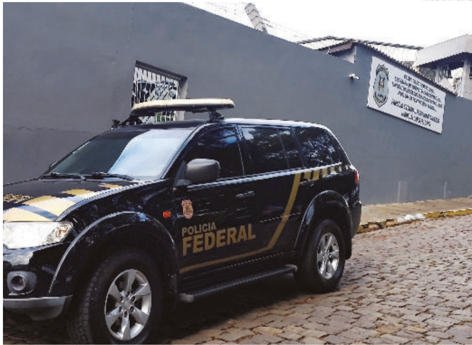
PF cumpriu mandados de prisão, busca e apreensão em Lajeado na quinta-feira

A prisão temporária, com prazo de 5 dias, foi autorizada pelo Tribunal Regional Federal da 4ª Região (TRF-4), sob o argumento de evitar que os investigados