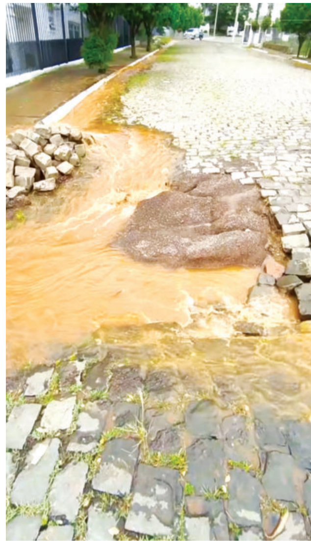
Em janeiro, tubulação estourou no Bairro Americano, em Lajeado, alagando vias públicas e residências

A companhia também informou que as ocorrências registradas em bairros de Lajeado são pontuais e, em sua maioria, relacionadas a manutenções programadas ou emergenciais. Nega reestruturação que implique interrupções sistemáticas no fornecimento.