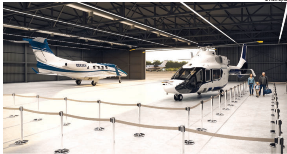
Prazo para a conclusão do empreendimento é de até 2 anos

como este muda a forma como o município é visto. Ele coloca Cruzeiro do Sul em outro patamar, de competitividade, com infraestrutura de alto nível para atrair investimentos e gerar oportunidades. Ainda, conecta a cidade a outros centros do estado e do país”, afirmou Spiekermann.