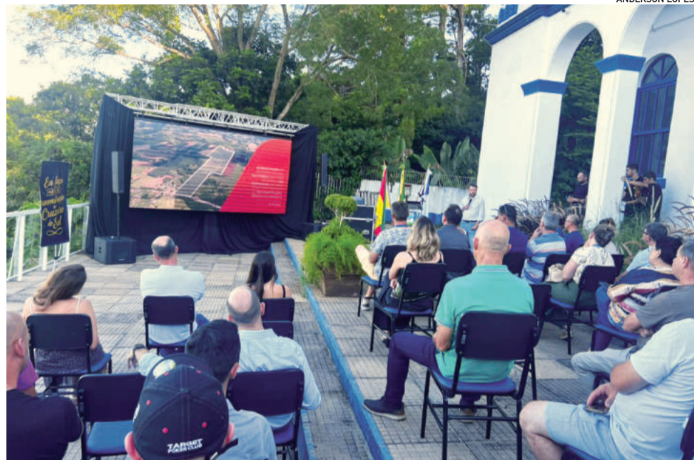
Evento de apresentação do projeto foi realizado na Casa do Morro

Principalmente, o condomínio aeronáutico deve fortalecer a posição estratégica de Cruzeiro do Sul no Vale do Taquari. “Um empreendimento