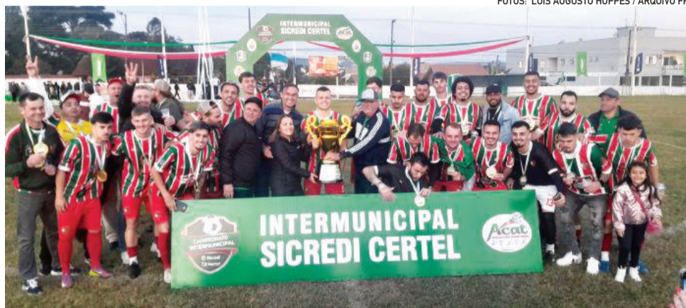
Canabarense conquistou o tricampeonato Intermunicipal nos Titulares

A primeira fase terá oito rodadas, garantin-