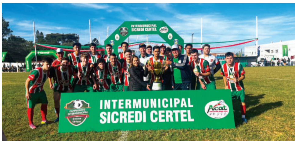
Canabarense conquistou o título dos Aspirantes também no ano passado

do seis jogos para cada clube. O término desta etapa está previsto para 26 de abril. A final do campeonato, sem transferências de datas, está projetada para 28 de junho, dentro de um calendário total de 14 datas.