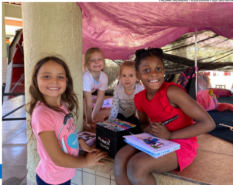
PALOMA VALANDRO / ASSESSORIA POÇO DAS ANTAS