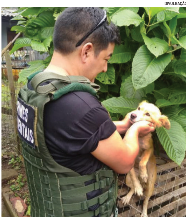
Grande parte dos animais abandonados são cães