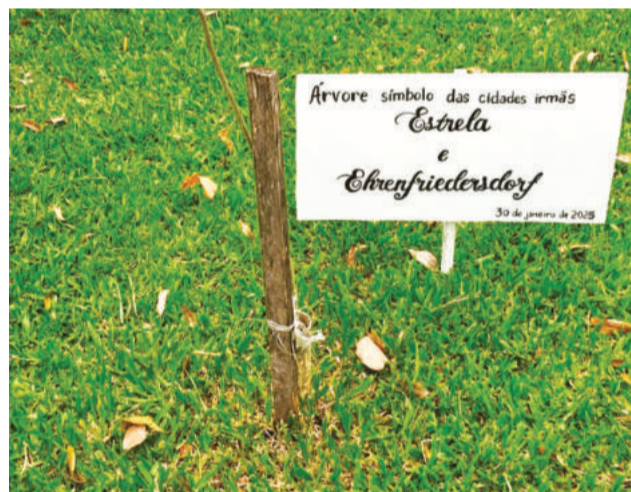
Visitantes registraram sua presença com o plantio de árvore na Praça