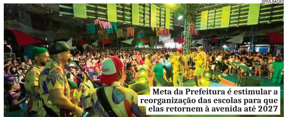
Meta da Prefeitura é estimular a reorganização das escolas para que elas retornem à avenida até 2027

aberto, familiar, gratuito, também pensamos em segurança, acolhimento, em quem pode ou não pode estar na rua”, explica. A aposta atual, segundo ela, é resgatar o caráter popular da festa. Bailes com marchinhas, programação infantil e eventos gratuitos buscam reconstruir vínculos afetivos entre gerações. “A ideia é trazer a avó com o neto, a família inteira, para criar boas memórias. É isso que sustenta o carnaval”, resume.