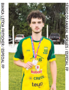
Bebeim, do Poço das Antas