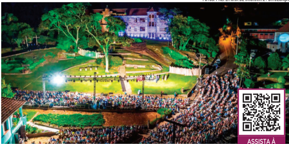
Edição de 2025 reuniu 14 mil pessoas em duas datas

Segundo ele, o espetáculo ultrapassa o limite de uma apresentação e se transforma em um movimento que soma coletividade e emoção. “Existe um