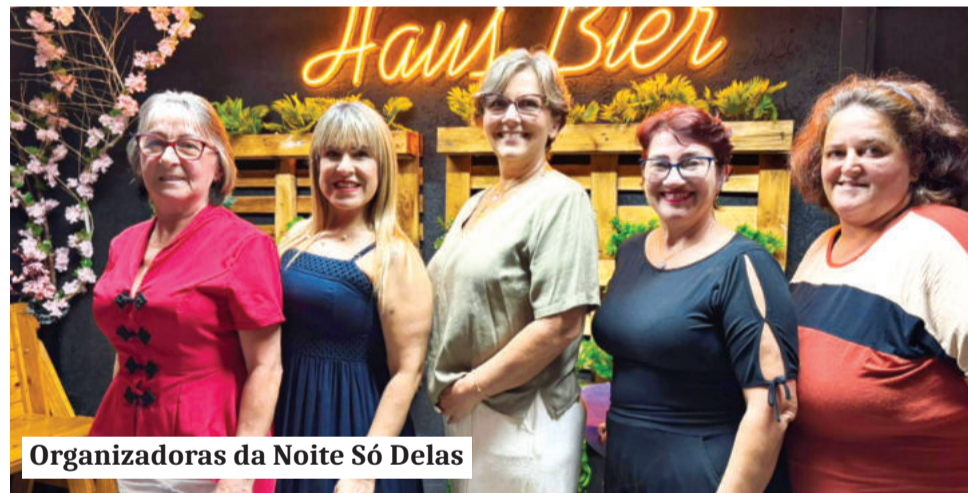
Organizadoras da Noite Só Delas

Além da palestra, foi servida uma janta, houve sorteio entre as participantes e, depois, baile com música ao vivo.