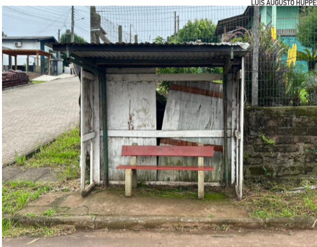
No Bairro Teutônia, estrutura localizada na Rua Maurício Cardoso foi construída de forma improvisada

A proposta busca, portanto, qualificar a infraestrutura urbana e atender a uma demanda crescente por novos abrigos e condições melhores nos locais de espera do transporte coletivo.