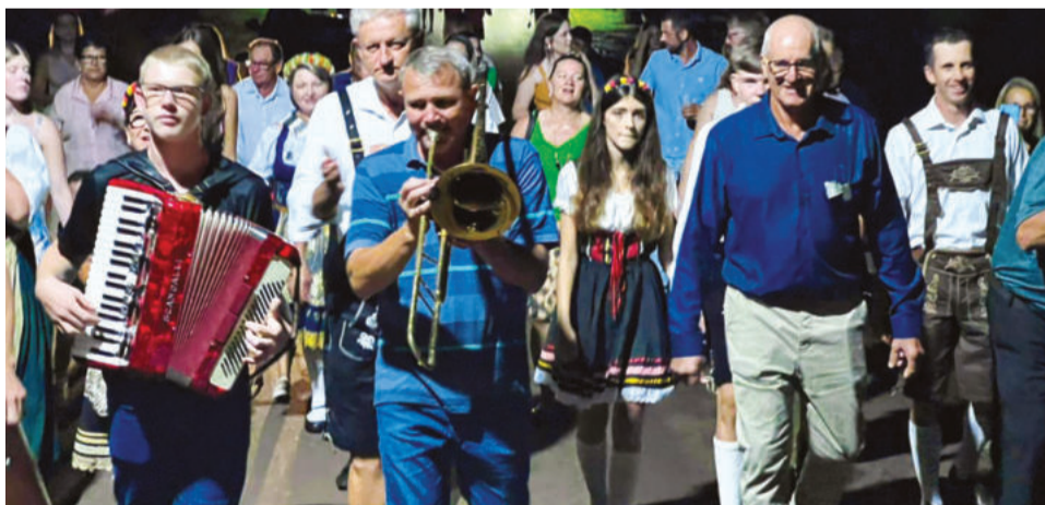
Como de praxe, moradores percorreram trajeto entre a casa do rei e a Associação

calma e se concentrar bastante”, explicou ela.