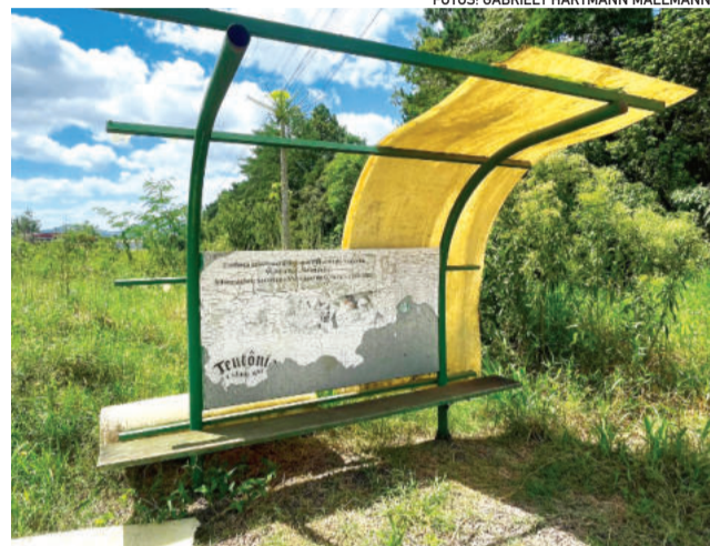
Usuários de parada no Centro Administrativo precisam aguardar em meio à vegetação e cobertura imprópria

No Bairro Teutônia, situações também chamam a atenção. Outro abrigo de parada de ônibus existente foi construído de forma improvisada, em madeira. Embora ainda esteja em uso pela comunidade, a estrutura apresenta sinais de desgaste.