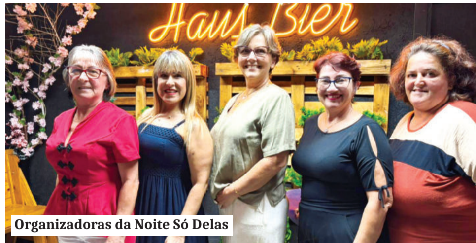
Organizadoras da Noite Só Delas

Além da palestra, foi servida uma janta, houve sorteio entre as participantes e, depois, baile com música ao vivo.