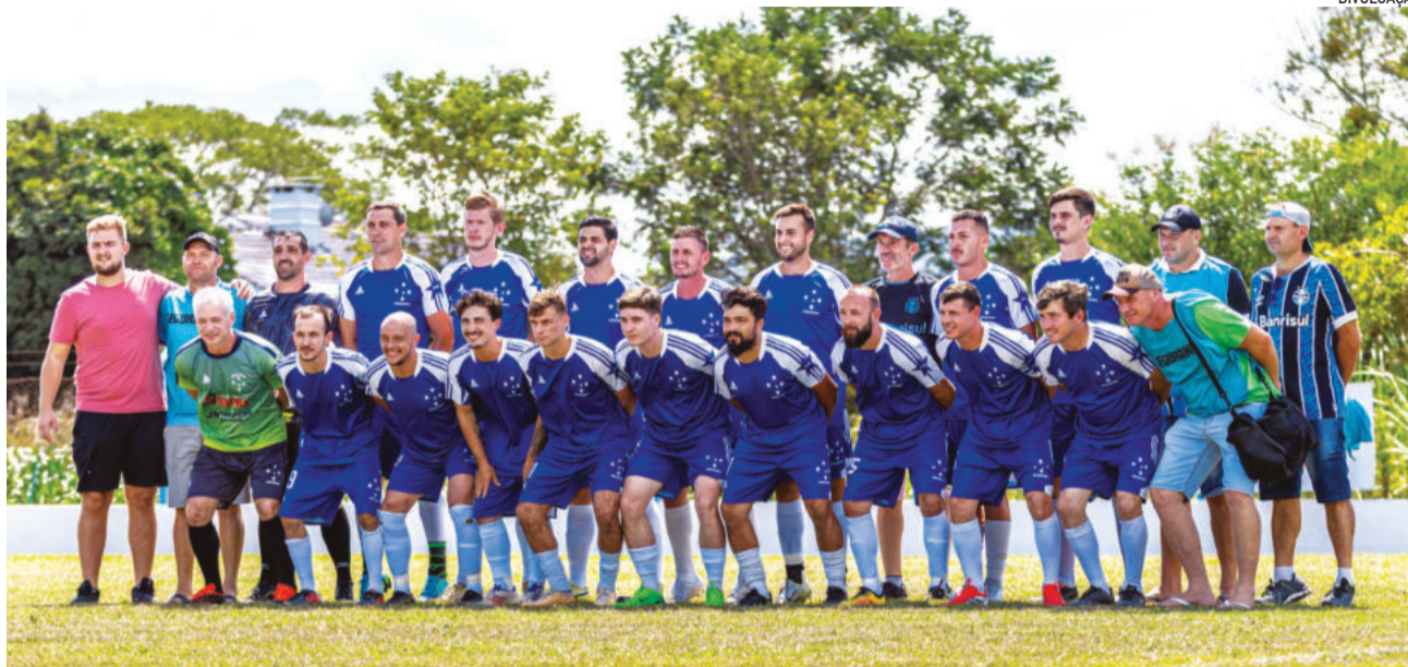
Cruzeiro foi o único que venceu em Imigrante

Em Imigrante, o atual vice-campeão Cruzeiro foi o único a conquistar vitória na 2ª rodada. Os jogos ocorreram no campo do Juventude, em Linha 31 de Outubro/Barra da Seca, em Colinas. A programação começou pela manhã, com o empate em 1 a 1 entre Canarinho e Riograndense. O time de Daltro