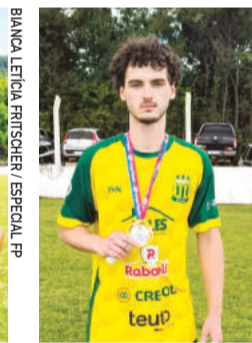
Bebeim, do Poço das Antas