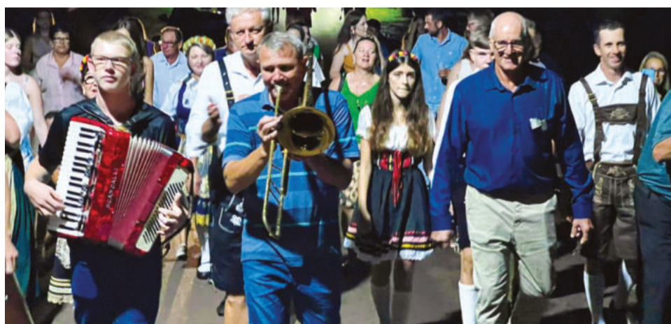
Como de praxe, moradores percorreram trajeto entre a casa do rei e a Associação

calma e se concentrar bastante”, explicou ela.