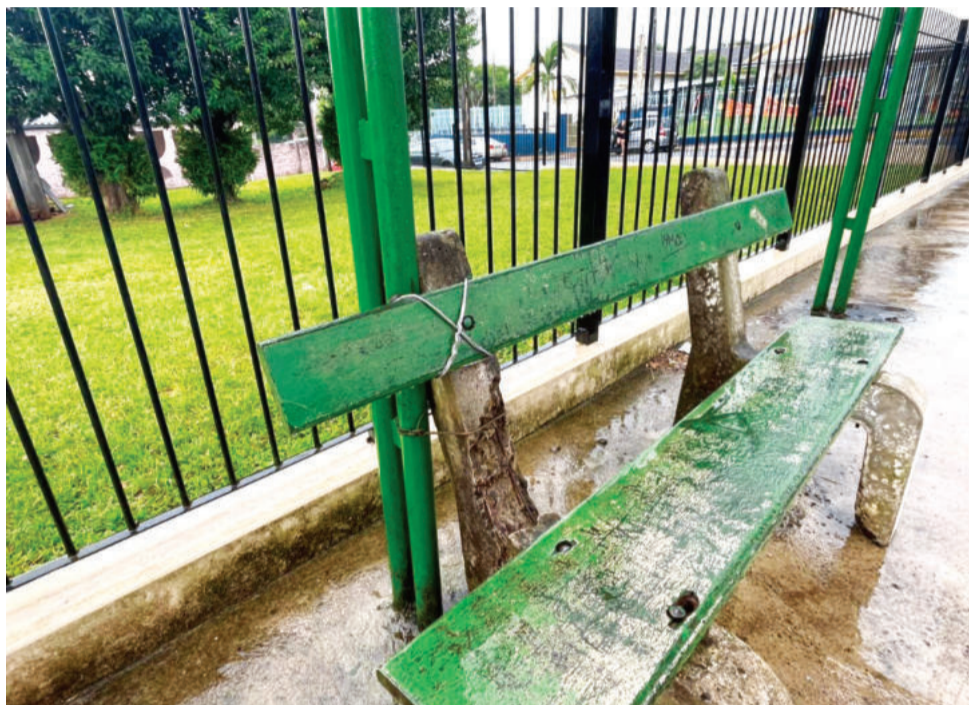
Em Canabarro, ponto precisou ser apoiado em muro e no banco para permanecer em pé

sugere que a Administração estude a adoção de um novo modelo de abrigo, mais moderno e confortável, capaz de proteger usuários e estudantes do sol intenso, da chuva e do vento.