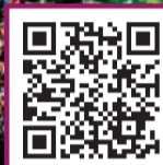
ASSISTA À ENTREVISTA