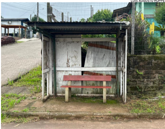
No Bairro Teutônia, estrutura localizada na Rua Maurício Cardoso foi construída de forma improvisada

A proposta busca, portanto, qualificar a infraestrutura urbana e atender a uma demanda crescente por novos abrigos e condições melhores nos locais de espera do transporte coletivo.