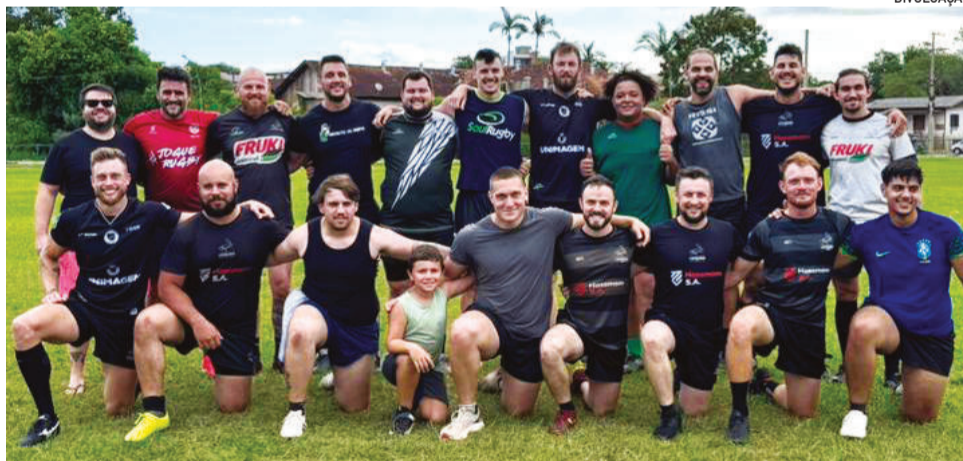
Clube de Estrela realiza treinos fortes nesse início de ano

Em abril, os compromissos passam a alternar entre amistosos e jogos oficiais do Cam-