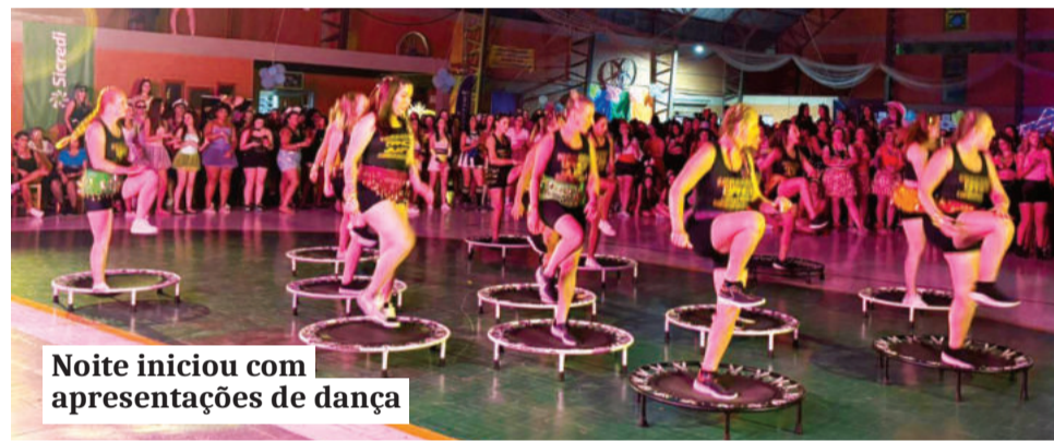
Noite iniciou com apresentações de dança