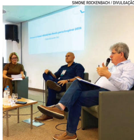
SIMONE ROCKENBACH / DIVULGAÇÃO

O movimento contribuiu para ampliar a produtividade, a eficiência operacional e a qualidade dos processos da empresa, que em abril completa 35 anos de atuação. Eles citaram exemplos de inovação no chão de fábrica, como a automação de formulações e a utilização de robôs em etapas da produção, iniciativas que ampliaram a capacidade produtiva e trouxeram maior padronização aos processos.