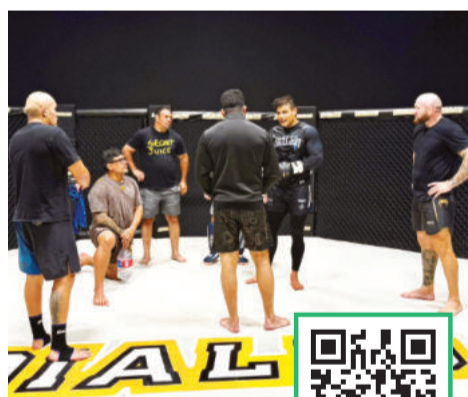
Treinos ocorrem de forma intensa e muito pesada