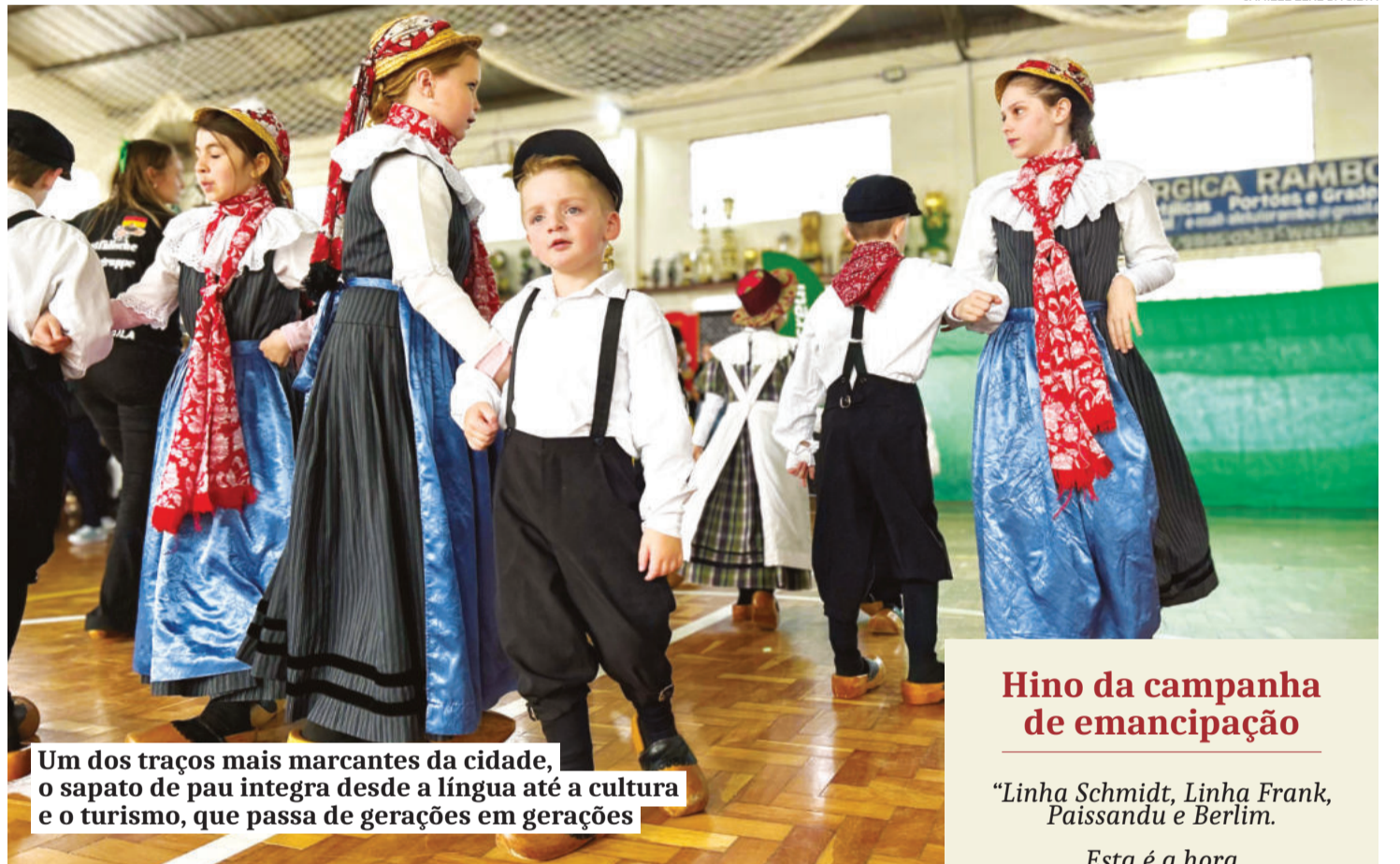
Um dos traços mais marcantes da cidade, o sapato de pau integra desde a língua até a cultura e o turismo, que passa de gerações em gerações

É na região da Vestfália, próxima à Holanda e integrada ao atual estado da Renânia do Norte, que buscamos as raízes mais profundas. Os imigrantes que seriam os nossos pioneiros chegaram às terras que hoje formam Westfália por volta de 1869. Trouxe-