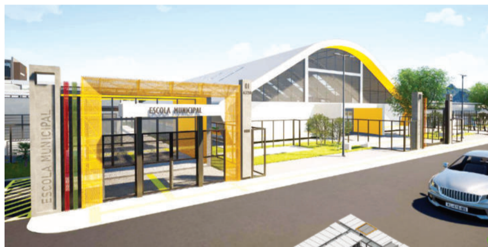
Complexo abrigará alunos das redes estadual e municipal de ensino

execução, redução de resíduos e menor impacto ambiental, além de priorizar soluções sustentáveis e conforto para alunos e professores.