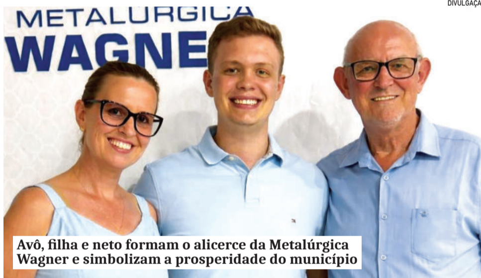
Avô, filha e neto formam o alicerce da Metalúrgica Wagner e simbolizam a prosperidade do município

Antes disso, foram 15 anos de trabalho no setor metalúrgico, em uma época em que praticamente tudo era feito de forma manual. Ferraria, carpintaria e moinho exigiam esforço físico e aprendizado constante. Foi