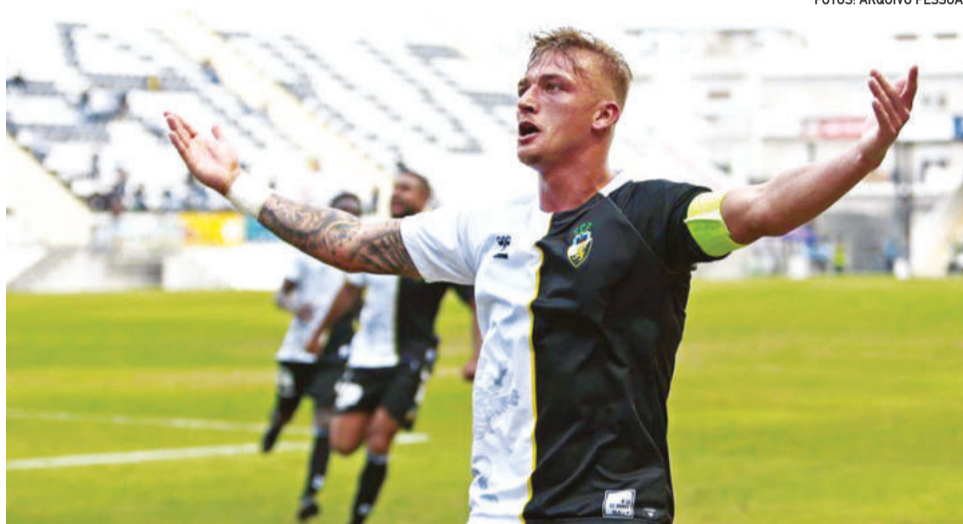
Lajeadense foi capitão do Farense, de Portugal