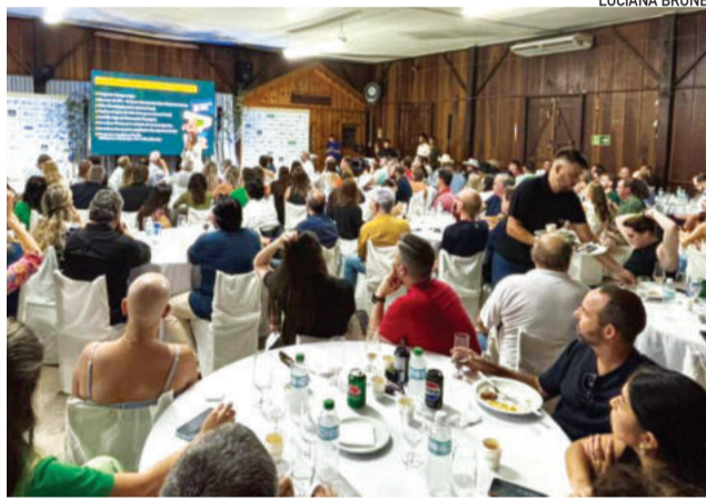
Reunião-almoço lotou para acompanhar a apresentação da prefeita

Com um orçamento que cresceu 23% em 2025, impulsionado pelo trabalho do setor privado, a Prefeitura