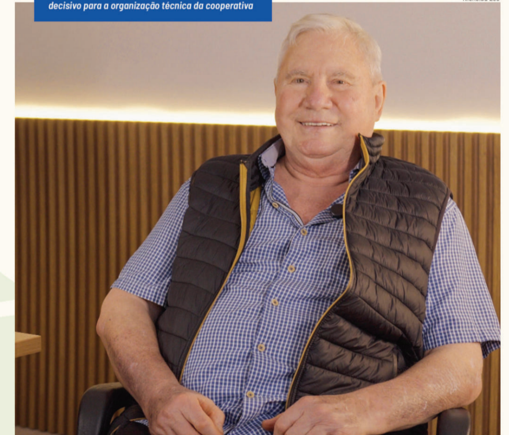
Brust trabalhou na Certel entre 1973 e 1974, período decisivo para a organização técnica da cooperativa

Brust também vê com otimismo o investimento da Certel na formação de novos profissionais e no incentivo à qualificação, fortalecendo a chamada “prata da casa”. “Eu espero que a Certel continue da forma como está trabalhando, que vai melhorar mais, e vai ser ainda mais reconhecida pelos associados”, acredita, vislumbrando um futuro de muitas conquistas para a cooperativa.