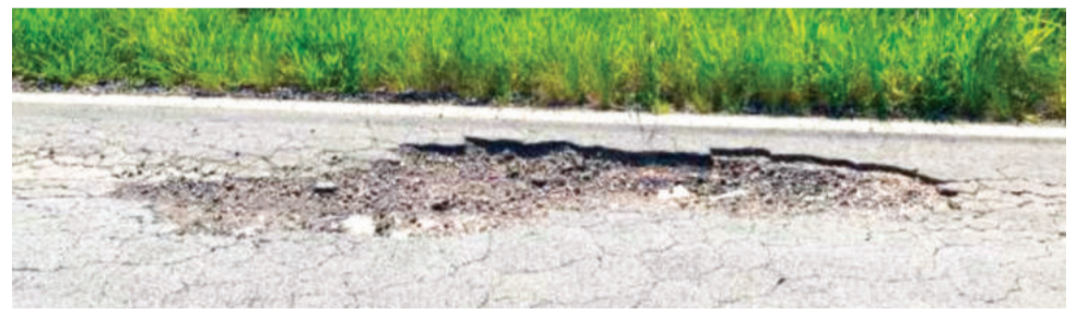
Levantamento fotográfico do Ministério Público traz mais de 200 imagens sobre o estado precário da rodovia

teria conhecimento dos problemas desde julho de 2025 sem solução eficaz.