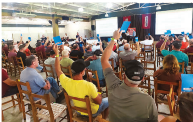
Associados aprovaram por unanimidade as contas de 2025 e o rateio de R$ 10 milhões em sobras

“Com isso, a cooperativa procura preservar a produção, garantir renda a quem está saindo e estimular o crescimento de quem permanece na atividade”, cita Birck. Para esse ano, o objetivo é ultrapassar a marca de 10 milhões de litros por mês.