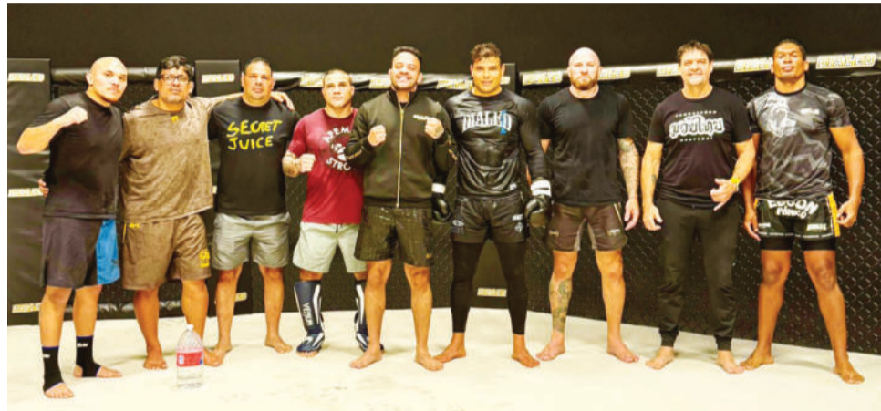
Time é recheado de especialistas para diferentes funções de combate

“Às vezes, treinamos mais no bruto e na luta em si. Aqui [EUA] é muito mais estratégico. Eles estu-