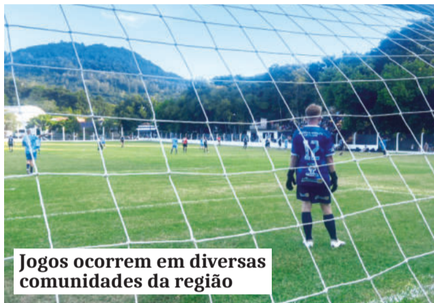
Jogos ocorrem em diversas comunidades da região

Imigrante, Estrela, Paverama, Taquari, Bom Retiro do Sul, Roca Sales, Encantado, Arroio do Meio, Nova Bréscia e Progresso realizam partidas