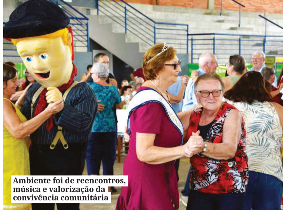
Ambiente foi de reencontros, música e valorização da convivência comunitária

Por fim, reafirmou o papel fundamental das gerações que contribuíram para a construção do município ao longo de 30 anos. “São pessoas que fizeram e fazem a diferença”, disse.