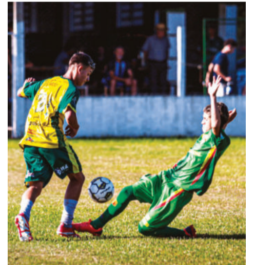
Ribeirense realizou amistoso antes do campeonato