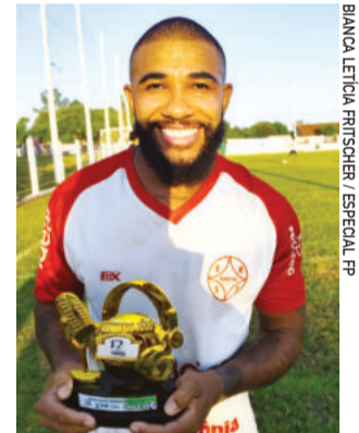
Didi, do Gaúcho