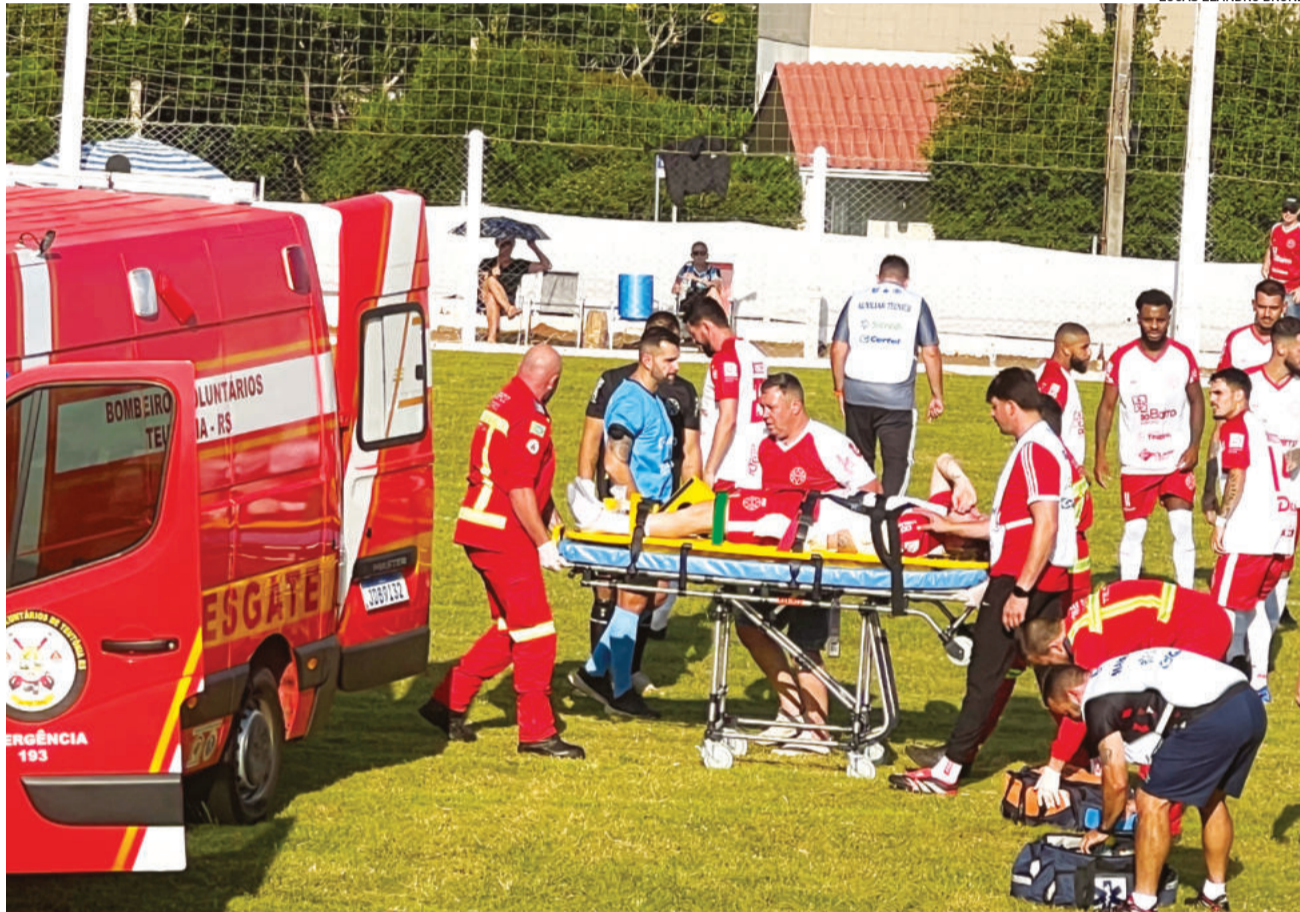
Atacante do Gaúcho precisou ser socorrido por ambulância