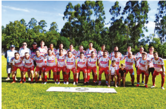
Elenco tem base do Bairro Canabarro

A parceria entre o treinador e o presidente, não é recente. Ambos já trabalharam juntos em outras con-