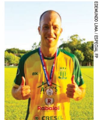
Sirena, do Ouro Verde