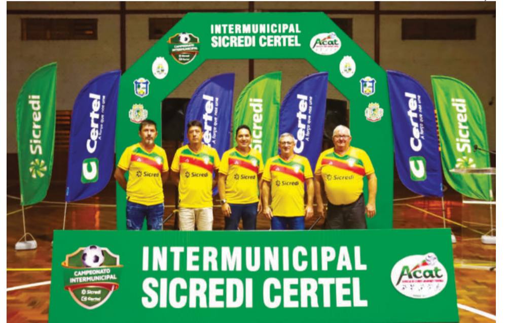
Nova diretoria foca em colocar a casa em ordem