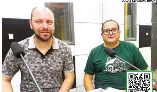
Schwarz (e) e Machado participaram do Espaço Aberto

O calendário já inicia com duas competições. O Campeonato Municipal de Bolão começa no dia 7 de abril com oito equipes - quatro masculinas e quatro femininas - e segue até julho. Logo na sequência, a bocha abre disputa em 11 de abril,