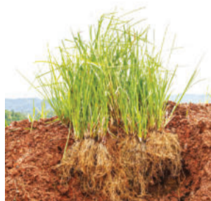
Planta versátil também pode ser utilizada em indústrias e no tratamento de efluentes

Outro destaque está na versatilidade da planta. O vetiver pode ser utilizado na indústria química, farmacêutica e alimentícia, especialmente na extração de óleos essenciais a partir de suas raízes.