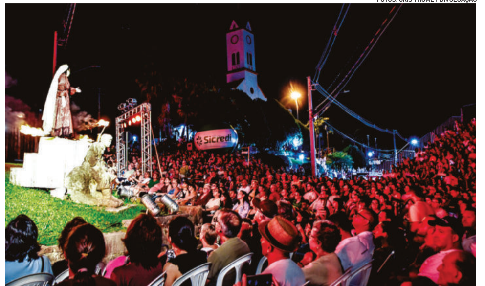
Cenas do dia a dia de Jesus até sua ressurreição emocionaram o público