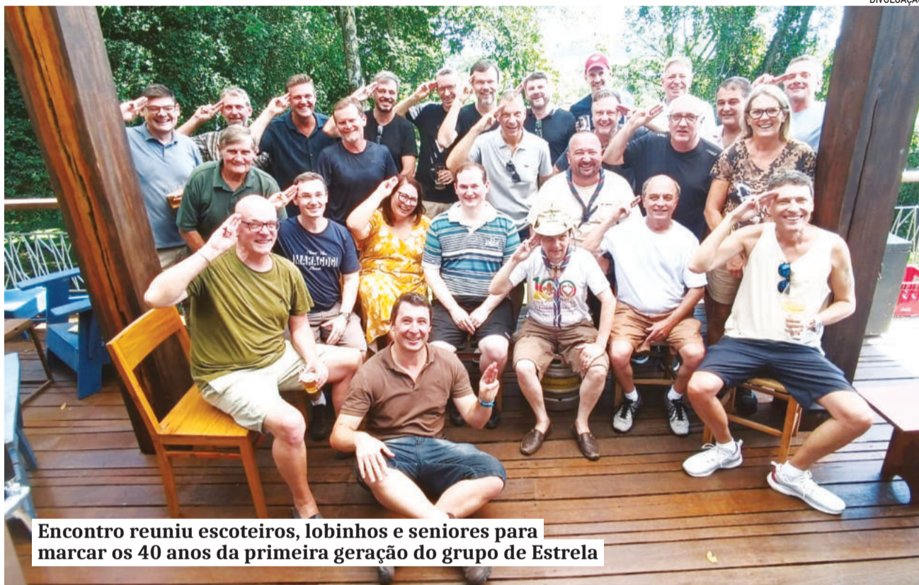
Encontro reuniu escoteiros, lobinhos e seniores para marcar os 40 anos da primeira geração do grupo de Estrela

Organizado por antigos integrantes, o encontro reuniu escoteiros, lobinhos e seniores, em especial os que participaram das primeiras décadas de atuação, período em que o movimento se consolidou como referência na formação de jovens na comunidade.