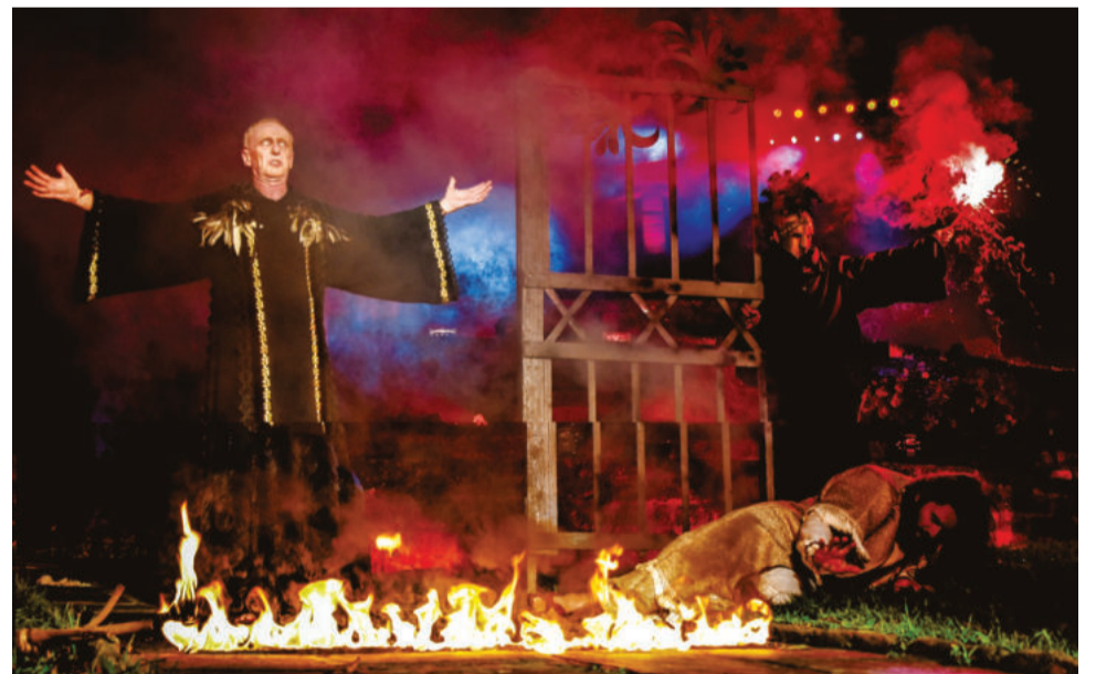
Efeitos visuais de fogo e luz impressionaram o público presente

Além da encenação, o evento contou com praça de alimentação, feira