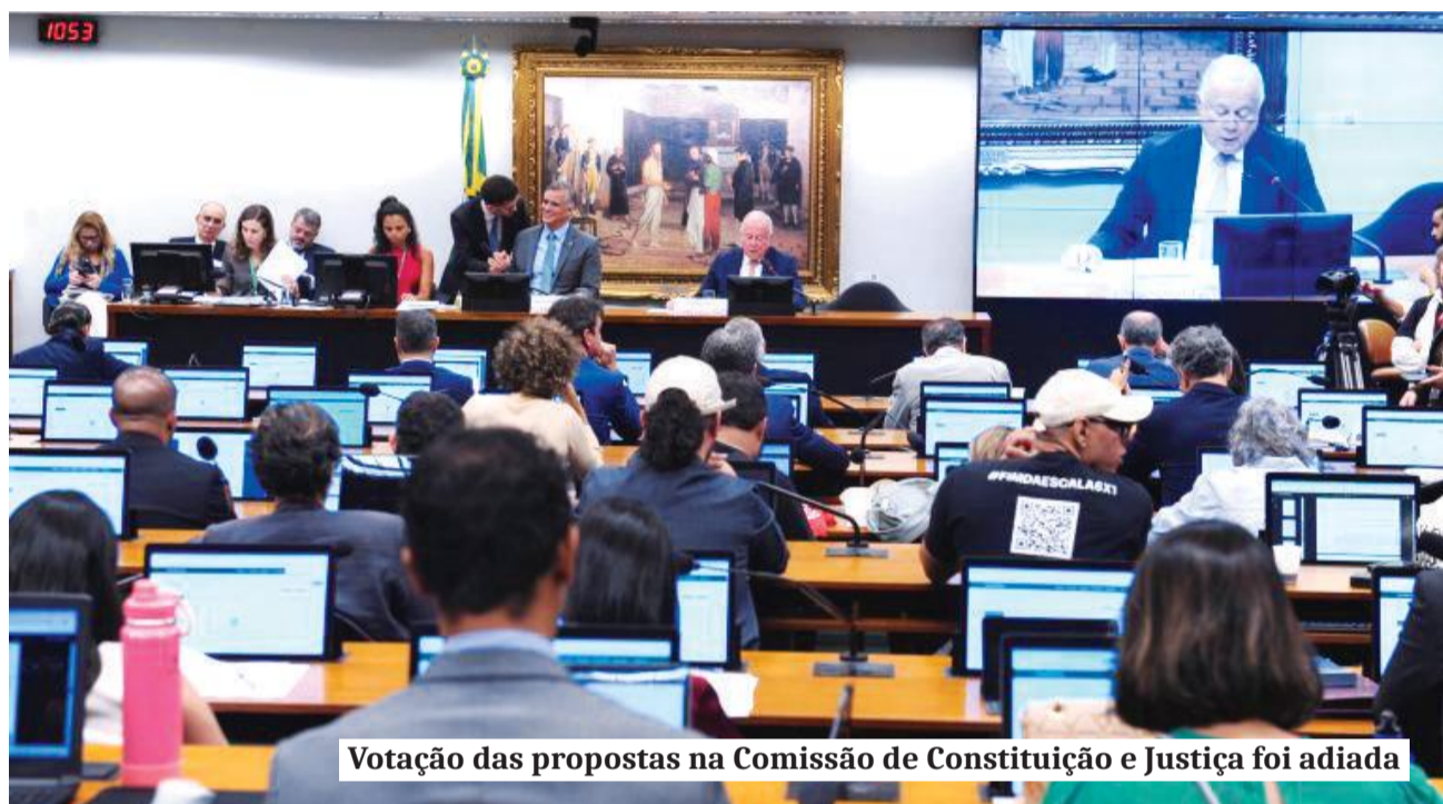
Votação das propostas na Comissão de Constituição e Justiça foi adiada

Governo federal apresenta projeto que reduz a jornada de trabalho para 40h semanais, com 2 dias de descanso. Entidades empresariais pedem mais tempo para debater propostas