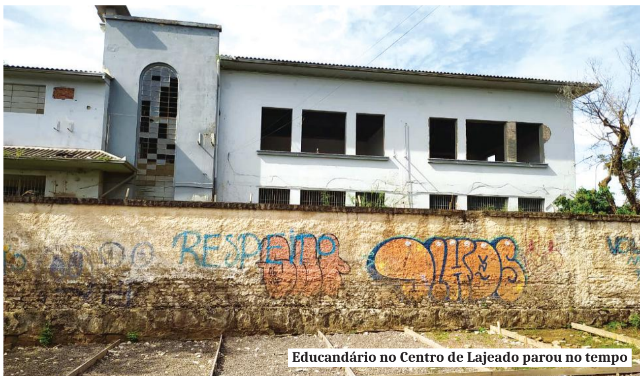
Educandário no Centro de Lajeado parou no tempo

A reportagem também procurou as secretarias estaduais de Obras Públicas e de Educação para esclarecer o andamento das obras, os critérios de prioridade e os cronogramas das reconstruções. Até o fechamento desta edição, não houve retorno.