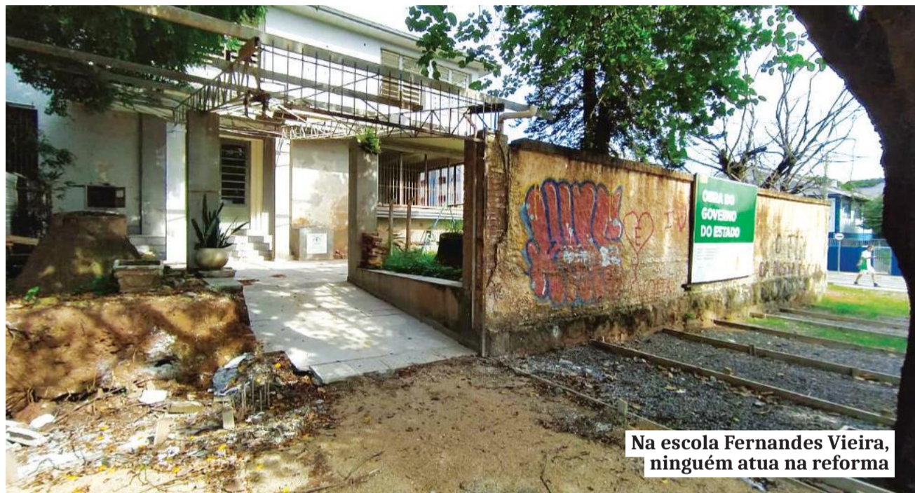
Na escola Fernandes Vieira, ninguém atua na reforma

Alunos seguem em estruturas improvisadas, obras enfrentam atrasos e escolas convivem com superlotação, falta de profissionais e incerteza