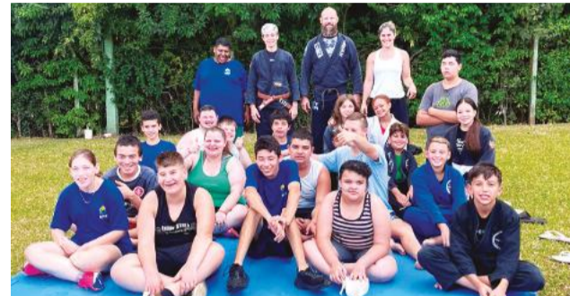
Atividades são realizadas com jovens atípicos