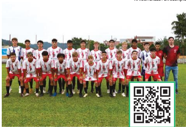
CTE, de Roca Sales, representará o município

A disputa também começou movimentada na Força Livre, com jogos equilibrados e participação de jovens talentos. “Temos uma safra muito boa, com atletas