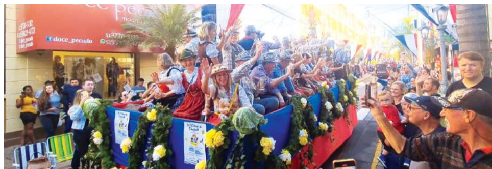
Cerca de 60 veículos devem participar do cortejo

O Festival do Chucrute apresenta uma programação que valoriza as tradições da cultura alemã e envolve diferentes públicos ao longo de