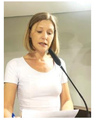
Vereadora abordou obras em andamento e entraves

Apresentou indicação voltada à comunidade de Seca Baixa, na qual sugere a construção de banheiros públicos em área de circulação. “O projeto precisa ser avaliado e implantado”, justificou. Segundo ela, o espaço é utilizado para lazer, atividades físicas e visitas ao cemitério, especialmente em fins de semana e datas comemorativas.