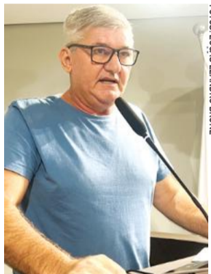
Rottoli idealizou a proposta

Ao defender a matéria na tribuna, o vereador destacou os riscos e transtornos causados pelo acúmulo desorde-