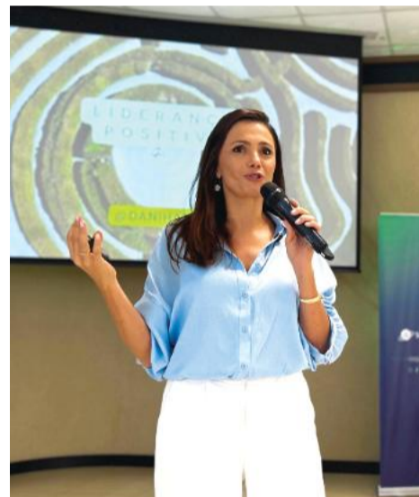
A gestora de felicidade apresentou atitudes para lideranças que buscam mais propósito, equilíbrio e resultados

res da felicidade, pois nele enxergamos propósito e talento. No entanto, também pode ser fator de adoecimento. Antes de sermos racionais, somos emocionais. Por isso, ambientes saudáveis não têm a ver só com a estética, mas com um local psicologicamente saudável. A ciência da felicidade é ferramenta, não só teoria”, disse.