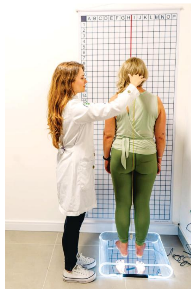
Avaliação postural e tratamento adequado auxiliam na qualidade de vida