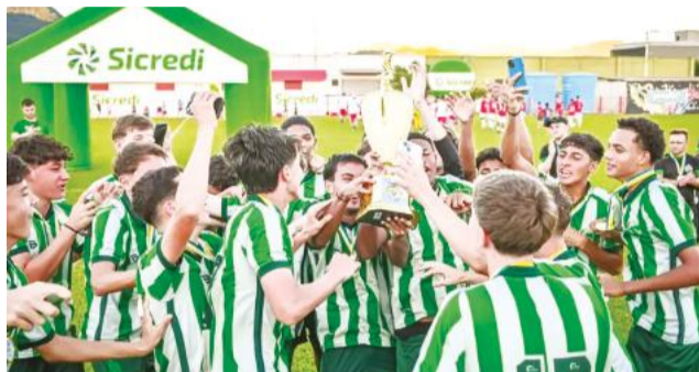
Elenco de Caxias do Sul festejou a vitória

As semifinais já haviam agitado a parte da manhã. No clássico Gre-