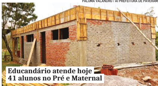
Educandário atende hoje 41 alunos no Pré e Maternal

Já no Ensino Fundamental, as três escolas do campo desenvolvem atividades em conjunto. São três turmas de tempo integral, sendo uma turma de 1º ano e uma