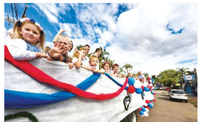
Em cima da carroceria dos caminhões decorados, participantes vestindo trajes típicos desfilaram pelas ruas centrais de Estrela, ao som de bandinhas