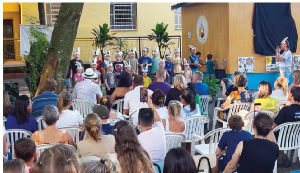
Inauguração foi acompanhada por famílias e membros de entidades