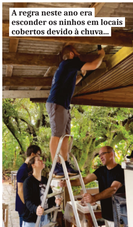
A regra neste ano era esconder os ninhos em locais cobertos devido à chuva...