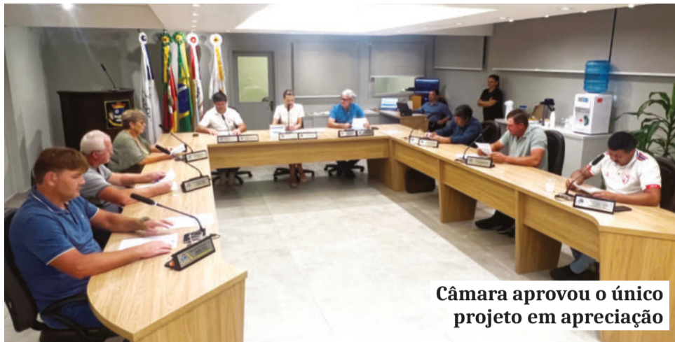
Câmara aprovou o único projeto em apreciação

O fiscal sanitário terá ampliada sua carga de 20h para 30h semanais, nos mesmos moldes já adotados para o cargo de fiscal ambiental. A medida atende à crescente demanda das atividades de vigilância sanitária, que envolvem fiscalização permanente, licenciamento, inspeções técnicas e atuação no exercício do poder de polícia administrativa, conforme atribuições