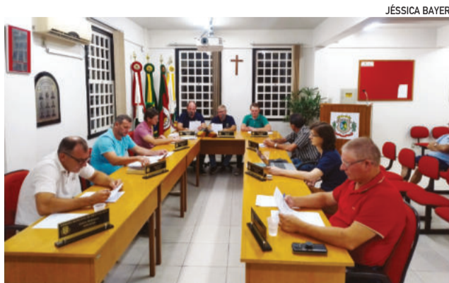
Recursos do SUS viabilizam R$ 210 mil para custeio de atendimentos, incluindo serviços realizados pelo Hospital Ouro Branco

Além disso, a área da saúde também concentrou parte significativa dos recursos aprovados. Os parlamentares autorizaram a abertura de R$ 50 mil para a manutenção