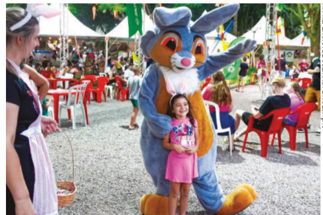
Coelhos atraíram a atenção de adultos e crianças

Para ele, o sucesso da Páscoa Encantada em Colinas é resultado do trabalho coletivo e envolvimento comunitário. “É essa união que faz o município crescer e se destacar cada vez mais”, disse.