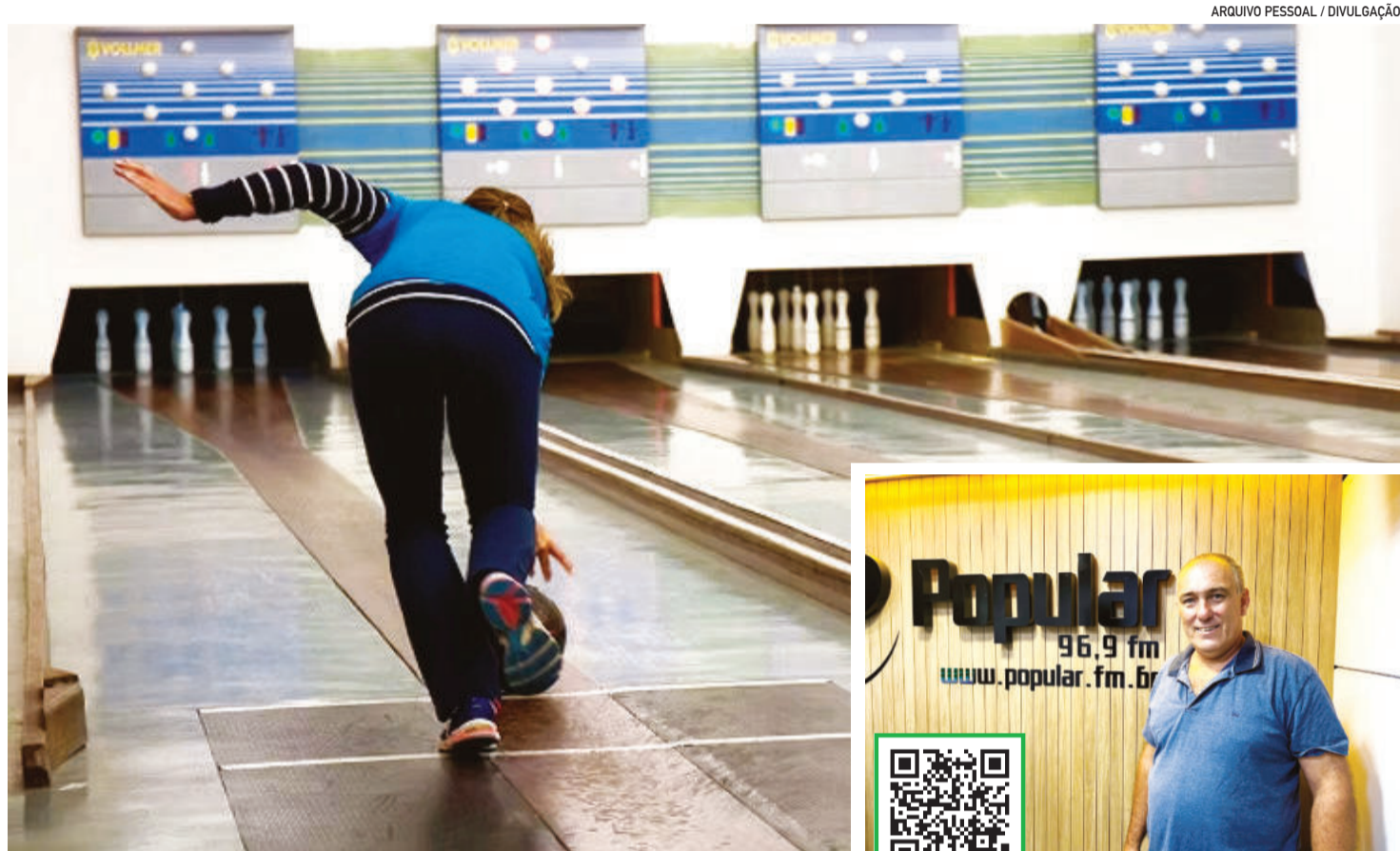
A prática do Bolão pode ser feita por todas as idades

“No segundo semestre, entramos com força nos regionais. Todos os grupos daqui participam, o que aumenta o nível de competição”, destaca Roth.